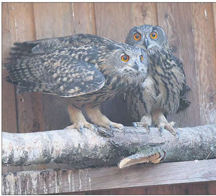
Die beiden Uhus sind nun alt genug und sollen beim Eulenfest am kommenden Mittwoch in die Freiheit entlassen werden.

HÖTZINGEN (suv). Viele der Geschichten kennen die Vorsitzende des Vereins Wildtierhilfe Lüneburger Heide und das Team der Einrichtung, bei anderen wie den verwaisenen Wildtieren können sie nur spekulieren. „Kakadu ‚Purzel‘ saß Jahrzehnte in einem kleinen Wellensittichkäfig“, manche Reptilien in der Auffangstation seien einfach in Wohnungen zurückgelassen worden und hätten - anders als die ebenfalls zurückgelassenen und schließlich verhungerten Katzen - überlebt, „weil Schlangen einfach länger ohne Nahrung durchhalten“, so Erdmann. Doch alle diese Geschichten haben eine positive Wendung genommen und die Chance auf einen Neuanfang bekommen, als die Tiere in die Auffangstation nach Hötzingen gebracht wurden. Dorthin, auf den Emhof, lädt die Wildtierhilfe für den 3. Oktober von 11 bis 17 Uhr zum Eulenfest ein - mit einem bunten Programm und einem echten „Happy End“: Denn an diesem Tag werden zwei Uhus wieder in die Freiheit entlassen.