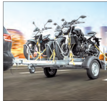
Der Anhänger bietet Platz für drei Bikes. Werkfoto: Humbaur

Nicht immer kann eine Motorradtour direkt vor der eigenen Haustür gestartet werden. Da ist ein Anhänger, der sich mit wenigen Handgriffen an ein Auto kuppeln lässt, ideal. Ein deutscher Hersteller hat einen Anhänger entwickelt, der sowohl Profis wie Freizeitbikern viele Vorteile bietet. Den Motorrad-Transportanhänger gibt es in zwei Gewichtsklassen: mit 750 beziehungsweise 1.000 Kilogramm zulässigem Gesamtgewicht. Insgesamt drei Motorräder können zugeladen werden. Werkfoto: Humbaur