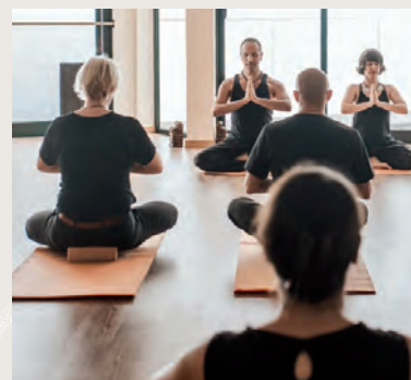
Mit Yoga Selbstheilungsprozesse fördern: Viele hoffen darauf. Die Branche boomt.

Diese fünf Ebenen stehen im engen Austausch miteinander. Wird aber eine der Dimensionen nicht beachtet, kann dies bei einer physischen Erkrankung die Heilung behindern. Die Yogatherapie bezieht alle Ebenen ein, um ein Optimum an Wohlbefinden für den Betroffenen zu erreichen.