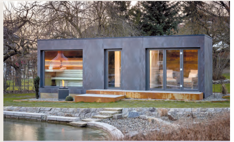
Die Außenhaut dieses Saunahauses besteht aus einer bei 1220 Grad gebrannten Keramik-Ummantelung, ist pflegeleicht, ultra dünn und sogar leichter als Aluminium.

stehend und als Anbau. Auch die Fensterelemente können individuell angeordnet werden, für Sicht-/Sonnenschutz sorgen Raffstores oder Textilscreens. Zur Fundamentierung empfehlen sich Schraubfundamente, da diese mit geringem Zeitaufwand ins Erdreich eingebracht werden und sehr stabilen Halt bieten.