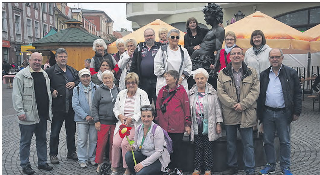
Auf ihrer Reise lernten die Soltauerinnen und Soltauer die Städte Mysliborz und Zielona Gora kennen.