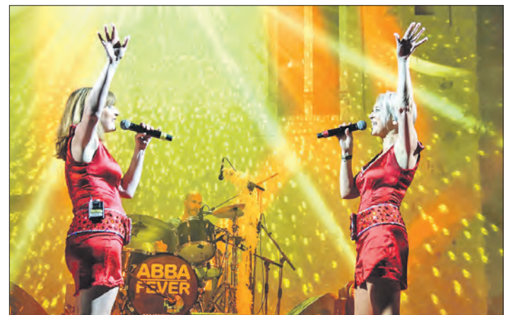
Das Kuratorium Soldatenheim präsentiert die Tributeshow „ABBA“-Fever.

Kuratorium Soldatenheim präsentiert Show