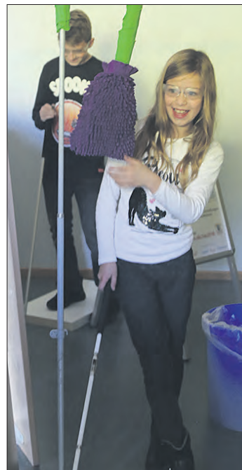
Mit dem Blindenstock in der Hand und einer Simulationsbrille auf der Nase absolvierten die Schülerinnen und Schüler den Hindernisparcours.

Saarstraße 16, Seminarraum. Am 10. Oktober heißt das Thema „Impfungen: Allgemein für Europa, speziell für das nicht-europäische Ausland, und warum überhaupt?“. Die Ärzte beantworten Fragen hinsichtlich der Entwicklung und nötigen Vorsorge für das Kind. Weitere Infos über das Sekretariat der Finkelstein-Klinik für Kinder- und Jugendmedizin unter der Rufnummer (05161) 6021431. Eine Anmeldung ist nicht erforderlich.