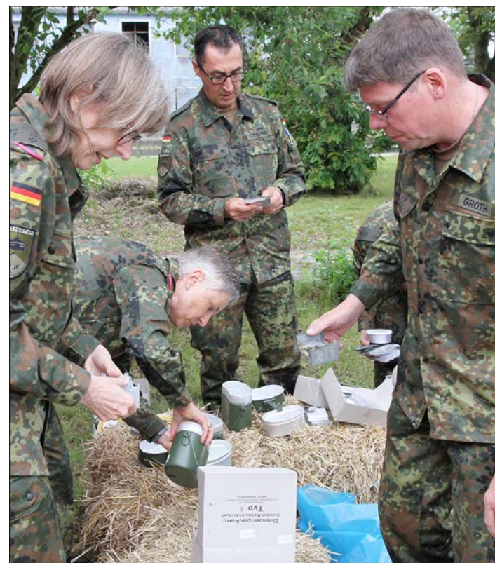
Wie die übrigen Teilnehmer der Informationsveranstaltung muß sich auch „Oberleutnant“ Cem Özdemir (Mitte) die Einsatzverpflegung selbst zubereiten.