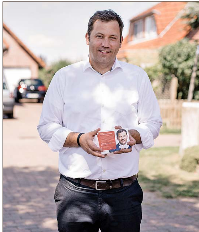
Der heimische Bundestagsabgeordnete Lars Klingbeil wird von Juli bis September für seine „Tour der Ideen“ in mehreren Orten unterwegs sein - so wie hier im vergangenen Jahr in Delmsen.

„Klingbeil im Gespräch“ in Schwarmstedt. Ab 18.30 Uhr steht der Bundestagsabgeordnete im Uhle-Hof allen Interessierten Rede und Antwort, so die bisherige Planung. Im August und September setzt Klingbeil dann seine Tour durch die Region fort.