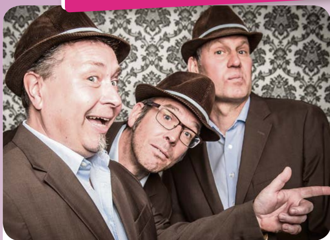
Die Band „Sitting Bull“ sorgt bei der kommenden „Musik am Mittwoch“ für Stimmung im Walter-Peters-Park.

„Sitting Bull“ - das sind frivole Big-Beats, gespielt auf historischen Instrumenten. „Wozu braucht man überhaupt vier Musiker in einer Band, wo doch drei komplett ausreichend sind. Das haben ja schon ‚The Police‘, ‚Nirvana‘, ‚ZZ-Top‘ und andere Bands in Triobesetzung zurecht beantwortet und die schlagkräftige Dreifaltigkeit in Gestalt von Gitarre, Baß und Drums mit Nachdruck bewiesen“, beschreibt die Formation ihren Charakter. Und bei den Musikern von „Sitting Bull“ sitzt im wahren Sinne des Wortes