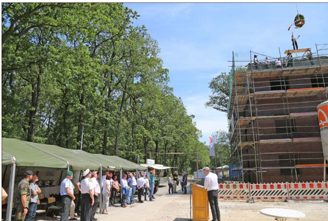
Zahlreiche Gäste verfolgten das Richtfest. Der Kranz „schwebte“ am Kran hängend ein.

Er freue sich als Standortältester daher sehr auf die Fertigstellung der vier Objekte und lobte ebenfalls die Leistungen der Handwerker: „Was Sie in nur kurzer Zeit geschaffen haben, ist wirklich klasse.“ Der Brigadegeneral wünschte den Teams auch weiterhin ein zügiges und unfallfreies Gelingen, „und wenn ich den Baufortschritt sehe, ist es nach ‚soldatischer Raum-Zeit-Rechnung‘ schwer zu verstehen, daß es bis zur Fertigstellung nun immer noch drei Jahre dauern soll. Daher interpretiere ich als Soldat das für April 2022 avisierte Bauende sehr deutlich als ‚spätestens‘.“