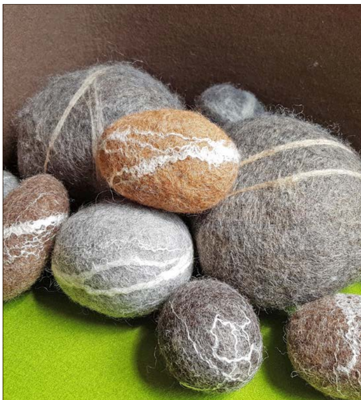
Filzsteine selbst herstellen können Interessierte in der Soltauer Filzwelt.

Nähere Informationen und Anmeldung zu den beiden Kursen unter Telefon (05191) 9737581 oder per E-Mail an filzen@filzwelt-soltau.de .