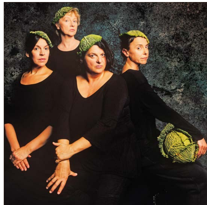
„Wirrer Wirsing und witzige Weisheiten“ - die „Alten Mädchen“ versprechen in ihrer Show beides.