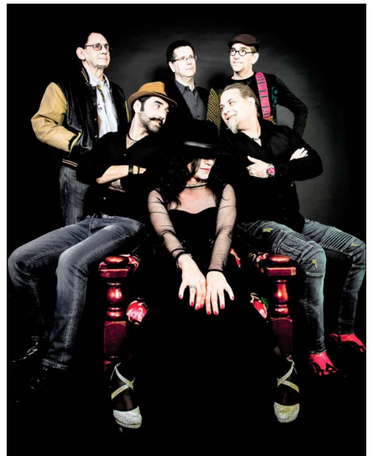
Am morgigen Montag, 1. Juli, ab 19 Uhr bei „Therme Live“ auf der Bühne: Die Band „Ella & the Jambrothers“.

„Ella & the Jambrothers“ bei „Therme Live“