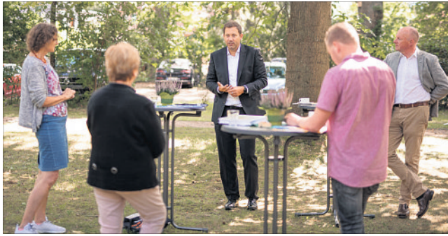
Wie in den vergangenen zwölf Jahren ist Lars Klingbeil in den Sommermonaten bei seiner „Tour der Ideen“ wieder unterwegs, um zuzuhören und Vorschläge der Menschen im Heidekreis und Landkreises Rotenburg aufzunehmen. Das Bild ist im letzten Jahr in Bispingen bei einem Austausch mit Vertretern des Bürgerrats entstanden.

Bundestagsabgeordneter Klingbeil sammelt Vorschläge