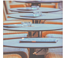
Die Mehrheitsgruppe SPD/Grüne im Schneverdinger Stadtrat spricht sich für eine Verlängerung der Ausschauzeiten im Bereich der Außengastronomie aus.

Gerade nach der langen Pandemiezeit, in der alle mit großen Einschränkungen, vor allem auch in diesem Bereich, leben mussten, verstärkte sich der Wunsch der Bürgerinnen und Bürger nach gastronomischen Angeboten. Die Mehrheitsgruppe: „Hierzu gehört unbestritten eine attraktive Außengastronomie. Auch unsere hoffentlich zahlreichen Touristen werden dieses Angebot sicherlich gern nutzen. Es müssen aber auch die geänderten Lebensumstände bedacht werden. Die Arbeitszeiten in vielen Berufen sind heute deutlich flexibler als vor einigen Jahren. Viele Berufstätige arbeiten täglich bis in die späten Abend-