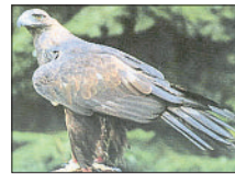
Vom 2. Juni an lassen sich Greifvögel wie den Steinadler hautnah erleben.

Weitere Informationen rund um die Führungen gibt es im Internet unter www.greifvogel-gehege.de sowie bei Frigga Steinmann-Laage unter der Telefonnummer (05194) 7888.