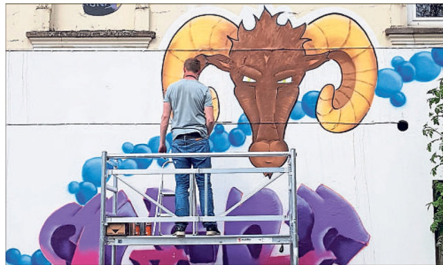
Die Graffiti-Künstler lieben ihrer Kreativität bei der Gestaltung der Fassade des maroden Gebäudes freien Lauf.

Graffiti-Künstler verzieren „Alte Schlachtere“