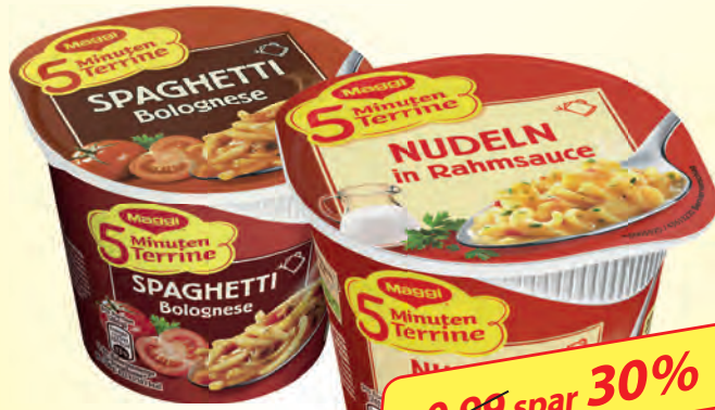
Maggi 5-Minuten-Terrine verschiedene Sorten 41-70-g-Becher je (100 g = 0.99-1.68 €)