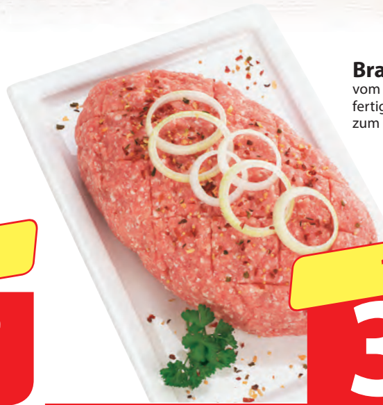
Braten-Mett vom Schwein, fertig gewürzt, zum Braten und Garen