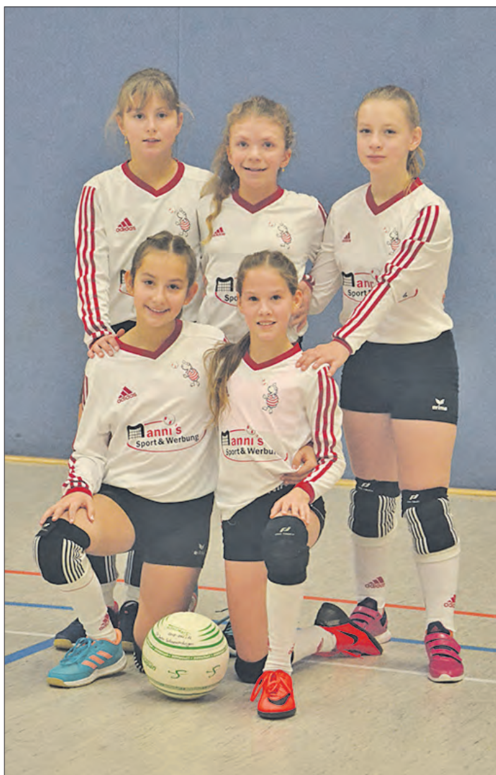
Auf dem dritten Tabellenplatz: die zweite U12-Mannschaft vom TV Jahn.

SCHNEVERDINGEN. Mit drei Siegen in drei Spielen gelang der ersten U12-Faustballmannschaft vom TV Jahn Schneverdingen ein optimaler Start in die neue Saison. Gegen die eigene „Zweite“ feierte sie beim ersten Spieltag in Bardowick zunächst einen souveränen 2:0-Erfolg. Auch in den beiden Spielen gegen Bardowick und Wangersen 1 war das Team ohne Satzverlust erfolgreich. Die Zweitvertretung vom TV Jahn konnte nach den Niederlagen gegen TV Jahn 1 und Wangersen 2 das letzte Spiel gegen Wangersen 1 mit 2:0 für sich entschei-