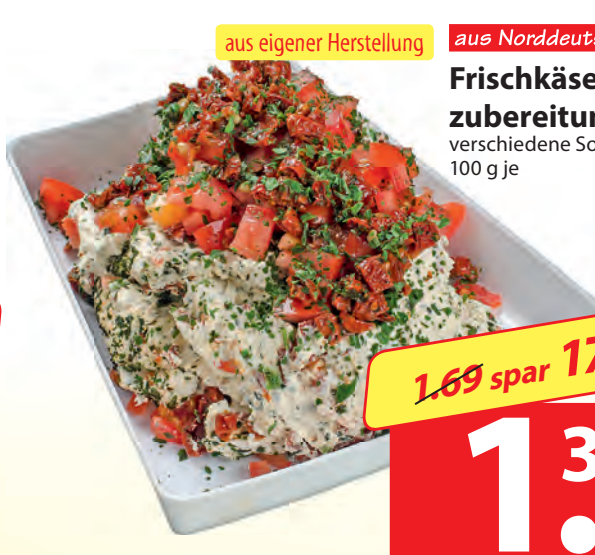
aus eigener Herstellung aus Norddeutschland Frischkäse- zubereitung verschiedene Sorten 100 g je