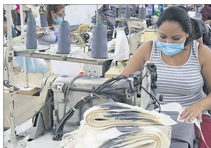
Näherinnen in Nicaragua arbeiten für einen Monatslohn, der kaum zum Überleben reicht, und ohne Arbeitsschutz und Sozialversicherung.

„Hunger nach Gerechtigkeit“ lautet deshalb das Motto der diesjährigen Aktion von „Brot für die Welt“. Es ist die 60. Aktion der evangelischen Hilfsorganisation. Seit 1958 engagiert sie sich in zahlreichen Ländern der Erde. Dort beraten Partnerorganisationen Kleinbauernfamilien, damit sie nachhaltig und umweltschonend vielfältige und gesunde Nahrungsmittel anbauen. Andere sind im Bereich der sozialen Arbeit aktiv, in