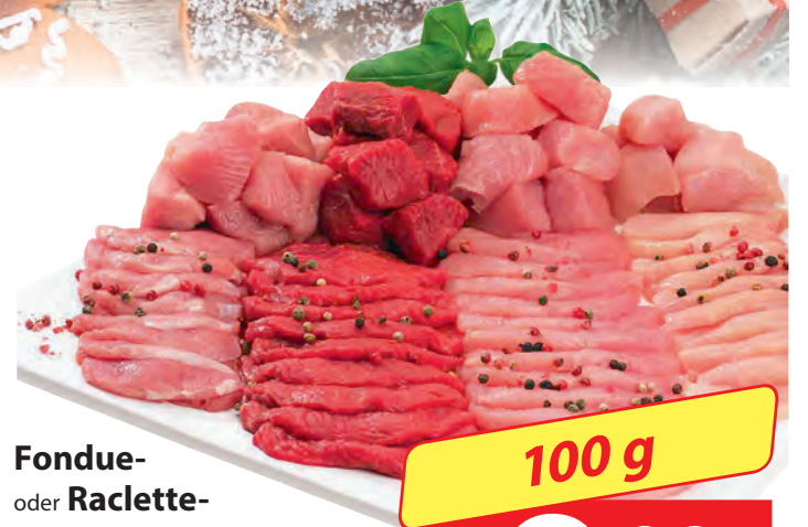
Fondue- oder Raclette- Fleisch „classic“ Kasseler, Schwein, Pute oder Hähnchenfilet anteilmäßig gemischt oder BLOCK HOUSE- Rinderhüfte 100 g = 1.99 €