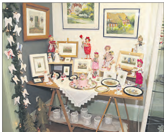
Ob Bilder, Keramik oder Holzarbeiten: die Initiatorinnen der Weihnachtsausstellung legen großen Wert auf eine ansprechende Präsentation.