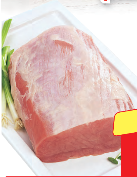
Schweine- lachsbraten ein saftiger Braten