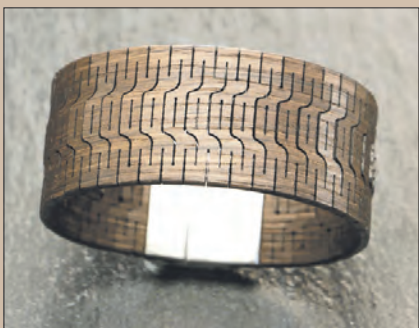
Schickes Armband aus Räuchereiche mit Edelstahl-Magnetverschluss.

Die neue Bridge-Kamera möchte ein mobiles und vielseitiges Aufnahmeerlebnis in vielen Bereichen bieten.