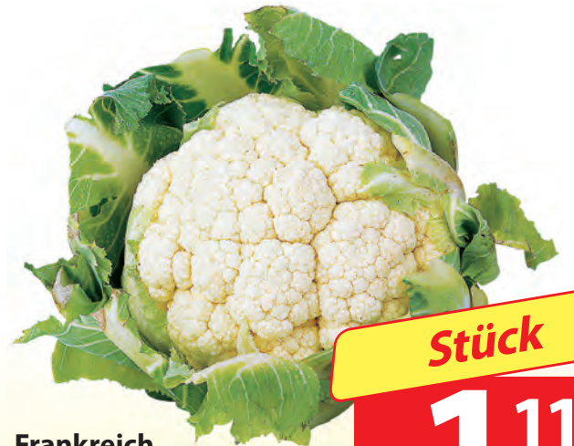
Frankreich Blumenkohl Kl. I