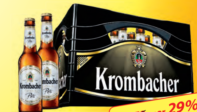
Krombacher verschiedene Sorten 24 Flaschen à 0,33 Liter 20 Flaschen à 0,5 Liter Kiste je (1 Liter = 1.32/1.05 €) zzgl. 3.42/3.10 € Pfand