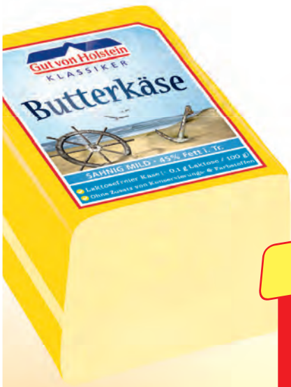
aus Norddeutschland Gut von Holstein Butter- oder Wilstermarsch-Käse deutscher halbfester Schnittkäse 45% Fett i. Tr. 100 g im Stück