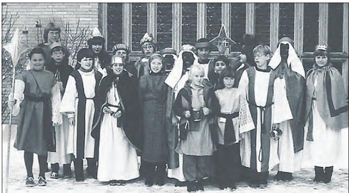
Bereits seit dem Jahr 1973 kommen Sternsinger in Munster zum Dreikönigs-Tag in die Häuser.

St. Michael sucht nun interessierte Mädchen und Jungen, die sich in den Dienst der guten Sache stellen möchten. Das erste Treffen der Munsteraner Sternsinger steht am Freitag, dem 30. November, um 17 Uhr in St. Michael auf dem Plan. Auch in Faßberg werden Sternsinger der Gemeinde am 4. und 5. Januar unterwegs sein. Weitere Informationen hierzu gibt es auf der Homepage der Gemeinde im Internet.