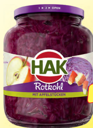
HAK Rotkohl mit Apfelstücken 720-ml-Glas (Abtropfgew. 700 g, 1 kg = 1.41 €)