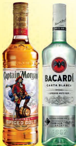
Bacardi Carta Blanca, Oro, Negra 37,5% vol., Oakheart 35% vol., Captain Morgan Original Spiced Gold 35% vol. 0,7-Liter-Flasche je (1 Liter = 12.84 €)