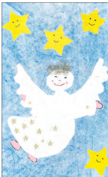
Welcher Stern darf in der Heiligen Nacht über dem Stall leuchten?

Alle putzen sich festlich heraus, nur einem kleinen Stern tut das Jesuskind in der Krippe so leid. Der kleine Stern denkt, er sei sowieso nicht schön genug, und sammelt, statt sich zu putzen, lieber nützliche Geschenke für das kleine Jesuskind. Wenn es schon in einem Stall zur Welt kommen soll, dann soll es doch