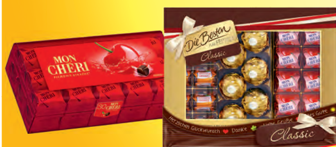
Ferrero Die Besten 269 g, Nuss-Edition 253 g oder Mon Chéri 315 g, Packung je (1 kg = 12.67-15.77 €)