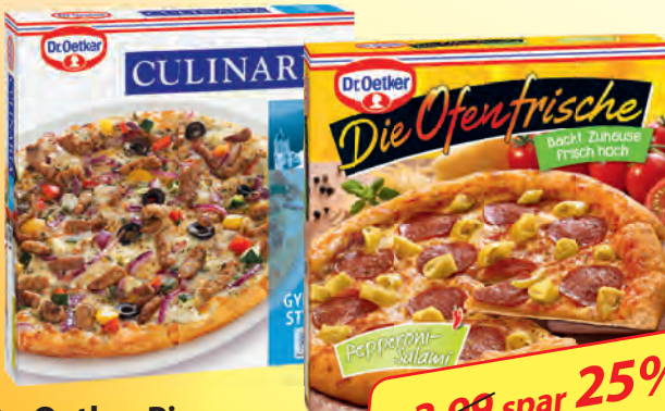
Dr. Oetker Pizza Die Ofenfrische oder Culinaria verschiedene Sorten, gefroren 355-435-g-Packung je (1 kg = 5.10-6.25 €)