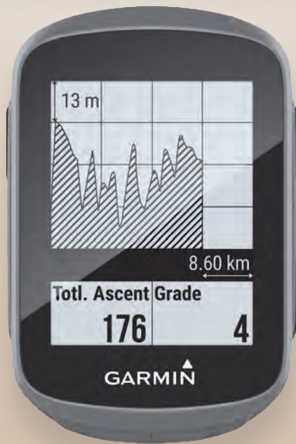
Der GPS-Fahrradcomputer ist 33 Gramm leicht.

Klein aber fein: ganz nach diesem Motto hat ein Navigationsspezialist einen neuen GPS-Fahrradcomputer auf den Markt gebracht. Das außerordentlich kompakte und 33 Gramm leichte Gerät bietet Strecken-Navigation sowie die Möglichkeit unzählige Tourendaten aufzuzeichnen.