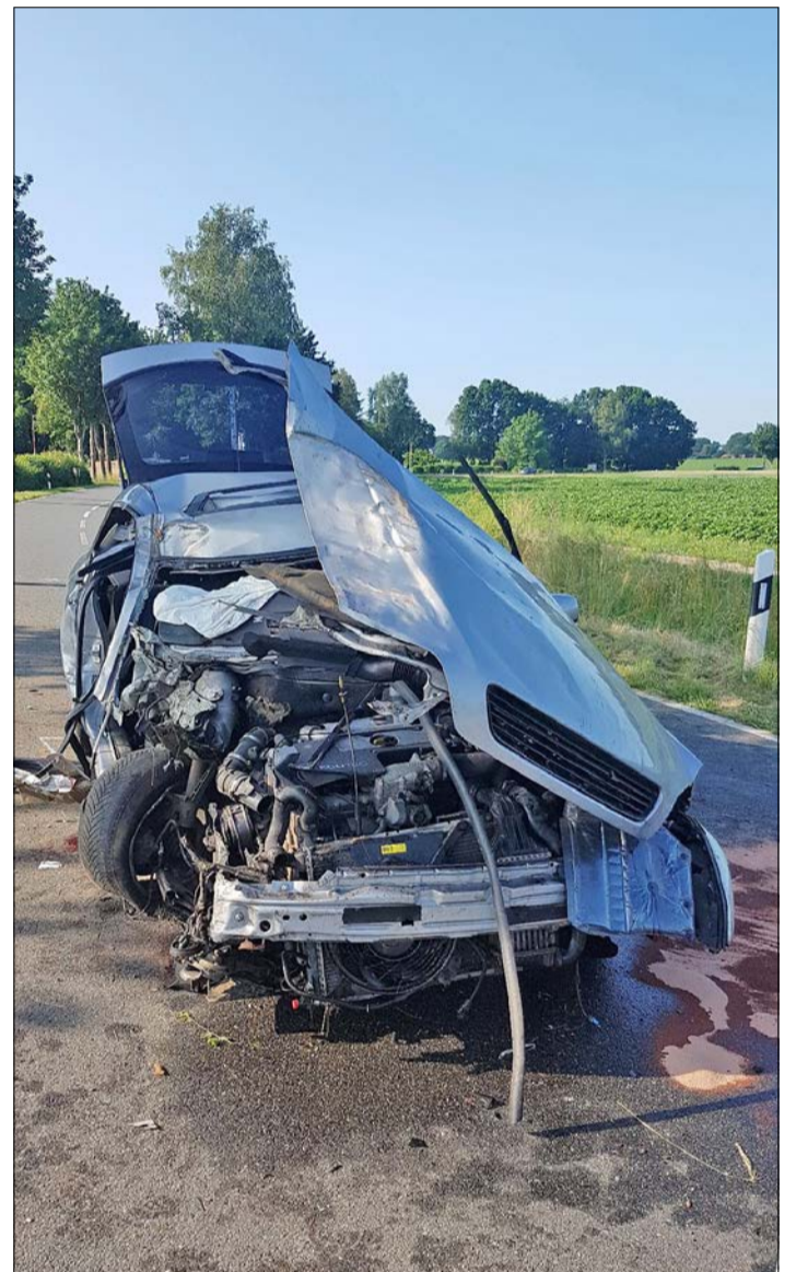
Das Fahrzeug prallte frontal gegen einen Baum.

BERGEN. Eine durchzechte Nacht führte zu einem schwerem Unfall. Dieser habe sich am Dienstagmorgen nahe Bergen ereignet, wie die Polizeiinspektion Celle jetzt mitteilt: „Gegen 7 Uhr fuhr ein Opel Astra aus Hagen kommend in Richtung Nindorf. In einer Linkskurve kurz vor dem Ortseingang kam der Fahrer nach rechts von der Fahrbahn ab und das Auto prallte frontal gegen einen Baum“, so der Polizeibericht. „Durch den Aufprall wurden der 23-jährige Fahrer und die 16-jährige Beifahrerin eingeklemmt und schwer verletzt. Die Beifahrerin musste von der Feuerwehr aus dem Fahrzeug befreit und aufgrund der Schwere ihrer Verletzungen mit dem Rettungshub-