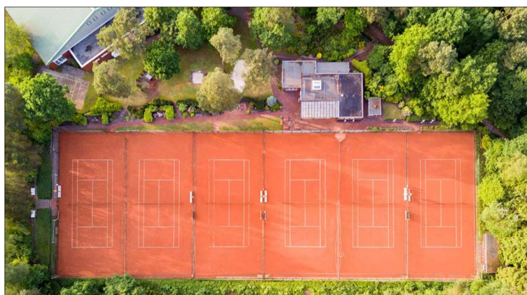
Die Tennisanlage des TC Munster aus der Vogelperspektive.

Schläger und Bälle für das Training werden gestellt. Termine und Zeiten gibt es nach Vereinbarung. Erwachsene zahlen statt des bisherigen Jahresbeitrages jetzt nur die Hälfte pro Jahr. Hier muss eine eventuelle Mitgliedschaft im TCM allerdings mindestens drei Jahre zurückliegen. Bei