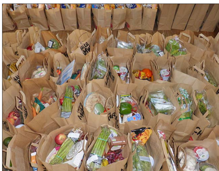
Das Tafel-Team packt die Tüten, die dann an die Kunden ausgegeben werden.

Doch angesichts der weiterhin wirksamen Corona-Gefahr wird die Tafel wohl auch künftig nicht auf die Tüten verzichten können. Und auch nicht auf das derzeitige Prozedere, selbst wenn das jetzt anders organisiert werden soll. Dazu Walter: „Auch die Freiwilligen von ‚Füreinander in Soltau‘ und DRK müssen inzwischen wieder arbeiten, sind also nicht mehr im bisherigen Umfang für die Lebensmittelausgabe