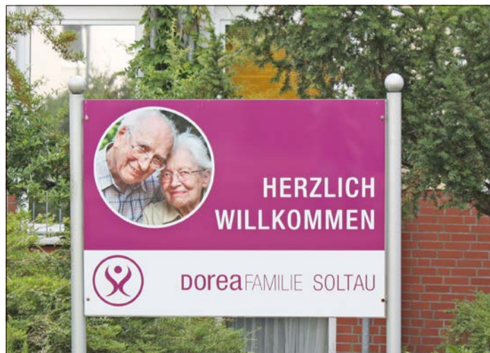
Alle angeordneten Maßnahmen sind aufgehoben worden.

Im Zuge eines vorsorglichen Corona-Screenings, dem der Landkreis alle 21 Pflegeheime im Heidekreis unterzieht, war der Test einer Pflegekraft der Soltauer Einrichtung positiv ausgefallen. In enger Kooperation von Landkreis und Gesundheitsamt sowie Heimleitung, Mitarbeiterschaft und Bewohnern wurden sogleich Maßnahmen wie Quarantäne, Besuchsverbot und Aufnahmestopp verhängt. Ein weiterer Test besagter Pflegekraft fiel dann allerdings negativ aus. Nach den neuesten Ergebnissen können nun alle Beteiligten wieder aufatmen.