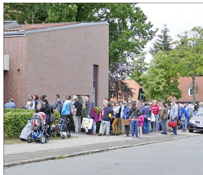
Auch bei der Tafel Soltau hat sich einiges verändert: Vor Corona drängten sich die Kunden noch in der Schlange (Foto oben), heute ist Abstand halten angesagt (Foto unten).

Durch das Vorpacken der Tüten und die schnelle „Fensterabfertigung“ hat sich die Ausgabezeit um rund eine Stunde verkürzt. Das, so Fuhrhop, sei zwar erfreulich, doch werde diese Zeiteinsparung unter anderem erst durch Wegfall der sozialen Kontakte beim Kaffeetrinken erreicht. Das wiederum sei bedauerlich.