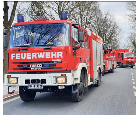
Die Freiwillige Feuerwehr Schneverdingen war mit zahlreichen Einsatzkräften vor Ort.

Im Einsatz waren die Freiwillige Feuerwehr Schneverdingen, der Rettungsdienst und die Polizei. Der Unfallwagen wurde mit Hilfe eines Abschleppunternehmens geborgen.