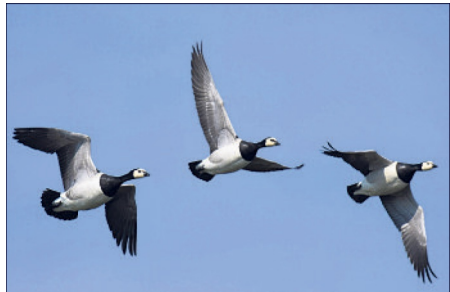
Eine am Soltauer Stadtrand gefundene Wildgans hatte sich mit dem Geflügelpestvirus infiziert.

Weitere Informationen zum Thema Geflügelpest sind auf der Internetseite des Niedersächsischen Landesamtes für Verbraucherschutz und Lebensmittelsicherheit unter dem Link https://tierseucheninfo.niedersachsen.de zu finden.