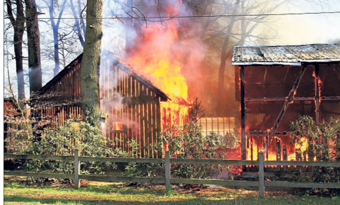
Beim Großbrand auf einer Hofstelle in Lünzenbrockhof entstand laut Polizei ein Schaden in Höhe von rund einer Million Euro. Verletzt wurde glücklicherweise niemand.

Dach und die Giebelseite eines Wohnhauses und auf der anderen Seite auf ein Nebengebäude übergreifen. Sofort wurde Großalarm ausgelöst. Zunächst waren die Frei-