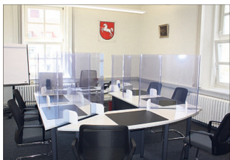
Der neue Sitzungssaal verfügt über Abtrennungen aus Plexiglas, demnächst soll noch die Technik für Videokonferenzen installiert werden.