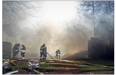
Das Löschwasser wurde aus einem Bach, einem Teich und Hydranten teilweise über mehrere Hundert Meter zur Einsatzstelle befördert.

LÜNZENBROCKHOF. Etliche Heidjer fragten besorgt in den sozialen Netzwerken, was denn in Lünzenbrockhof los sei. Dort stieg am vergangenen Samstagmittag eine Rauchsäule auf, die kilometerweit zu sehen war. Ursache war ein Großbrand auf einer Hofstelle. Eine Scheune, mehrere Nebengebäude und ein Wohnhaus standen in Flammen. Die Feuerwehr war mit einem Großaufgebot im Einsatz. Rund 200 Kräfte aus 17 Feuerwehren kämpften gegen die Flammen und konnten ein Übergreifen auf ein weiteres Wohnhaus, einen Schweinestall und ein Nebengebäude gerade noch verhindern. Verletzt wurde glücklicherweise niemand, jedoch sind 16 Bewohnerinnen und Bewohner von dem Großfeuer betroffen, die laut Kreisfeuerwehr Heidekreis „noch an der Einsatzstelle von Notfalleinsatzorgans und dem DRK betreut wurden.“