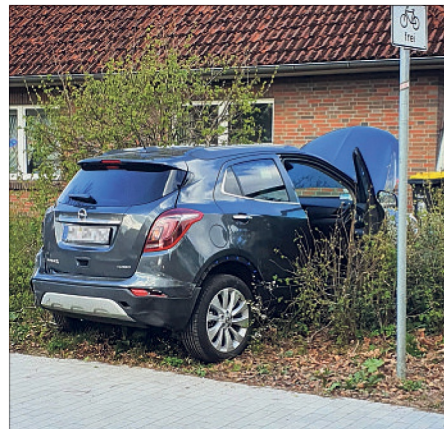
Nach der Kollision landete der Wagen in einer Hecke.

84-jähriger verwechselt Gas- mit Bremspedal