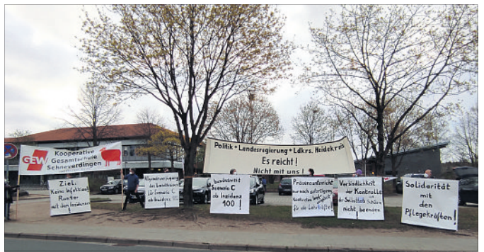
15 Lehrkräfte der KGS Schneeverdingen demonstrieren am vergangenen Freitag vor dem Unterricht gegen die Corona-Politik von Bund, Land und Landkreis.

Demo gegen Corona-Politik vor der KGS Schneeverdingen