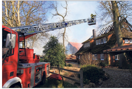
Rund 200 Feuerwehrleute kämpften gegen die Flammen und konnten drei Gebäude retten.

200 Feuerwehrleute im Einsatz / Rund eine Million Euro Schaden