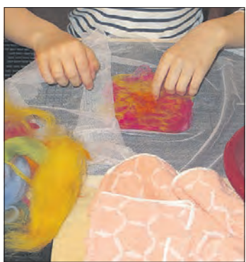
Grund- und Aufbaukurse zum Naßfilzen laufen in der Filzwelt Felto.

SOLTAU. Wer sich das Filzen schon immer mal von Grund auf aneignen wollte, hat mit einem dreiteiligen Kursangebot in der Filzwelt Felto an den kommenden beiden Wochenenden die Möglichkeit dazu. Die Einheiten können einzeln oder kombiniert besucht werden. Am kommenden Samstag, 30. Juni, macht ein Grundkurs den Anfang: Von 10 bis 13 Uhr erproben die Teilnehmer systematisch die Grundformen des Naßfilzens. Fläche, Kugel und Schnur bilden die Basis für weiterführende Filzprojekte. Jede der drei Formen erfordert ihre eigenen, besonderen Arbeitsabläufe, die in diesem Kurs trainiert und mit unterschiedlichen Wollsorten ausprobiert werden. Der Grundkurs eignet sich für Anfänger und kann als Vorbereitung für den Aufbaukurs am Nachmittag genutzt werden. Von 14 bis 17.30 Uhr folgt dann der erste Aufbaukurs zum Thema Hohlformen, bei dem die Teilnehmer aus der Fläche eine dreidimensionale Form „wachsen“ lassen. In Schablonentechnik kann so beispielsweise eine Schale, ein Windlicht oder ein Gefäß entstehen. Eine Woche später folgt am Samstag, 7.