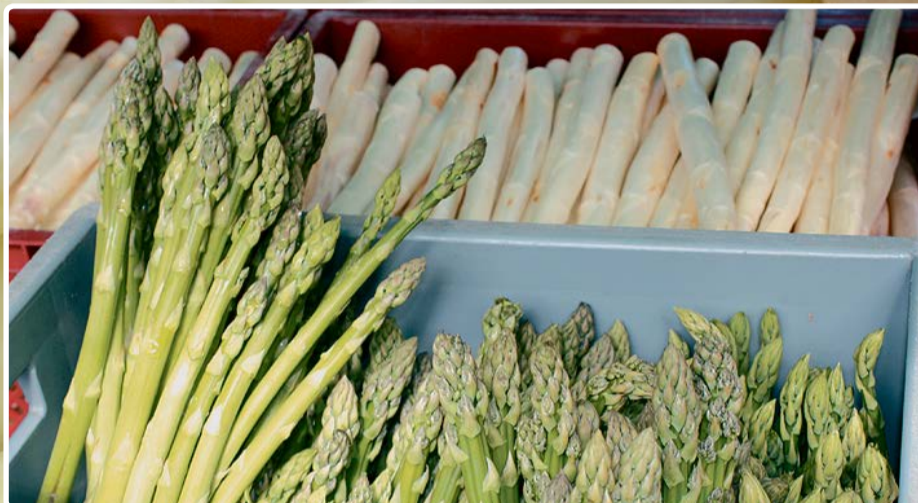
Frischer Spargel ist ein Genuss. Und je kürzer der Weg vom Feld zum Verkaufsstand, desto besser ist in der Regel das edle Gemüse.

Meist wird das feine Gemüse in hiesigen Bretten als zarter Bleichspargel genossen, aber auch die violette oder grüne Variante ist gefragt. Egal, welcher Farbe man den Vorzug gibt, aus botanischer Sicht handelt es sich immer um Stängelsprosse. Diese wachsen aus dem Wurzelstock der Spargelpflanze - dem sogenannten Rhizom. Um den milden Bleichspargel zu erhalten, werden Dämme aus sandiger Erde über den Wurzelstöcken gezogen und mit Folie abgedeckt. In diesen wachsen die Sprosse, wo sie kurz bevor sie aus der Erde kommen mit einer Länge von rund 20 Zentimetern gestochen werden. Einmal ans Licht gelangt, wird die Bildung von Anthocyanen angeregt, die Spitzen verfärben sich bläulich bis violett, später auch grün.