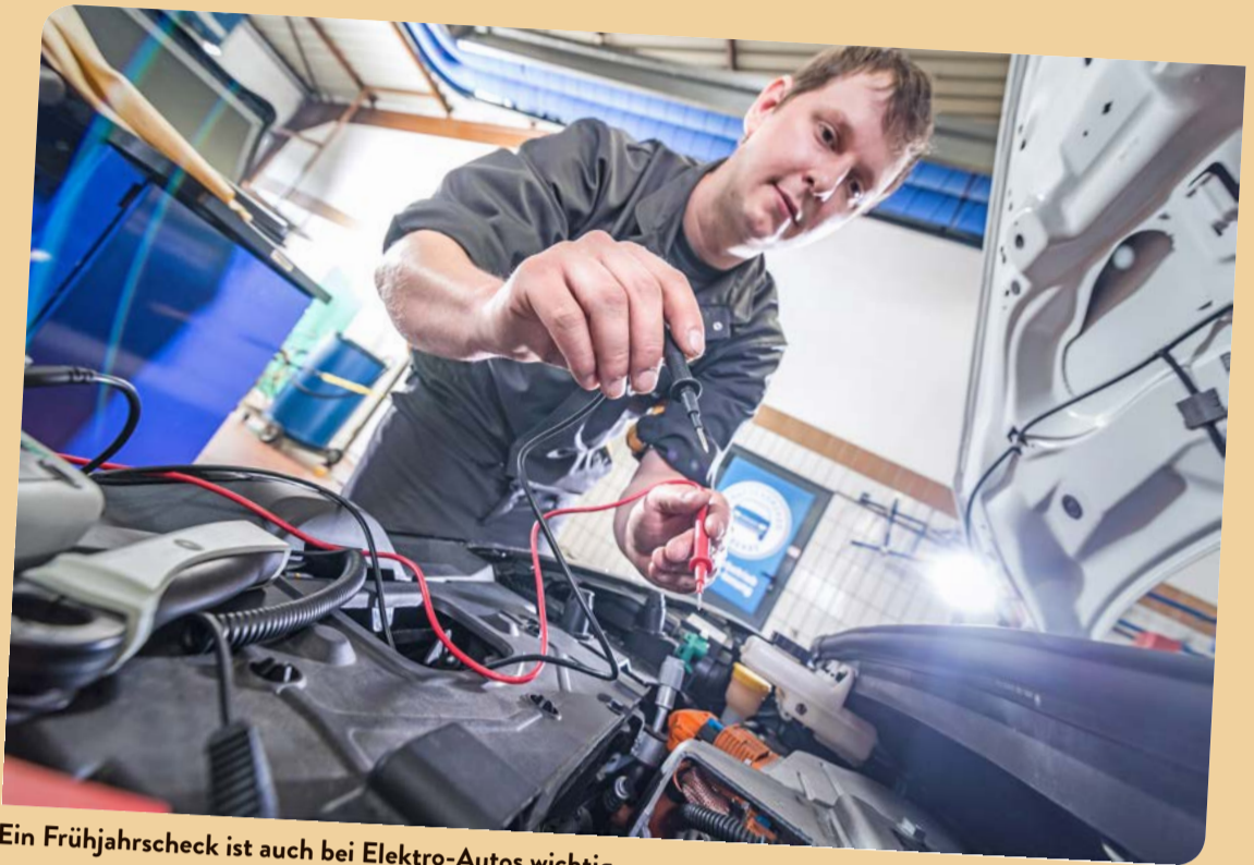
Ein Frühjahrscheck ist auch bei Elektro-Autos wichtig.

Prüfen: Beim Rundgang ums Auto machen sich die Profis selbst ein Bild. Was ist defekt? Was muss nachgebessert werden? Auf der Hebebühne ist der Blick frei auf Bremsen, Unterboden, Achsen, Auspuff und Stoßdämpfer.