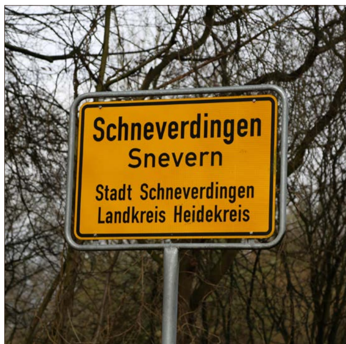
In Schneverdingen gibt es mit Abstand die meisten Coronainfektionen im Heidekreis.

Dass sich eventuell vermehrt Familienmitglieder betroffener Perso-