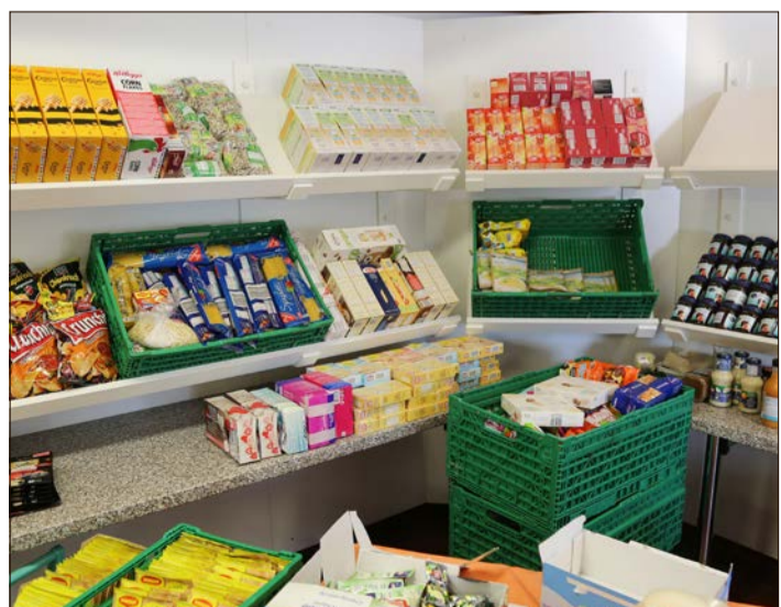
Die Tafeln geben wieder Lebensmittel aus.

Die notwendigen Entscheidungen über das weitere Vorgehen der Soltauer Tafel werden wöchentlich wegen der aktuellen Lage und in enger Abstimmung mit Silke Thorey-Elbers von der Stadt Soltau getroffen.