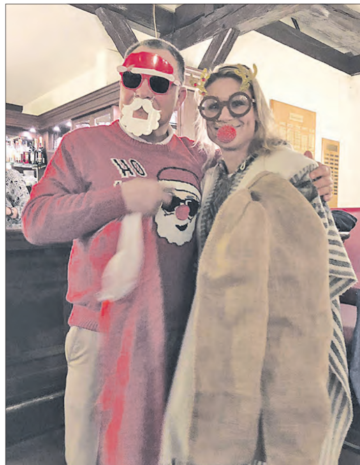
Spaß muß sein: Gute Stimmung herrschte bei der Jahresabschlußfeier der Soltauer Golferinnen und Golfer.