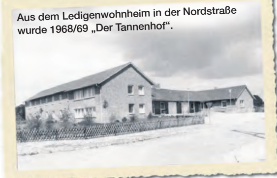
Aus dem Ledigenwohnheim in der Nordstraße wurde 1968/69 „Der Tannenhof“.