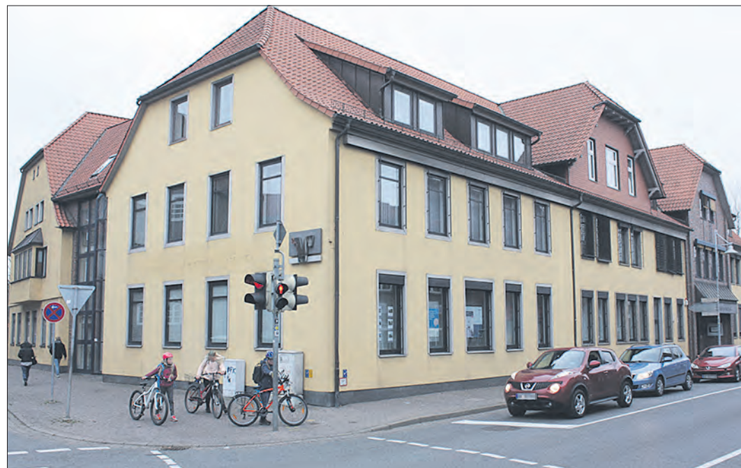
Das alte Soltauer Volksbankgebäude soll einem neuen weichen. Damit verbunden wären erhebliche Veränderungen in diesem Bereich der Wilhelmstraße.

Allerdings kann es noch ein Weil- chen dauern, bis das Volksbank- Vorhaben umgesetzt sein wird: Pan- nier rechnet hier mit zwei bis drei Jahren, immer vorausgesetzt, das