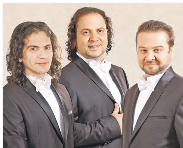
Das Ensemble Sacralissimo ist am 2. Dezember in Soltau zu Gast.

Sacralissimo mit sacralen Liedern und Arien