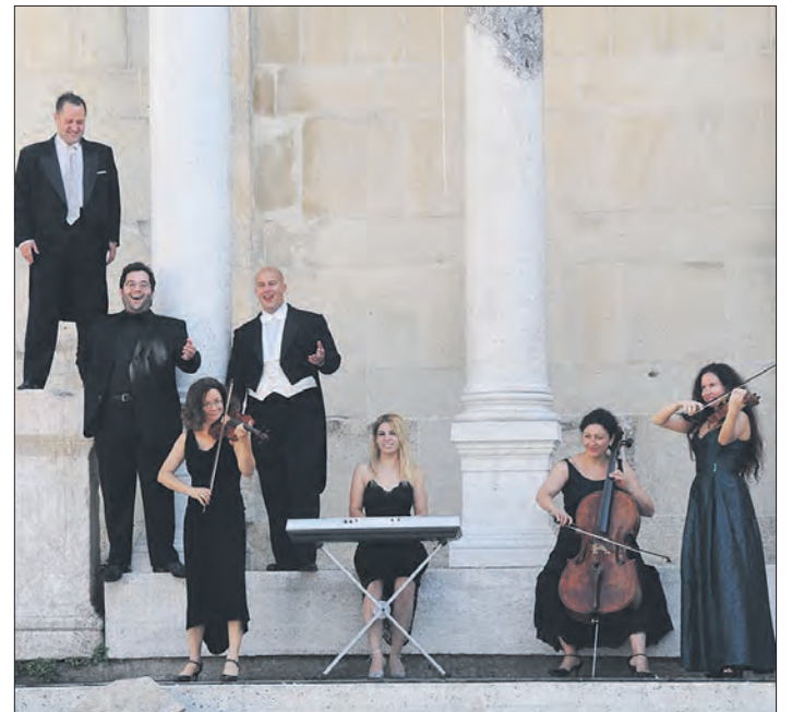
Bei der „Himmlichen Nacht der Tenöre“ in der Eine-Welt-Kirche werden die Opersänger von einem Streichensemble begleitet.

SCHNEVERDINGEN. „Die Himmliche Nacht der Tenöre“ verspricht für den 28. Dezember ab 19.30 Uhr ein ganz besonderes Konzert in der Eine-Welt-Kirche in Schneverdingen: Drei Opersänger, die live von einem Streichensemble begleitet werden, präsentieren Klassik-Highlights der besonderen Art. Mit dieser Tournee feiert das Ensemble zugleich sein 15jähriges Bestehen.