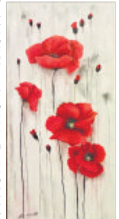
Beim Künstlernachmittag in Dorfmark zeigt eine ganze Gruppe Kreativer verschiedene Arbeiten.

der, Postkarten und hat besondere Mischungen von Kräutern dabei. Die Künstler freuen sich auf viele Gespräche mit Interessierten. Der Eintritt ist frei, die Coronaregeln müssen eingehalten werden.