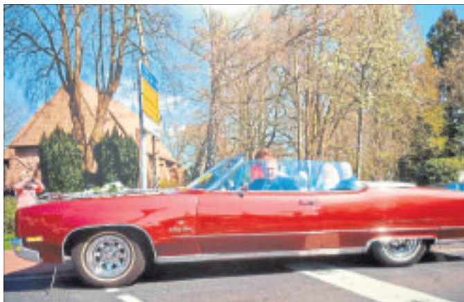
Freunde schicker „Oldies“ dürfen sich auf die zehnte internationale „VFM Heide-Classic, eine Ausfahrt für Automobile vergangener Epochen, freuen, die am 31. Juli auf dem Plan steht.

SCHNEVERDINGEN. Am Samstag, 17. Juli, zwischen 16.40 und 17.00 Uhr kam es auf dem Aldi-Parkplatz an der Marktstraße in Schneverdingen zu einer Unfallflucht: „Ein blauer Honda Civic, der linksseitig vom Eingang auf dem dritten Parkplatz neben dem Parkplatz für Behinderte abgestellt war, wurde hinten rechts durch ein unbekanntes Fahrzeug beschädigt“, so der Bericht der Polizeiinspektion Heidekreis. Hinweise nimmt die Polizei Schneverdingen unter Ruf (05193) 982500 entgegen.