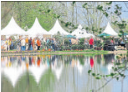
Auf dem Landgut Wienhausen bei Celle dürfen Besucher beim großen Gartenfestival wieder schauen und genießen.

WIENHAUSEN. „Gourmet & Garden“ heißt die Veranstaltung, bei der Besucher vom 5. bis 8. August (Donnerstag bis Samstag jeweils von 10 bis 18 Uhr und Sonntag von 11 bis 18 Uhr) auf dem Landgut in Wienhausen, Mühlenstraße 8, bei Celle wieder schauen und genießen dürfen. Für das große Gartenfestival verlost der Heide-Kurier zehnmal zwei Freikarten.