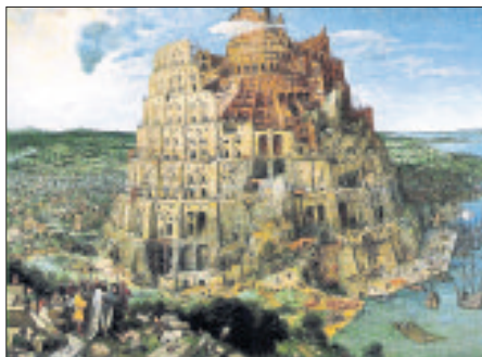
„Bilder zur Bibel“ - so heißt die Predigtreihe in der Sommerzeit, in der Pastorinnen und Pastoren der Region Schneeverdingen, Neuenkirchen und Heber in den Sommergottesdiensten jeweils persönlich ausgewählte Darstellungen präsentieren.

etwa auch außerbiblische Szenen wie von Lucas Cranach und Ernst Barlach in den Fokus genommen. Die Verführungsgeschichte von David und Bathseba im Bade hat durchaus erotische Qualität, die Kreuzigungsszene von Matthias Grünewalds Iseheimer Altar verlangt kriminalistischen Spürsinn. Und am Jakobsbrunnen geht es um die Kraftquelle. Weiterführende Hinweise sind im Gemeindegazette „Evangelisch bei uns“ und auf den Internetseiten der Kirchengemeinden zu finden.