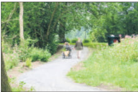
Barrierearm unterwegs auf dem neuen Bispinger Wanderweg, der sich über 500 Meter durchs Grün der Luheniederung entlang des Flusses windet - und doch fast mitten durch den Ort führt.

Der Baustart im Februar dieses Jahres, erinnerte sich Büthuis, „umgesetzt werden“, so der Bürgermeister, die Realisierung des Projektes sei dann aber erst zwei Jahre später erfolgt: „Durch Verzögerungen wegen Abstimmungen mit der Unteren Naturschutzbehörde und sich daraus ergebenden Forderungen nach landschaftspflegerischen Beiträgen konnte mit der Baumaßnahme erst Anfang 2021 begonnen werden. Der Förderzeitraum musste deshalb mehrfach verlängert werden, nämlich bis zum 30. Juli 2021.“