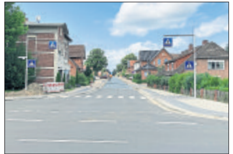
Der Ausbau der Breloher Straße steht unmittelbar bevor.

Die Stadtverwaltung weist darauf hin, dass die Straße in den jeweiligen Bauabschnitten während der Bauarbeiten für den Durchfahrtsverkehr komplett gesperrt wird. „Je nach Baufortschritt werden sich die Stadt Munster und die Baufirma darum bemühen, dass Anlieger ihr Grundstück anfahren können. Dies wird jedoch wegen des kompletten Rückbaus der Straße und des einseitigen Gehweges über längere Zeiten leider nicht möglich sein, so dass Anlieger ihre Fahrzeuge in den Nebenstraßen abstellen müssen“, heißt es in einer Mitteilung