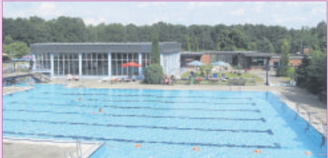
Das Luhetalbad Bispingen steht für echtes Freibadvergnügen.

bereich mit 25-Meter-Bahn sowie Sprung-, Nichtschwimmer- und neuem Kleinkinderbecken verfügt außerdem über eine Wasser- rutsche sowie über ein großes idyllisches Areal als Liegewiese. Reichlich Spaß und Abwechslung verspricht der riesige Außenbereich mit seinen vielen Möglichkeiten. In den Becken sind die Bahnen durch Schwimmleinen getrennt: Ein Plan zeigt, wie die Schwimmer zueinander Distanz halten und trotzdem ihre Runden drehen können. Weitere Infos – auch zu den aktuellen Vorschriften zur Eindämmung der Corona-Pandemie – finden Interessierte online unter www.ihr-stadtwerk.de .