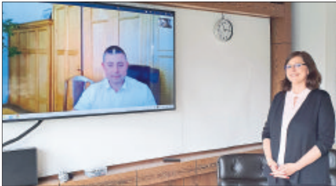
Munsters Bürgermeisterin Christina Fleckenstein spricht per Videokonferenz mit ihrem russischen Kollegen Maxim Charnikow, Bürgermeister von Mitschurinsk, über die seit drei Jahrzehnten bestehende Städtepartnerschaft mit der russischen Stadt 400 Kilometer südöstlich von Moskau.

Es folgte ein Austausch der Erfahrungen und Maßnahmen im Umgang mit dem Corona-Virus und den daraus resultierenden Lockdown. Beide Städte hoffen auf eine baldige Entspannung der Situation, die dann auch wieder gegenseitige Besuche zulassen werde. Bürgermeister Char-