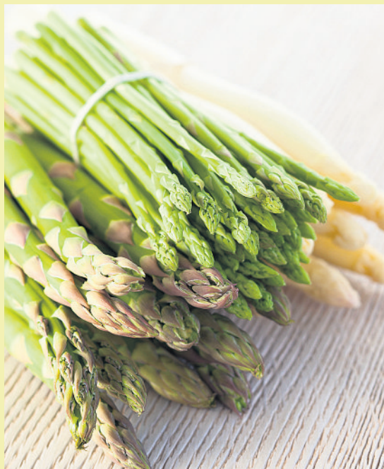
Das leckere „Königsgemüse“ bietet dem Körper eine Fülle an gesunden Inhaltsstoffen.

Für die Spargelzubereitung gibt es viele Möglichkeiten: Egal ob roh im Salat, mit einem Dip als Rohkost oder gekocht, als Suppe oder Ragout. Kombiniert mit frischen Kartoffeln, gekochtem Schinken oder Schnitzel schmeckt Spargel besonders lecker. Auch zusammen mit anderen Gemüsearten, Rinderfilet, Fisch und Reis oder Risotto, können Köche köstliche und figurfreundliche Gerichte zaubern. Für das Kochen von Spargel eignen sich hohe Töpfe, in die die Stangen gestellt werden. Tipp: Alternativ können die Stangen in kleinen Bündeln auch liegend in Salzwasser gegart werden, falls sich kein hoher Topf finden lässt.