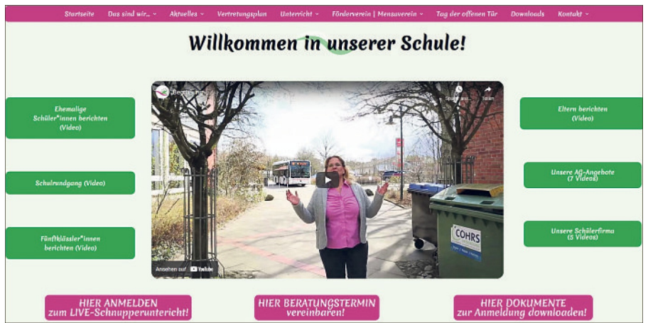
Die Homepage der Grund- und Oberschule Bispingen informiert über Schule, Schulltag und Angebote.

Die Grund- und Oberschule Bispingen gibt umfassende Einblicke im Netz