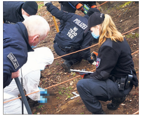
An einer Böschung nahe der A 7 fand eine technische Einheit der Polizei Hannover eine in der Erde vergrabene Waffe.