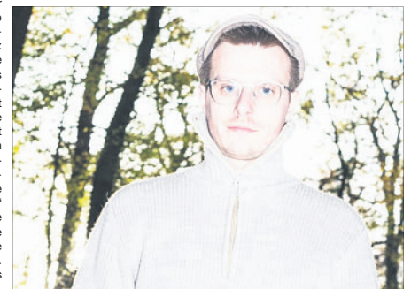
Für den 21. Mai plant der Kulturverein Schneverdingen den Auftritt von Moritz Neumeier im Biergarten am Rathaus.

Dieser Abend läuft unter den geltenden Corona-Bestimmungen: Das Hygiene-Konzept sieht eine begrenzte Anzahl an Tickets vor, es gibt ausschließlich Sitzplätze. Wichtig: Grundsätzlich gibt es Bedienung am Tisch, nicht jedoch während der Vorstellung. Besucher sollten rechtzeitig erscheinen, so dass vor dem Start der Stand-up-Comedy gegessen, getrunken und bestellt werden kann. Die Vorstellung beginnt um 19 Uhr, Einlass ist ab 17 Uhr. Es gibt wenige Restkarten im Vorverkauf online unter www.kulturverein-schneverdingen.de .