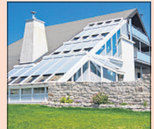
Mit der richtigen Beschattung lässt es sich im „Glaspalast“ wunderbar aushalten.

Ein Plus an Wohnfläche und Lebensqualität - die Gründe für einen Wintergarten sind vielfältig. Allerdings währt die Freude nur lange, wenn die Ausstattung stimmt.