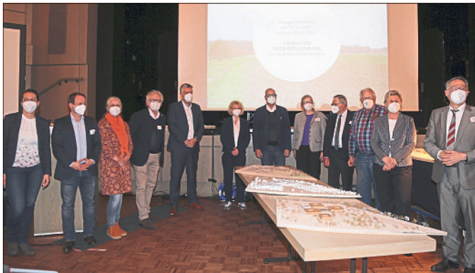
Zwei Tage wurde lebhaft diskutiert und gefachsimpelt, dann standen die drei Erstplatzierten des Architekten Wettbewerbs fest. Hier präsentieren die Beteiligten die drei Modelle.

BAD FALLINGBOSTEL (mk). Er ist beendet, der Architektenwettbewerb zum geplanten Neubau des Heidekreis-Klinikums. Zwei Tage diskutierte die aus 25 Mitgliedern bestehende Jury über die insgesamt 16 erarbeiteten Pläne und Modelle, die im Kursaal in Bad Fallingbostal präsentiert wurden. In Corona-Zeiten erfolgte der Austausch teilweise auch per Videokonferenz über das Internet. Am ersten Tag waren die am Abstimmungsverfahren Beteiligten fast zwölf Stunden auf den Beinen, am folgenden Tag stand gegen 14 Uhr das Ergebnis fest. Bemerkenswert ist, dass es ein einstimmiges Votum der 17 Preisrichter gab. Gewonnen hat der Entwurf „1122“ der Architektengruppe Schweitzer und Partner aus Braunschweig mit der „Häschler Jehle Objektplanung GmbH“ aus Berlin und der „nsp landschaftsarchitekten stadtplaner PartGmbH schonhoff schadzek depenbrock“ mit Sitz in Hannover.