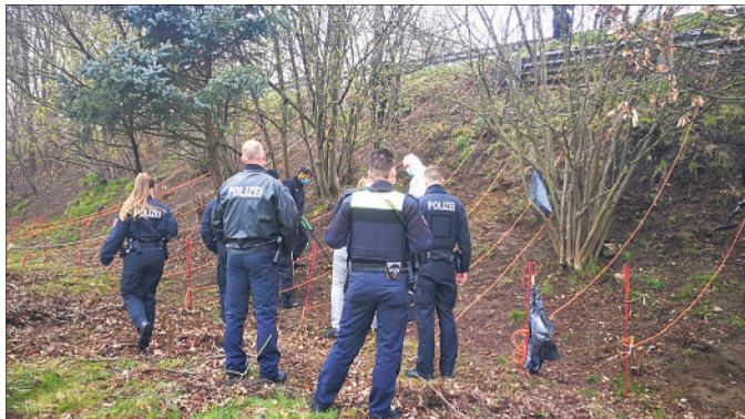
Bei der Suche nach weiteren Beweismitteln konnten die Beamten der „MoKo Motorrad“ einen ersten Erfolg verzeichnen.

Und möglicherweise haben es die Ermittler noch am gleichen Tag entdeckt: „Im Rahmen der Suchmaßnahmen nach weiteren Beweismitteln konnten die Beamten der „MoKo Motorrad“ einen ersten Erfolg verzeichnen. An einer Böschung in der Nähe des damaligen Ablageortes des Tatmotorrades fand eine technische Einheit der Polizei Hannover am Vormittag eine in der Erde vergrabene Waffe. Ob es sich dabei um die Tatwaffe des Mordes von vor über vier Jahren handelt, ist noch unklar. Das muss die nun folgende kriminaltechnische Untersuchung zeigen. Die Suchmaßnahmen am Deiler Weg dauern an“, so die Pressemitteilung, die die Polizeiinspektion Rotenburg und die Staatsanwaltschaft Verden dann am Montagnachmittag herausgaben.