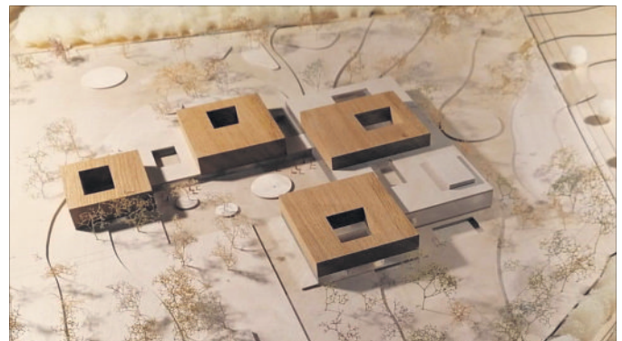
So sehen Sieger aus: Beim Blick auf das Modell des neuen Heidekreis-Klinikums fallen sofort die vier Kuben ins Auge. Laut Planern sollen sich die Gebäudeteile des Krankenhauses durch, die moderate Geschossigkeit und die Stafflung der Kubatur harmonisch und selbstverständlich in den umgebenden Landschaftsräum einfügen.

HKK-Architektenwettbewerb: Jury kürt Sieger einstimmig