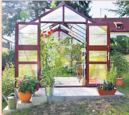
Die sturmsicheren Gewächshäuser sind hervorragend isoliert und optimal belüftet. Kopfsalat, Kohlrabi und Co fühlen sich dort wie zu Hause.

Kontakte reduzieren und zu Hause bleiben, um sich und andere nicht zu gefährden - das begleitet uns jetzt schon viele Monate. Warum nicht aus der Not eine Tugend machen und im eigenen Garten knackfrisches Obst und Gemüse anbauen? Wer zum Selbstversorger wird, muss sich im Supermarkt nicht mehr um die letzte verschrunpelte Aubergine balgen, die, in Spanien oder der Türkei angebaut, außerdem einen weiten Weg hinter sich hat und möglicherweise bedenkliche Pestizide enthält. Also her mit einem Gewächshaus und all den leckeren Vitaminbomben, die unter Glas geschützt heranreifen können, um später auf dem eigenen Teller zu landen! Doch welche Gewächshaus-Variante passt am besten zu den persönlichen Bedürfnissen?