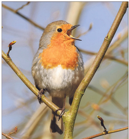
„Vogel des Jahres 2021“: Der NABU Niedersachsen gratuliert dem Rotkehlchen.

HEIDEKREIS. Zum „Vogel des Jahres“ ist 2021 das Rotkehlchen gewählt worden. „Es hatte den Schnabel vorn vor der Zweitplatzierten, der Rauchschwalbe“, so der Naturschutzbund (NABU) Niedersachsen in seiner Mitteilung. „An der Wahl, die anlässlich des 50-jährigen Bestehens der Aktion ‚Vogel des Jahres‘ stattfand, hatten sich hunderttausende Bürger und Bürgerinnen bundesweit beteiligt. Der NABU Niedersachsen gratuliert dem virtuellen Sänger zu seiner Wahl - wohl wissend, dass das Rotkehlchen eine der beliebtesten Vogelarten in Deutschland ist“, so die Mitteilung des NABU. Zugleich rufen die Naturschützer auf, Hand anzulegen und Niedersachsens Gärten „rotkehlchenfreundlich“ zu gestalten.