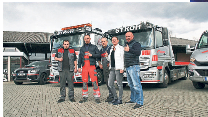
Das Team des Autohauses Stroh.