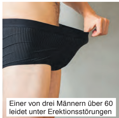
Einer von drei Männern über 60 leidet unter Erektionsstörungen

Für Ihren Apotheker: Neradin (PZN 11024357)