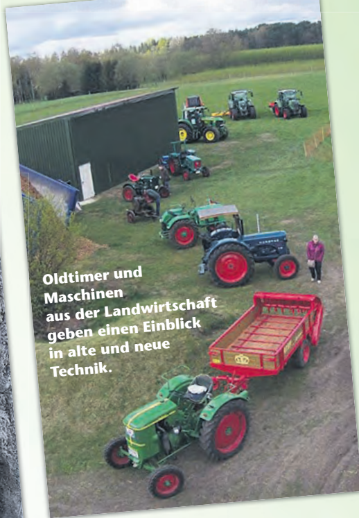
Oldtimer und Maschinen aus der Landwirtschaft geben einen Einblick in alte und neue Technik.