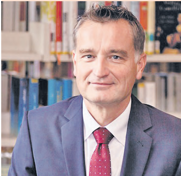
Bürgermeister Helge Röbbert.

Endlich Frühling! In diesem Jahr hat er etwas länger auf sich warten lassen, aber nun ist er mit voller Wucht da! Und das bedeutet auch: Es ist Zeit für den Soltauer Frühlingmarkt!