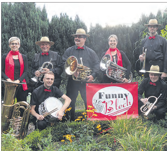
Gibt am 29. April ein Konzert in der Schneverdingener Peter-und-Paul-Kirche: die Blechbläserformation „Funny Blech“.

SCHNEVERDINGEN. „Funny Blech“ heißt die aus sieben Musikerinnen und Musikern bestehende Blechbläserformation, die am 29. April um 17 Uhr in der Peter-und-Paul-Kirche in Schneverdingen ein Konzert gibt. Gegründet wurde die Gruppe bereits vor mehr als zehn Jahren. Für die Hobbymusiker stehen jedoch nicht die Auftritte im Vordergrund, sondern der Spaß am gemeinsamen Musizieren. Deshalb sind alle Mitglieder der Gruppe auch noch in anderen Besetzungen und Ensembles aktiv. Ein- bis zweimal pro Monat kommen sie außer der Reihe zum gemeinsamen Musikmachen zusammen und haben über das Jahr verteilt gelegentlich Auftritte bei Frühlingsfesten, Grillfesten, in Seniorenheimen oder auch auf Weihnachtsmärkten. Und auch in Schne-