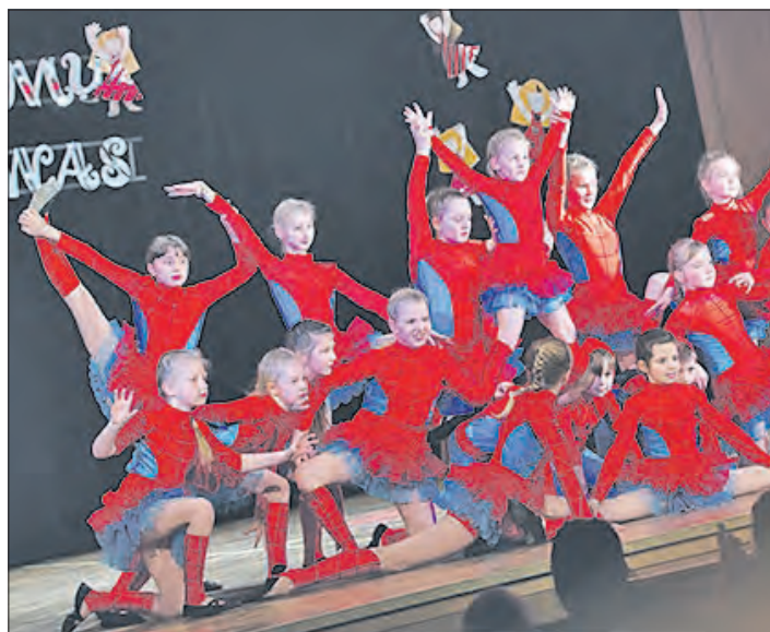
Auch Tanzgruppen aus Barlinek zeigen in der FZB ihr Können.

SCHNEVERDINGEN. Eine Tanzgala steht am 1. Mai um 17 Uhr im Bürgersaal der Schneverdinger Freizeitbegegnungsstätte (FZB) auf dem Programm. Zwei Jugendtanzgruppen werden ihr Können zeigen. Die Tanzgala bildet den Abschluß eines gemeinsamen Jugendworkshops, der unter Regie des Tanzsportclubs Schneverdingen gemeinsam mit Jugendlichen der Gruppe „Fabryka Tanca“ aus Barlinek vom 27. April bis zum 2. Mai auf dem Programm steht.