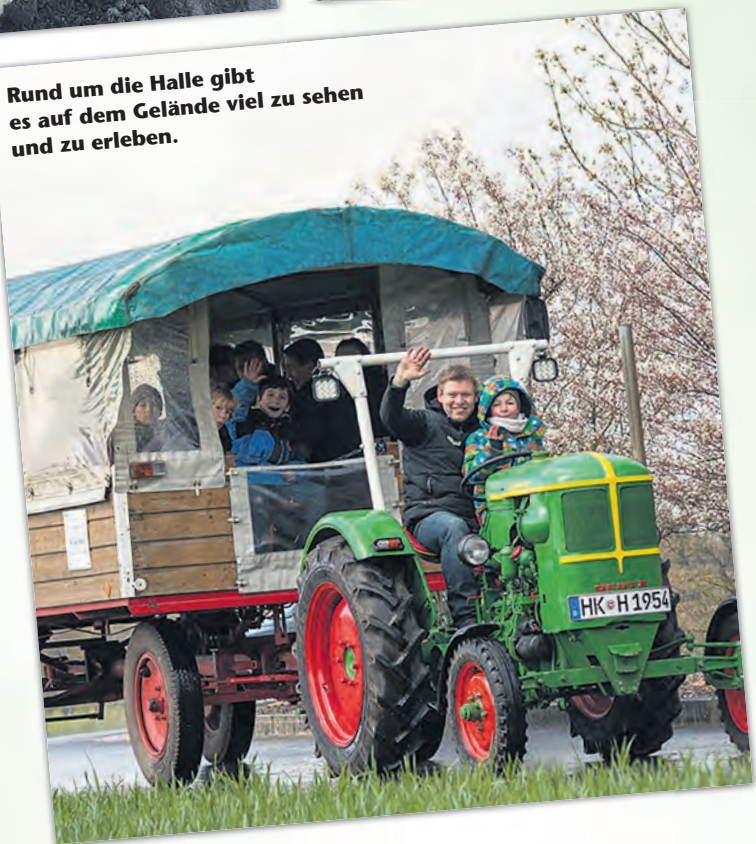
Rund um die Halle gibt es auf dem Gelände viel zu sehen und zu erleben.