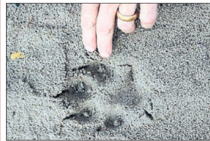
Die Spuren der Wölfe sind vielfältig.