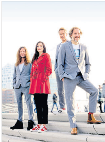
Die vier Stimmakrobaten von „LaLeLu“ präsentieren ein „Best of“ in der Freizeitbegegnungsstätte.

Sie hofft auf weitere Impulse, vor allem aber auf konkrete Daten und Fakten: „Denn was fehlt, sind verlässliche Aussagen“, bemängelt die Ratsfrau. „So werden in der Diskussion rund eine mögliche Sanierung des Heidjerhauses einfach Summen „rausgehauen“, deren Berechnungen sich nicht detailliert nachvollziehen lassen.“ Baden wünscht sich einfach eine wohlüberlegte Herangehensweise und saubere Planung. „Und sollte sich an deren Ende tatsächlich herausstellen, dass die beste Lösung ein Abriss ist, dann ist das eben so.“