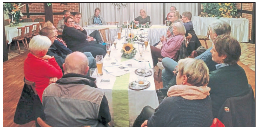
„Erhalt des Heidjerhauses“ - das ist das Ziel einer Initiative, die sich jetzt in Bispingen formiert hat. In der vergangenen Woche kam die Gruppe zu einem ersten Treffen zusammen (Foto), der nächste Termin ist für den kommenden Dienstag, 26. Oktober, geplant.

Initiative kämpft für Bispinger Gebäude: Heidjerhaus soll erhalten bleiben