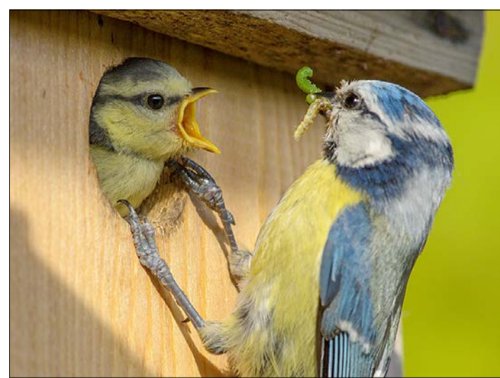
Im Mittelpunkt des Interesses der diesjährigen Zählung stand die Blaumeise, deren Bestand deutlich verringert ist.

Im Durchschnitt wurden in Niedersachsen in diesem Jahr innerhalb