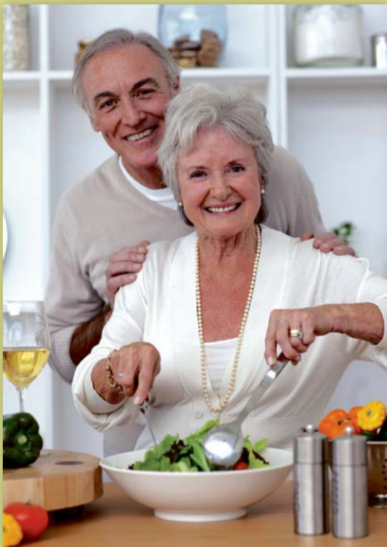
Wer bis ins hohe Alter fit bleiben möchte, sollte auf seine Ernährung achten.