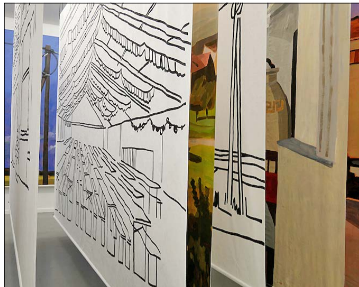
Bühnenbilder, Szenen und Requisiten der Revue hat Schiffers unter anderem durch Fotos, Wandgemälde und einen Kulissenfundus ergänzt.

setzt. Im „International Village Shop“ finden Besucher Dinge, die die Gruppe Myvillages (Schiffers, Feenstra, Böhm) gemeinsam mit Dorfbewohnern in aller Welt erfunden und hergestellt haben. Das Sortiment ist ein Schatz an Ideen und Wissen, das von lokalen Ressourcen, internationalem Austausch, regionaler Zusammenarbeit und verblüffenden Selbstdarstellungen besteht. Bühnenbilder, Szenen und Requisiten der Revue hat Schiffers durch Fotos, Wandgemälde, Shakespearezitate, Autogrammkarten und