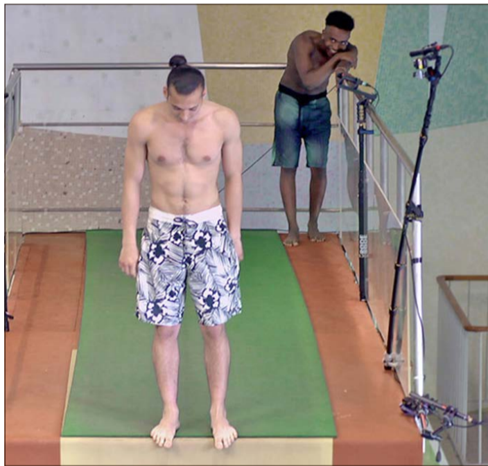
„Ten Meter Tower“ ist einer der Filme, die derzeit auf der „Online-Leinwand“ des Kinos „LichtSpiel“ gezeigt werden.

SCHNEVERDINGEN. Das Schneverdingener Kino „LichtSpiel“ bleibt wegen der Coronavirus-Pandemie weiterhin geschlossen. Seit Ostern bietet das ehrenamtlich tätige Kinteam seinem Publikum eine „Online-Leinwand“ im Internet, auf der wöchentlich wechselnde „Kurzfilme der Woche“ präsentiert werden: kostenlos zu sehen auf der Homepage www.lichtspiel-schneverdingen.de.