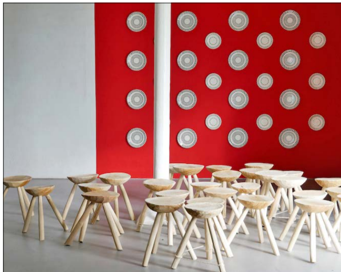
„Buchen und Eichen treten auf“ - so heißt die Ausstellung im Kunstverein Springhornhof in Neuenkirchen.

Antje Schiffers im Springhornhof: „Buchen und Eichen treten auf“