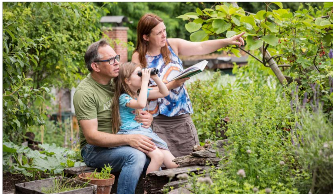
So viele Interessierte wie nie zuvor haben sich an der „Stunde der Gartenvögel“ beteiligt.

Beobachtungen können nach bis zum 18. Mai am besten online unter www.stundedergartenvoegel.de gemeldet werden. Das funktioniert auch mit der kostenlosen NABU-App Vogelwelt, erhältlich unter www.NABU.de/vogelwelt . Aktuelle Zwischenstände und Ergebnisse sind auf www.stundedergartenvoegel.de abrufbar und können mit vergangenen Jahren verglichen werden. Wer Lust bekommen hat, weiter zu zählen, kann sich schon einmal den 29. Mai merken. Dann startet die nächste Citizen-Science-Aktion des NABU, der Insektensummer.