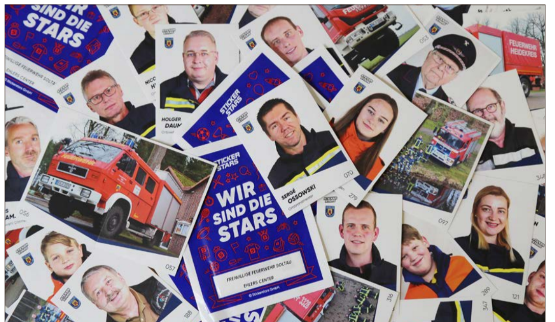
Sie sind die Stars - und zwar die „Stickerstars“ im Sammelalbum der Freiwilligen Feuerwehr Soltau.

Anders als in den USA sind in Deutschland nicht die Sammelbilder von Baseballspielern gefragt, sondern vor allem die der Fußballstars. Doch egal, welche jener Heroen die Seiten der Panini-Alben füllen - wahre Heldentaten vollbringen die Helden des Sports eher selten. Das tun