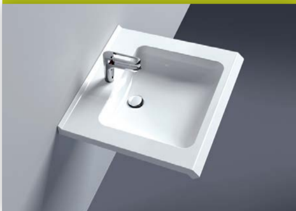
Waschtisch mit verdeckter Griffkante.

Waschtisch mit umlaufender, verdeckter Griffkante mehr Optionen: Die verdeckte Griffkante im Frontbereich sowie an den Seiten erlaubt beispielsweise Rollstuhlfahrer sich selbstständig an den Waschtisch heranzuziehen. Allen anderen Nutzern gibt die untergreifbare Griffkante sicheren Halt und dient bei Bedarf als Halte-, Setz- oder Aufsteh-Hilfe. Die breiten Auflageflächen bieten großflächige Ablagemöglichkeiten für die Bad-Utensilien in greifbarer Nähe. Das neue Waschtischmodell aus Mineralguss ist durch seine hochglänzende, porenfreie Oberfläche einfach zu reinigen und daher besonders pflegeleicht und hygienisch.