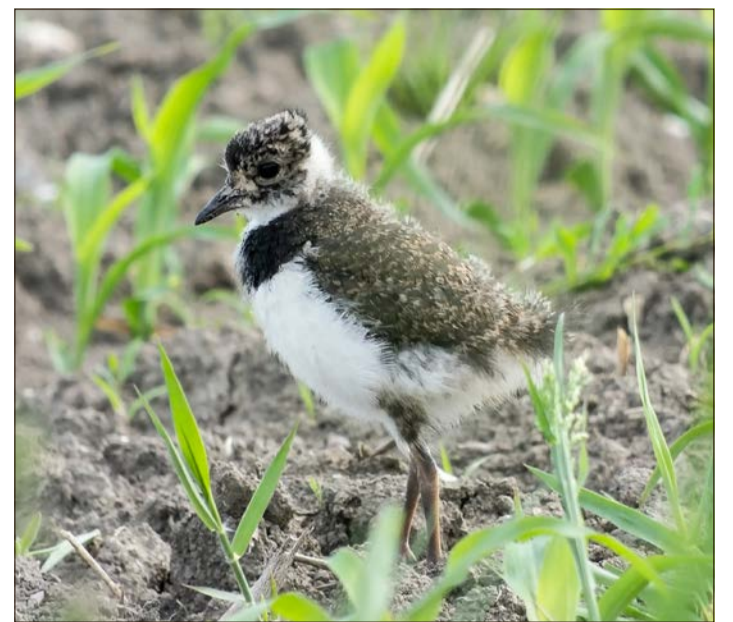
Der Kiebitz - hier ein Jungvogel - ist auch im Heidekreis selten geworden.

HEIDEKREIS. Unter dem Titel „Praktischer Wiesenvogelschutz im Heidekreis - Cash for Kiebitz“ bietet ein Projekt der Fachgruppe Natur- und Landschaftsschutz des Heidekreises interessierten Flächenbewirtschaftenden und -bewirtschaftern im Landkreis die Möglichkeit, sich im Feld- und Wiesenvogelschutz zu engagieren. Für die freiwillige Teilnahme am Projekt können Landwirtinnen und Landwirte Ausgleichsprämien erhalten.