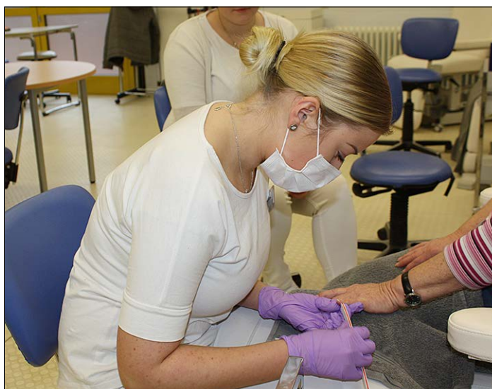
Maniküre (Foto) und Pediküre lagen ganz in der Hand der Unterstufenschülerinnen.