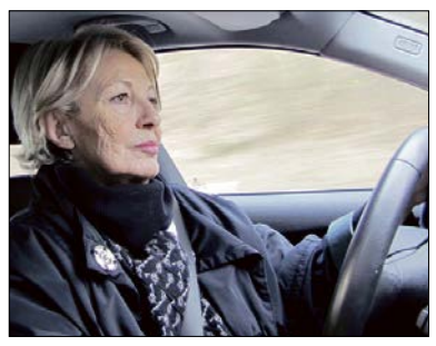
Die Sicherheit sollte immer Priorität haben.

Um einschätzen zu können, wie es um die eigene Konstitution bestellt ist, rät der Automobilclub Kraftfahrer-Schutz (KS) daher zu regelmäßigen Check-ups beim Hausarzt. Zugleich sei ein gesundes Augenmaß bei der Selbsteinschätzung gefragt.