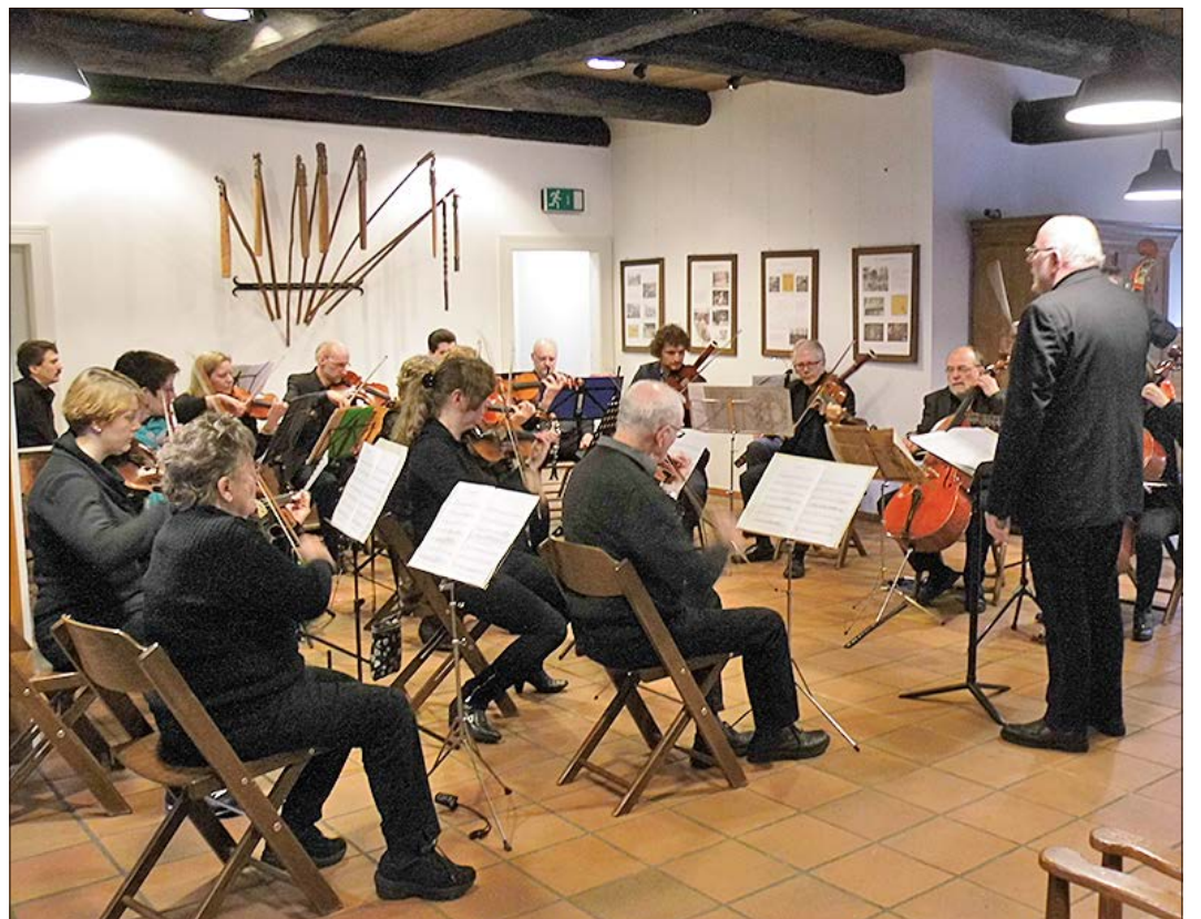
Das „Sinfonische Orchester“ der Heidekreis-Musikschule gibt am 3. März ein Konzert im Forum der Kooperativen Gesamtschule in Schneverdingen.

„Sinfonisches Orchester“ der Heidekreis-Musikschule