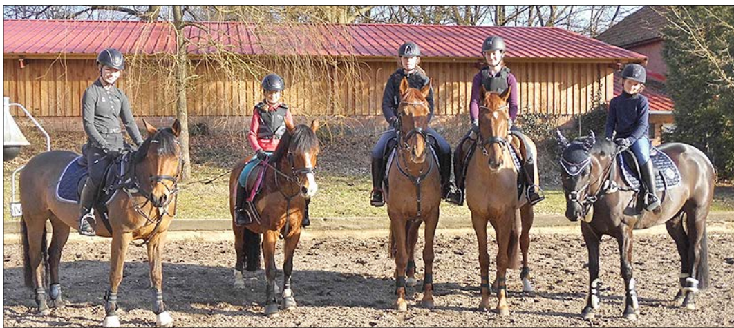
„Frühe Chancen“: Fünf der sieben Lehrgangsteilnehmer auf dem Außenreitplatz des Hofes Wichern.

Reiterverein Alvern: Wertvolle Tipps für junge Amazonen