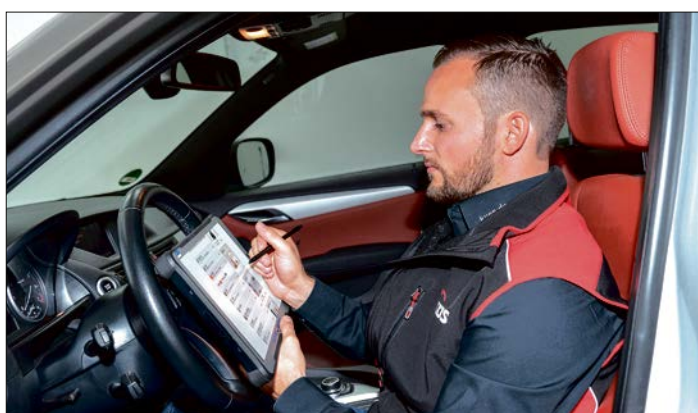
Das Internet wird immer wichtiger. Laut KÜS empfiehlt sich für Kfz-Werkstätten, auch online präsent zu sein.

Bei der Buchung von Werkstattleistungen sind die Autofahrer eher zurückhaltend. Zwölf Prozent haben bereits so etwas gebucht, 44 Prozent können es sich in Zukunft vorstellen.