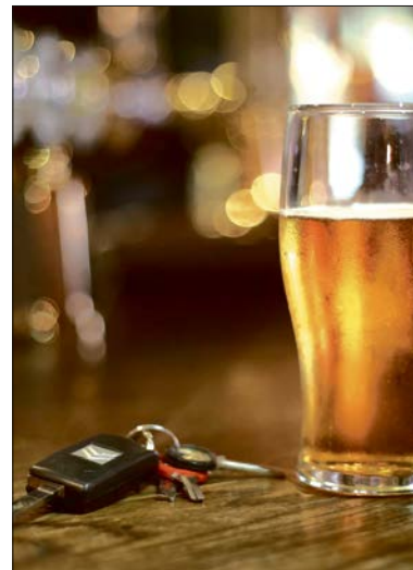
Alkohol am Steuer ist weiterhin die Hauptursache für die Anordnung einer medizinisch-psychologischen Untersuchung.

Das bedeutet einen Anstieg um 5,4 Prozent im Vergleich zum Vorjahr, während Alkohol bei den Begutachtungsursachen um 8,2 Prozent zurückging.