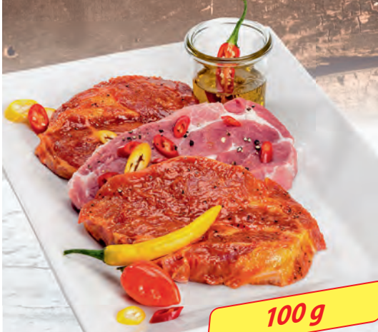
Hot Chili Grillnackensteak für alle die es schärfer lieben