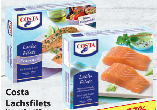
Costa Lachsfilets Natur 2 x 125 g, Provence oder Dill-Zitrone 225 g gefroren, Packung je (100 g = 2.40/2.66 €)