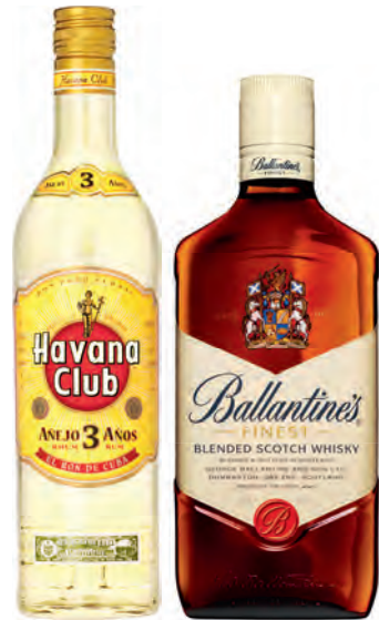
Ballantine's Scotch Whisky oder Havana Club 3 years 40% vol. 0,7-Liter-Flasche je (1 Liter = 14.27 €)