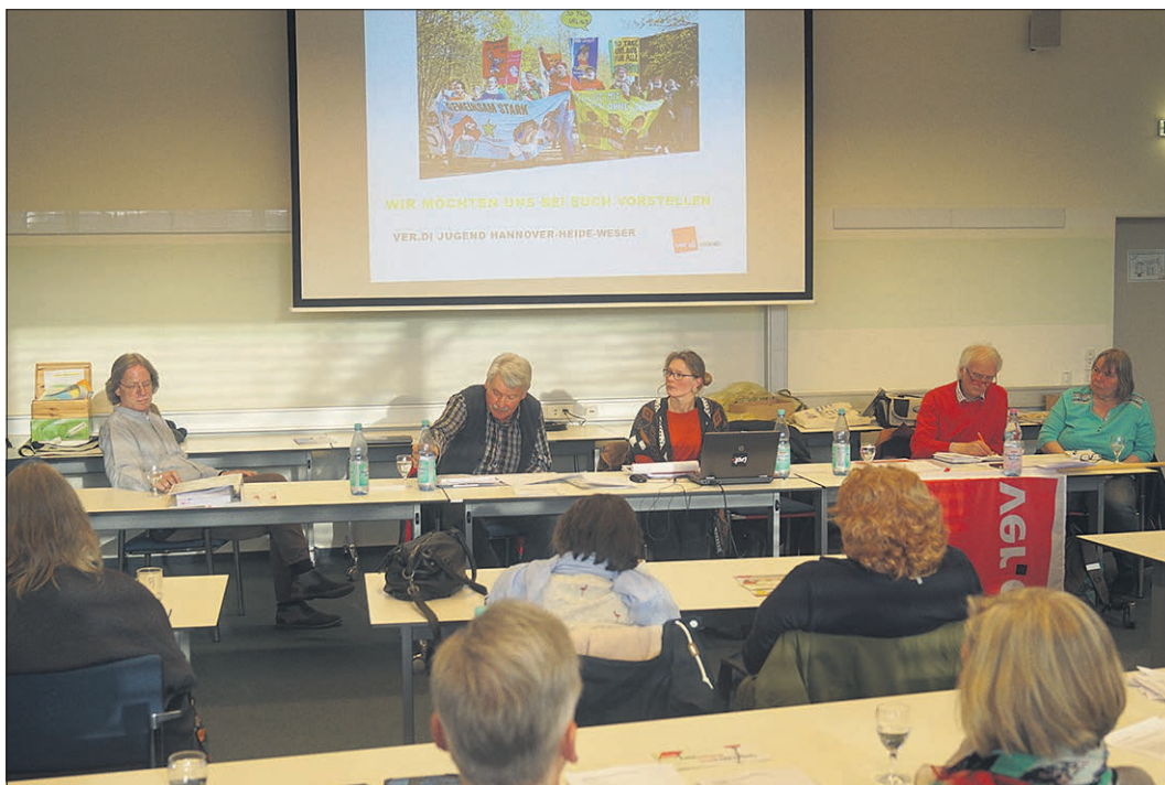
Bei der Verdi-Mitgliederversammlung wurde unter anderem ein neuer Heidekreis-Vorstand gewählt sowie der künftige Kurs bestimmt.