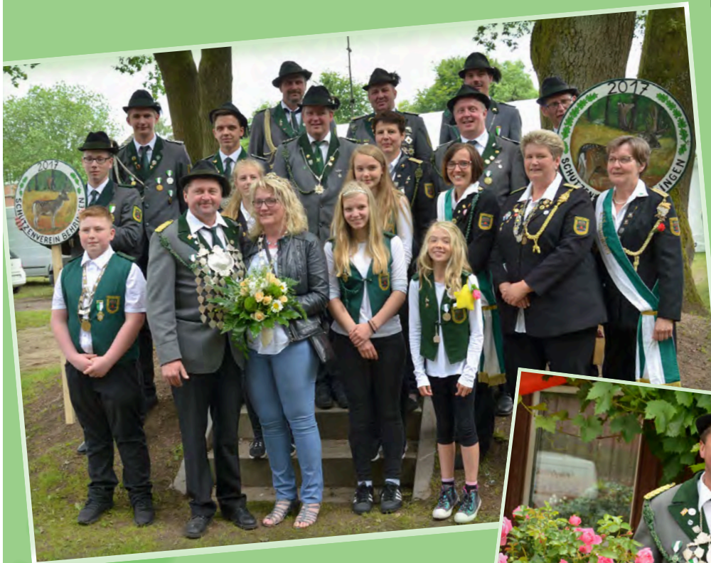
Für das erste Wochenende nach Pfingsten laden die noch amtierenden Majestäten des Schützenvereins Behringen zum Schützenfest ein.