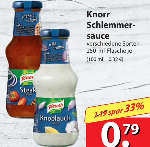
Knorr Schlemmersauce verschiedene Sorten 250-ml-Flasche je (100 ml = 0.32 €)