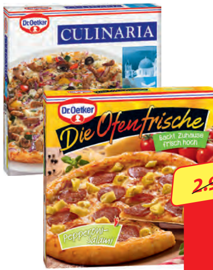
Dr. Oetker Pizza Die Ofenfrische oder Culinaria verschiedene Sorten gefroren, 355-435 g Packung je (1 kg = 5.26-6.45 €)