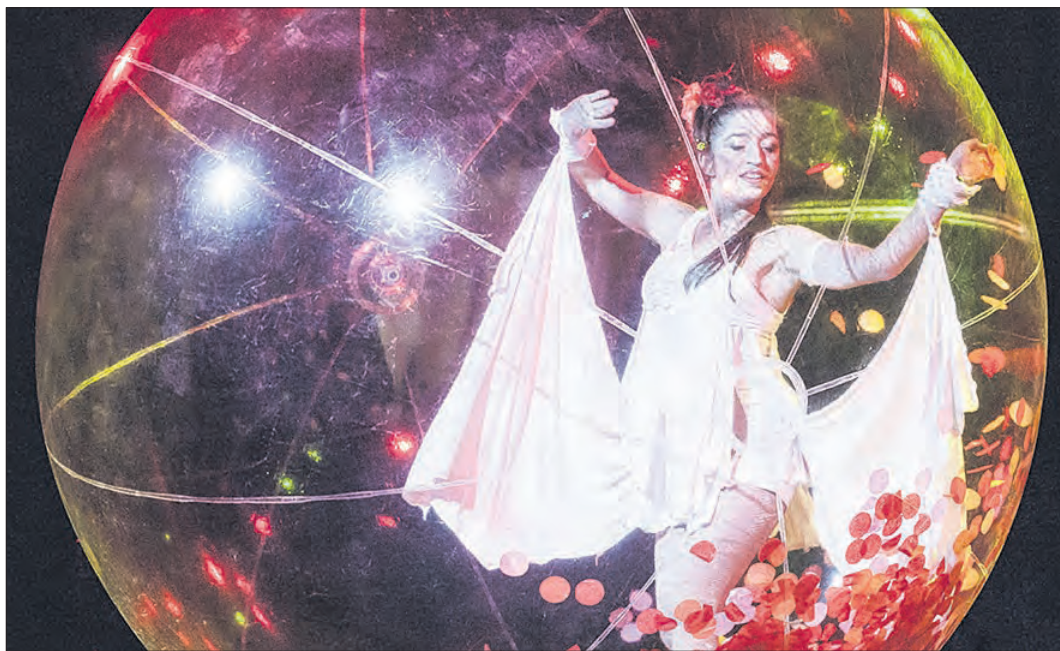
Ebenfalls mit von der Partie: „Spheric Emotion“.

Die Ausrichtung einer solchen Mammutveranstaltung, laut Bargmann „ein Leuchtturmprojekt für die Region“, ist eine besondere Herausforderung für den Schneverdingener Verein, sind doch für die 20 Spielorte im Park Bühnen zu organisieren sowie auf- und abzubauen, unzählige Meter Kabel zu verlegen, Künstler zu buchen und während der Veranstaltung zu betreuen, professionelle Licht- und Tontechnik zur Verfügung zu stellen, Eintrittsbuttons und Getränke zu verkaufen. All dies sei nur möglich, weil sich mehr als 200 freiwillige Helferinnen und Helfer engagierten, betonte Bargmann am vergangenen Donnerstag. Aber auch ohne finanzielle Unterstützung durch Sponsoren könnte eine solche Großveranstaltung nicht auf die Beine gestellt werden. Die Kosten deckt der Kulturverein zu einem Drittel aus Sponsorengeldern, einem Drittel aus dem Verkauf von Getränken und zu einem Drittel aus den Eintrittsgeldern. Umso mehr freut sich der Verein über eine Finanzspritze von der Kreissparkasse (KSK) Soltau, die die Veranstaltung mit 2.400 Euro unterstützt. „Der Kulturverein Schneverdingen mit seinem rund 1.000 Mitgliedern ist ein Verein mit einem hohen ehrenamtlichen Engagement - und das ist für uns ausschlaggebend“, unterstrich Timo Balke, Geschäftsstellenleiter der Schneverdingener KSK-Filiale. Mit der Kulturnacht habe der Verein eine Veranstaltung ins Leben gerufen, die auch unter touristischen Aspekten für die Region von Bedeutung sei. „Und das, was der Kulturverein ankündigt, setzt er