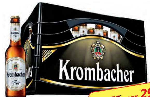
Krombacher verschiedene Sorten 24 Flaschen à 0,33 Liter 20 Flaschen à 0,5 Liter Kiste je (1 Liter = 1.32/1.05 €) zzgl. 3.42/3.10 € Pfand