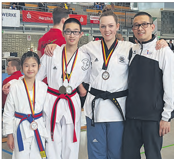
Die erfolgreichen Bispinger Taekwondosportler.