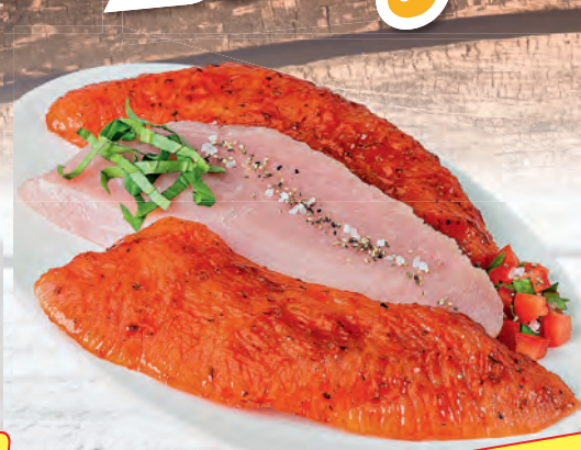
Bruschetta Putensteak eine leckere mit Tomaten und Kräutern abgestimmte Grillmarinade