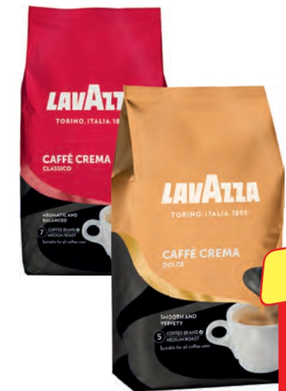
Lavazza Caffé Crema Dolce, Gustoso oder Classico 1-kg-Packung je