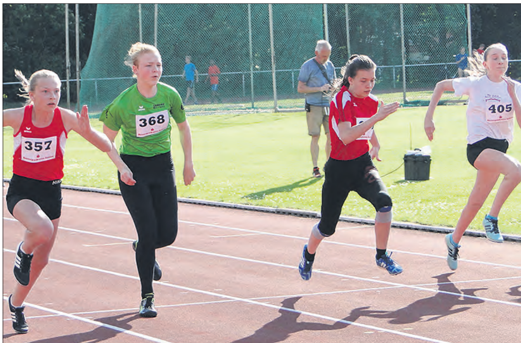
Maisportfest in Schneverdingen: Leichtathletinnen der Altersklasse W13 beim 75-Meter-Lauf.