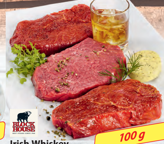
Irish Whiskey Rindersteak eine köstliche Marinade für Männer