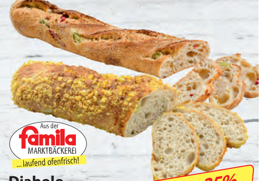
Aus der famila MARKTBÄCKEREI ...laufend ofenfrisch! Diabolo-Zwirbel 300 g oder Zeusbaguette 350 g, Stück je (1 kg = 4.97/4.26 €)