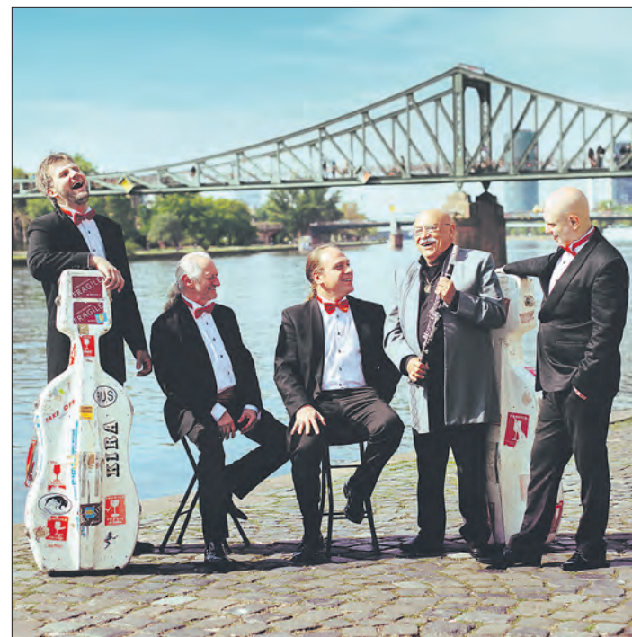
Der in aller Welt gefeierte 82-jährige Klezmer-Klarinettist Giora Feidman gibt am 3. November zusammen mit dem Rastrelli-Cello-Quartett ein Konzert in die Lutherkirche Soltau.