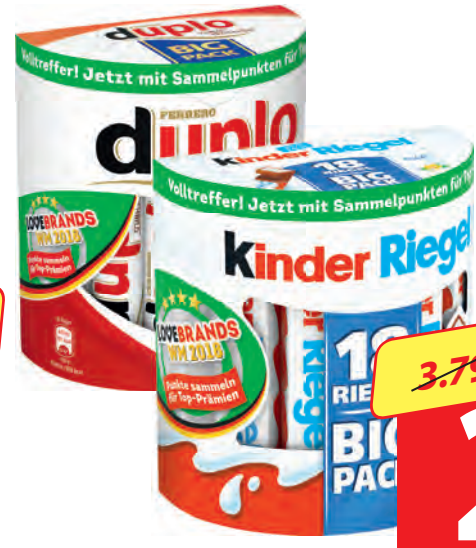
Ferrero Kinder Riegel 378 g oder duplo 327 g 18 Riegel, Big Pack je (1 kg = 7.91/9.14 €)