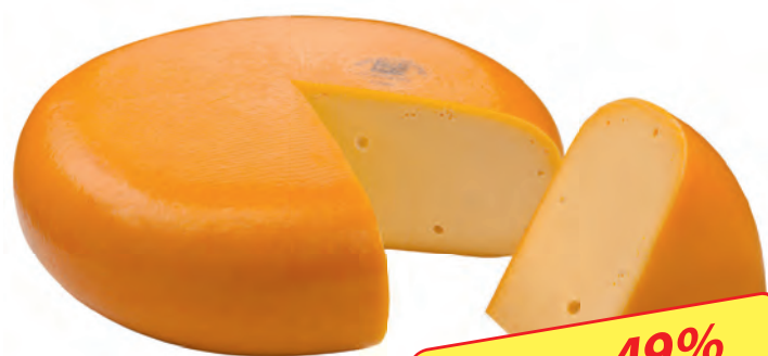
Gouda jung holländischer Schnittkäse, mindestens 48% Fett i. Tr. 1 kg im Stück