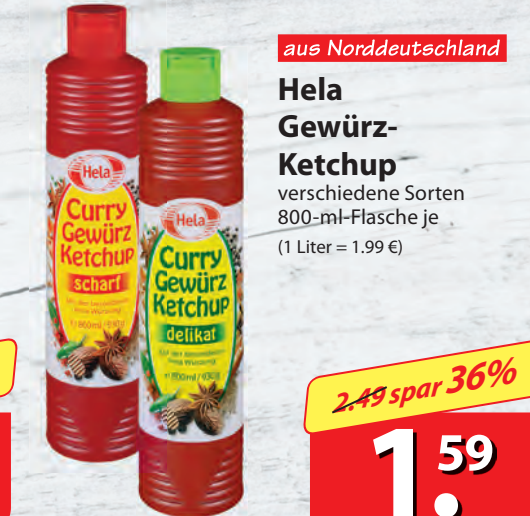
aus Norddeutschland Hela Curry Gewürz-Ketchup verschiedene Sorten 800-ml-Flasche je (1 Liter = 1.99 €)