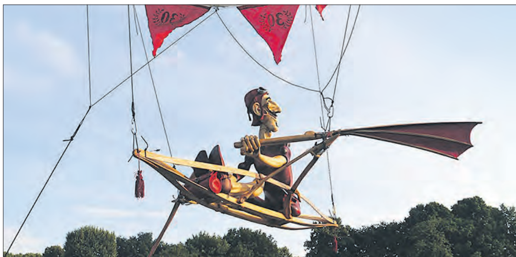
Rudert am 16. Juni durch die Schneverdingener Lüfte: „Otto von Tounix“.