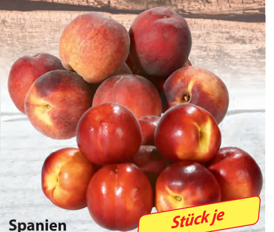
Spanien Pfirsiche oder Nektarinen gelblich, Kl. I