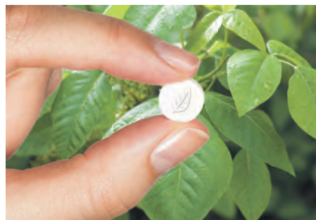
Kleine Tablette mit großem Effekt!

bereiteten den Wirkstoff in spezieller Dosierung als natürliche Schmerztablette namens Rubax Mono auf (Apotheke, rezeptfrei).