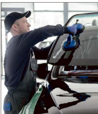
Steinschläge im Sichtbereich des Fahrers führen grundsätzlich zum Austausch der Frontscheibe.