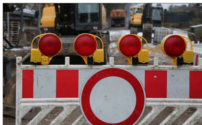
Die CDU möchte Anliegerbeiträge in Schneverdingen abschaffen.