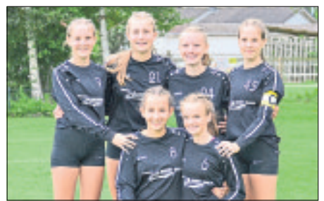
Zu viele Fehler gemacht: Die U14-Faustballerinnen vom TV Jahn Schneverdingen verpassten bei der Norddeutschen Meisterschaft in Wangersen einen Medaillenrang.