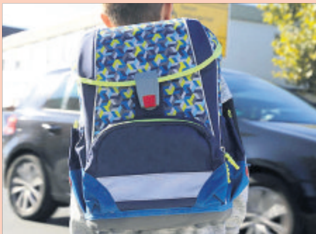
Sicherheit im Fokus: Der Schulweg sollte immer so gewählt werden, dass das Überqueren von Straßen nur in gut einsehbaren Bereichen geschieht.

Eltern sollten mit ihren Kindern den Schulweg vorher üben und Gefahren erklären