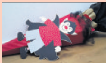
Besser für den Nachwuchs und seine Zähne: Die Schultüte sollte besser selbst befüllt werden.