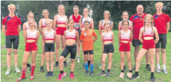
Die Schneverdinger Leichtathleten waren mit acht Siegen erfolgreich in Sarstedt. Auf dem Foto: das komplette TV Jahn Team aus der Heideblütenstadt.

TV Jahn beim Sommersportfest in Sarstedt erfolgreich