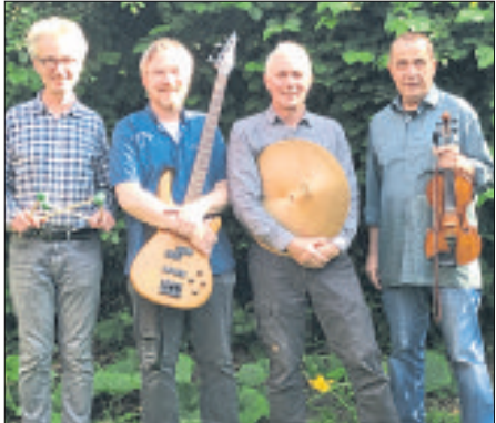
Das „Good Vibes Jazz Quartett“ gibt im Rahmen der „Sommermusik in Bispinger Kirchen“ am kommenden Freitag ein Konzert.

Nächste „Sommermusik in Bispinger Kirchen“