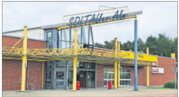
Kaufland gab seinen Standort in Soltauer Gewerbegebiet Almhöhe 2018 auf, seit drei Jahren steht die Fläche im Fachmarktzentrum leer.

Im offenen Brief formuliert die IG ihre Kritik folgendermaßen: „Die Interessengemeinschaft Almhöhe vertritt seit 1996 die Betriebe in dem Gewerbegebiet Almhöhe. Mit 50 Wirtschaftsunternehmen aus Handel, Handwerk und Gewerbe und circa 1.000 Mitarbeitern erwirtschaftet die