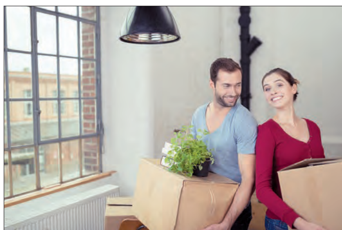
Endlich: Raus aus dem Hotel Mama und in die erste eigene Wohnung einziehen.

der richtige Zeitpunkt für einen Umzug ins eigene Reich gekommen? Gleich nach der Volljährigkeit zum Studium oder doch erst, wenn das erste selbstverdiente Geld fließt? Hier gehen die Meinungen, Wünsche und Vorstellungen auseinander. Ein gutes Drittel der Deutschen (36 Prozent) waren laut einer aktuellen und repräsentativen Umfrage 20 Jahre oder jünger, als sie die erste eigene Wohnung bezogen. Ebenfalls 35 Prozent verließen zwischen 21 bis 25 Jahre das Elternhaus und 13 Prozent hatten die 26 bereits überschritten.