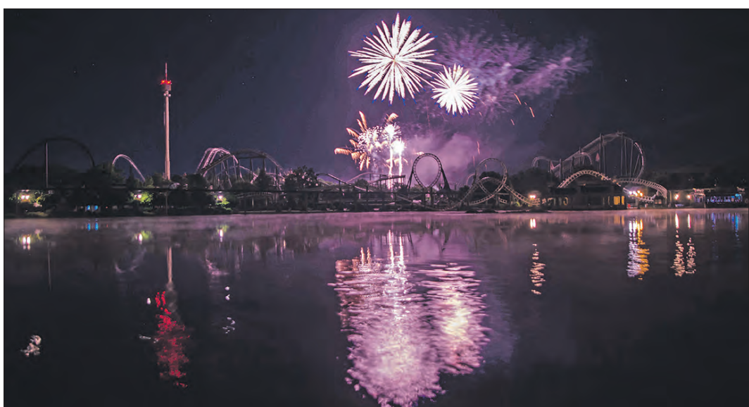
Nach zwei Aktionstagen am 4. und 11. August bilden die „Pyro-Games“ am 18. August den Abschluß der Feierlichkeiten zum 40. Heide-Park-Geburtstag.