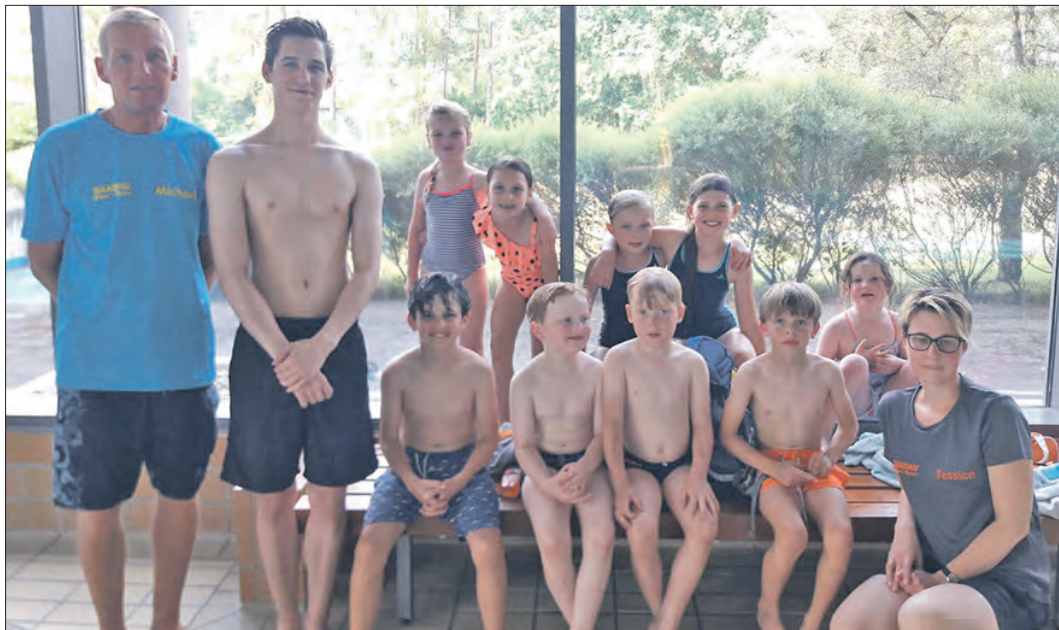
Die Schwimmgruppen vom VfB Munster gehen in die Sommerpause.

meldet, sodaß nur noch einige wenige freie Plätze zur Verfügung stehen. Das Schwimmtraining steht immer mittwochs von 16.30 Uhr bis 18.30 Uhr im Munsteraner Allwetterbad auf dem Programm. Anmeldungen nehmen Michael Zappe unter Ruf (05192) 6657 oder Jessica Schulz unter der Telefonnummer (05192) 986767 entgegen. Es wird eine Kursgebühr erhoben. Voraussetzung zur Teilnahme an diesem Angebot des VfB Munster ist mindestens das Seepferdchenabzeichen.