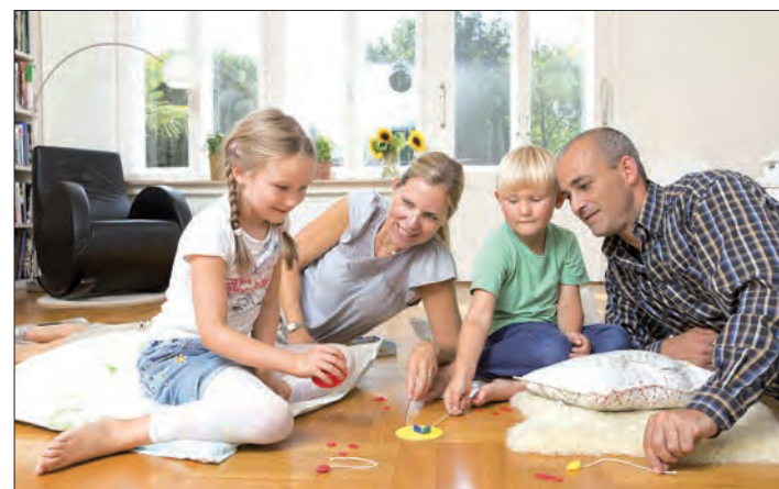
Wohneigentum ist möglich - mit einer soliden Eigenkapitalbasis und staatlicher Förderung.