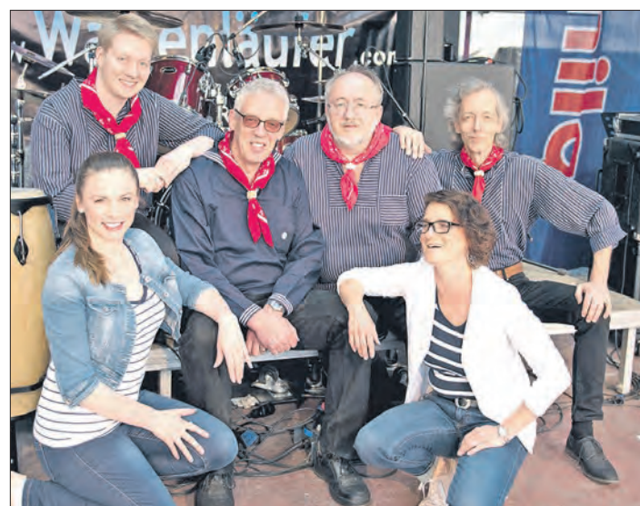
Tritt am kommenden Samstag auf dem Schröers-Hof in Neuenkirchen auf: die Band „Wattenläufer“.

NEUENKIRCHEN. Ein „Plattrockabend“ mit den Bands „Wattenläufer“ und „Brungers & Band“ steht am kommenden Samstag, dem 28. Juli, ab 18 Uhr auf dem Neuenkirchener Schröers-Hof auf dem Programm. Zunächst spielt die Nordic-Rockband „Wattenläufer“ und präsentiert Rock-Klassiker, Rock-Balladen, Pop-Folk, Reggae, Irish Folk, World Music und eigene Titel - und zwar „allns op Platt“. Mit ihrem Hit „De Stävells sünd toen wannern“ (Nancy Sinatras „these boots are made for walking“) war die Band im Jahr 2009 zweimal hintereinander die Nummer 1 der plattdeutschen Hitparade.