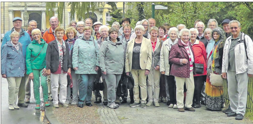
Der Kirchenchor Wietzendorf - auf dem Foto bei einem Tagesausflug, der jüngst auf dem Programm stand - macht derzeit Sommerpause. Nach den Ferien treffen sich die Sängerinnen und Sänger dann wie gewohnt wieder dienstags um 19.30 Uhr im Haus der Kirche in Wietzendorf. Weitere Mitstreiter sind dort stets willkommen.