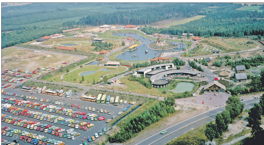
Große Achterbahnen gab es vor 40 Jahren noch nicht, wie die Luftaufnahme von 1979 zeigt. Floßfahrt, Heide-Park-Expreß, Oldtimer-Rundkurs und Panoramabahn haben hingegen die Jahrzehnte überdauert.

SOLTAU (suv). Heute prägen vor allem imposante Achterbahnen das Bild des Heide-Parks. Doch von diesen Attraktionen - ob nun aus Stahl oder Holz gebaut - ist auf einem Luftbild von 1979 noch nichts zu entdecken. Mit gerade einmal sechs Fahrgeschäften, darunter Heide-Park-Expreß, Floßfahrt, Oldtimer-Rundkurs und Hochbahn, fing alles an. Am 19. August 1978 öffneten sich die Pforten für die ersten Besucher. Heute strömen in jeder Saison mehrere hunderttausend Gäste in den Heide-Park, um hier die mehr als 50 Attraktionen sowie unterschiedliche Themenwelten und Shows zu erleben. Seinen 40. Geburtstag feiert der Soltauer Freizeitpark an drei Tagen im kommenden Monat: Am 4., 11. und 18. August wartet dabei ein buntes Programm auf die Besucher. Die erleben am letzten der drei Samstage mit den „Pyro Games“ zudem einen „explosiven Abschluß“ der Feierlichkeiten.