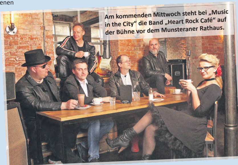
Am kommenden Mittwoch steht bei „Music in the City“ die Band „Heart Rock Café“ auf der Bühne vor dem Munsteraner Rathaus.

te hierfür wieder zahlreiche freiwillige und unbezahlte Helfer für die Veranstaltung gewinnen, die vor allem ein Ziel haben: Die Besucher von „Music in the City“ zu erfreuen und die Innenstadt zu beleben. Schon jetzt freuen sich die Organisatoren auf viele Besucher.