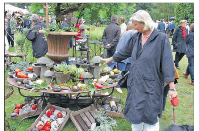
Dekoratives und Nützliches für die „heimische Grünanlage“ gibt es auf dem Gartenfestival auf dem Gut Wienhausen bei Celle.

WIENHAUSEN/CELLE. „Gourmet & Garden“ heißt das große Gartenfestival auf dem Gut Wienhausen, bei dem vom 2. bis 5. August - Donnerstag bis Samstag jeweils von 10 bis 19 Uhr und Sonntag von 11 bis 19 Uhr - mehr als 160 internationale Aussteller alles zum Thema Haus und Garten präsentieren und verschiedene Köstlichkeiten servieren. Für die Veranstaltung am Kloster Wienhausen bei Celle verlost der Heide-Kurier zehnmal zwei Freikarten.