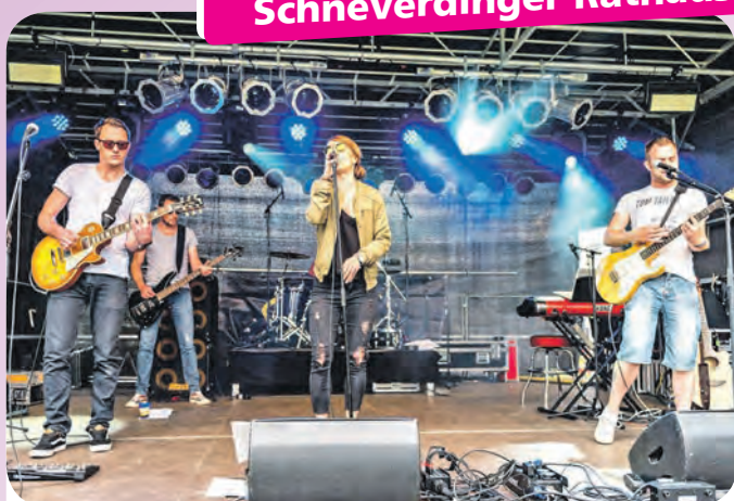
Die Band „Turbulenzen“ steht bei der nächsten „Musik am Mittwoch“ auf der Bühne hinter dem Schneverdinger Rathaus.

Mit einer bunten Rock-Cover-Mischung von Alternative und Indie bis hin zu Punkrock und Klassikrock haben sich die Musiker seit ihrer eher zufälligen Bandgründung im Jahr 2015 rasch auf eine Stilrichtung festgelegt. Zum Repertoire gehören Coverversionen von „The Killers“, „Florence & the Machine“, „Kings of Leon“, „Oasis“, „Elle King“, „Mando Diao“, „Blink 182“, „Green Day“, „Jennifer Rostock“, „Kraftklub“, „Foo Fighters“ und vielen anderen. Alle Bandmitglieder hatten bereits vor „Turbulenzen“ langjährige Musikererfahrungen und nach einem ersten