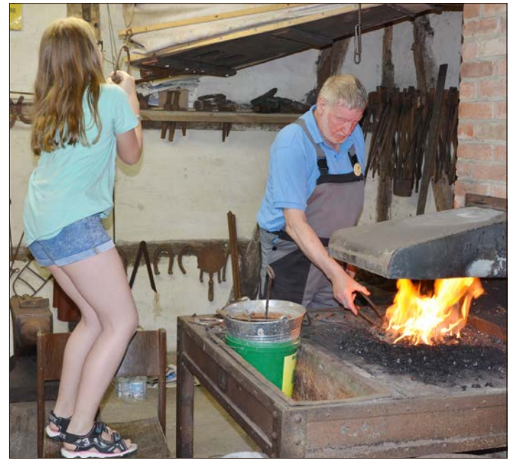
Beim Bauern- und Handwerkermarkt auf dem Schneverdinger Theeshof wird auch die Arbeit in der Schmiede vorgeführt.

Für die musikalische Unterhaltung sorgen die „Mollenhauer“ aus Schwalingen. Kulinarische Genüsse