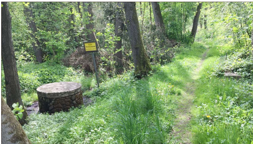
Der Pfad, der am Gesundbrunnen vorbeiführt, droht bereits, zuzuwachsen.