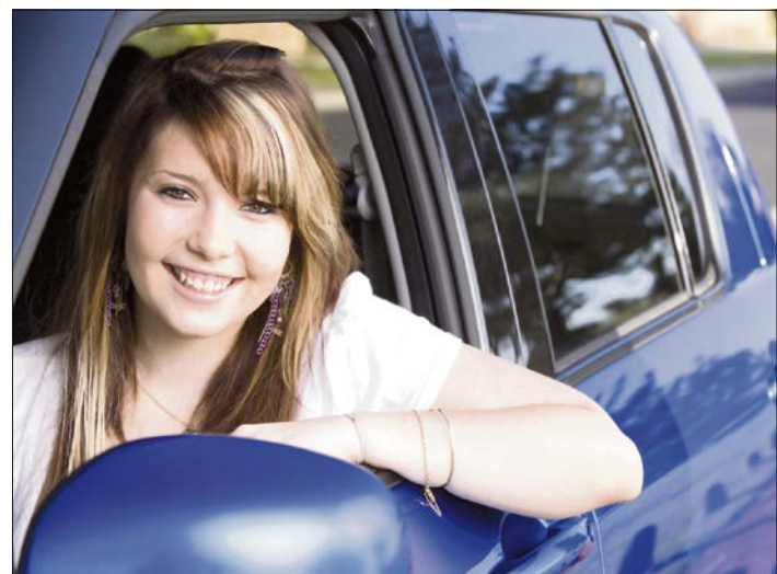
Endlich 18, endlich Autofahren? Für viele Volljährige offenbar ein Problem. Immer mehr Fahrschüler rasseln zunächst durch die Prüfung.

Immer mehr Fahrschüler rasseln durch die Führerscheinprüfung. Nach aktuellen Angaben des Kraftfahrt-Bundesamtes (KBA) erwischt sich 2017 die theoretische Prüfung für knapp 37 Prozent der Fahranfänger als unüberwindliche Hürde. Die praktischen Prüfungen bestanden demnach 28 Prozent der Bewerber nicht.