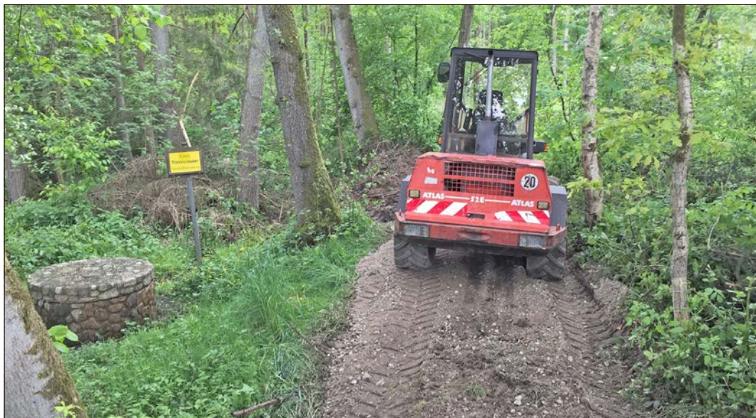
Die stadteigene AWS hat schnell gehandelt: Schon am 17. Mai haben Mitarbeiter begonnen, den Waldweg wieder herzurichten.