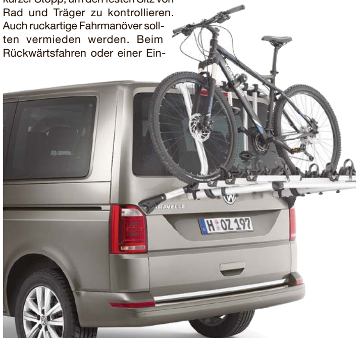
Ausflüge mit dem Fahrrad: In vielen Fällen steht ein Transport auf dem Autodach oder am Heck an.

Für den Transport mit einem Dachgepäckträger ist eine Reling oder ein vom Autohersteller empfohlenes Trägersystem nötig. Rad und Träger dürfen dabei die zulässige Dachlast nicht überschreiten. Tipp: Eine Decke schützt das Fahrzeugdach während der Montage vor Kratzern. Beim Anbringen des Gepäckträgers sollte die Montageanleitung sorgfältig beachtet werden.