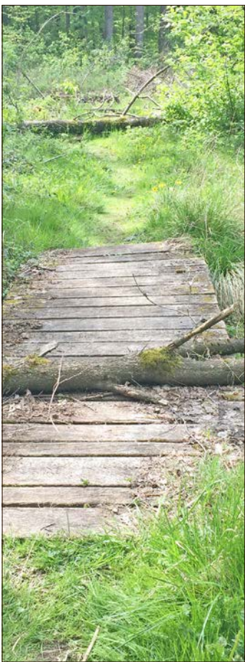
Bäume versperrten den Weg und machen ihn für Spaziergänger unbehagbar.

Wer dem Wiedinger Weg aus der Böhmestadt heraus folgt und den Wald erreicht, sieht nach kurzer Strecke am linken Wegesrand ein altes geschnitztes Hinweisschild, das auf den Gesundbrunnen nur ein Stückchen neben dem Hauptweg zeigt. Doch wer diesen Pfad, der eigentlich in einen weiteren Weg mündet, einschlägt und nicht besonders gut zu Fuß ist, kommt nicht sehr weit, denn schon bald liegen Bäume quer. Da der Weg dadurch nicht mehr wirklich genutzt werden kann, droht er, in einen Dornröschenschlaf zu fallen. Zwar wuchert dort keine Dornenhecke wie im Märchen, wohl aber Gras und Gesträuch, die den Weg überwachsen und eine Bank schon halb haben verschwinden lassen.