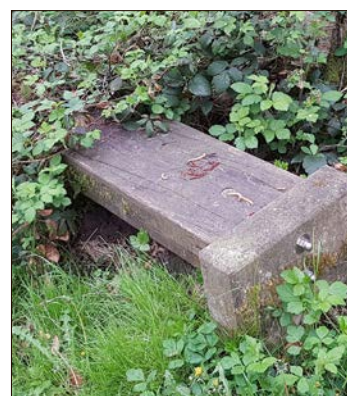
Die Bank sackt ab und ist schon halb überwuchert.

und werden uns demnächst um dieses Thema kümmern.“ Was von Rosenzweig da angekündigt hat, war alles andere als eine Vertröstung - die AWS hat schnell gehandelt, denn „demnächst“ war schon am übernächsten Tag: Bereits am Freitag, dem 17. Mai, rückten Mitarbeiter unter anderem mit einem Radlader an, um den Weg am Gesundbrunnen wieder auf Vordermann zu bringen und für Spaziergänger nutzbar zu machen. Letztere können also zuverlässig sein, diesen Weg in naher Zukunft wieder begehen zu können, was auch Helmut Matthies freuen dürfte.