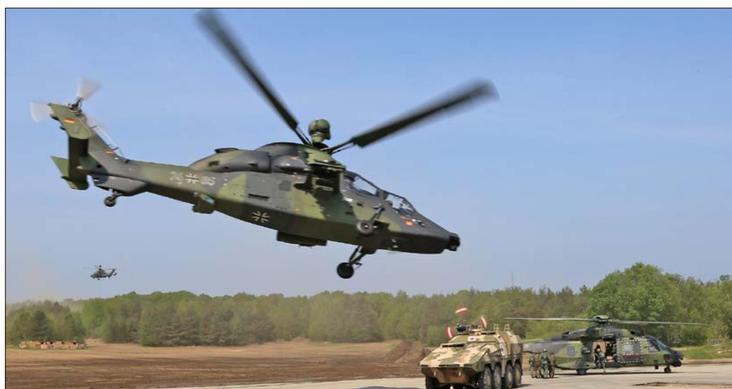
Zwei Kampfhubschrauber Tiger sichern einen gelandeten Hubschrauber NH-90 und einen Radpanzer „Boxer“ der Sanitäter.

Der Eintritt ist frei - Spenden sind erwünscht.