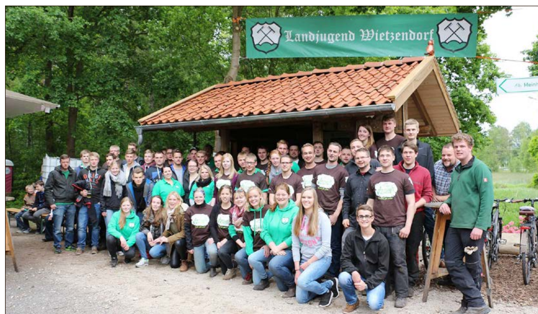
Die Landjugend Wietzendorf nach Ende der 72-Stunden-Aktion 2015 vor der fertigen Wetterschutzhütte.

Welche gemeinnützigen Aufgaben die drei Ortsgruppen im Heidekreis am Aktionswochenende in 72 Stunden zu erledigen haben, ist bis jetzt noch nicht einmal den Gruppen bekannt. Geheime Agenten haben die Aufgaben ausgewählt und werden sie am Donnerstag, dem 23. Mai, um 18 Uhr verkünden. Ein guter Rückhalt im Dorf ist dabei grundlegend für den Erfolg der Ortsgruppen. Die gesamte Dorfgemeinschaft soll in das Geschehen einbezogen werden. Den Mitgliedern der NLJ bietet die 72-Stunden-Aktion viele Möglichkeiten. Sie selber ausprobieren,