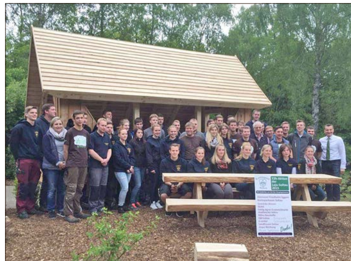
Die Schutzhütte mit Sitzgelegenheiten auf dem Grillplatz in Soltau. Errichtet von der Landjugend Soltau 2015.