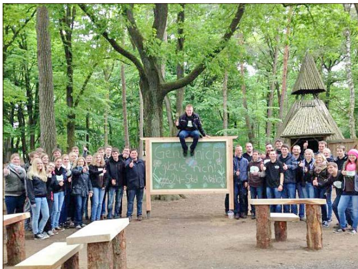
Das von der Heidjer Landjugend bei der letzten Aktion fertiggestellte Waldklassenzimmer.

Die Aufgaben werden am Donnerstag um 18 Uhr vor dem Rathaus in Soltau und Schneverdingen sowie auf dem Peethof in Wietzendorf verkündet: Interessierte sind willkommen.