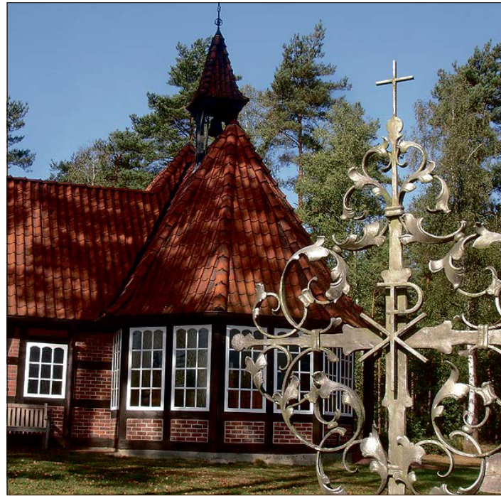
Auf dem Müdener Friedhof geht an Himmelfahrt die Auftaktveranstaltung zum Projekt „Landschaftswerte - Biodiversität auf kirchlichen Friedhöfen“ über die Bühne.

„Voraussetzung für die Teilnahme am Projekt war die Einführung des Kirchlichen Umwelt-Management-Systems ‚Grüner Hahn‘. Im Februar erfolgte die Umsetzung aller Auflagen und seitdem kann die Kirchengemeinde den Friedhof nun mit diesem Zertifikat zieren“, so Ziedorn weiter. „Das Projekt der Biodiversität ist nun langfristig angelegt und wird im Blick auf den Lebensraum für Insekten, Kleintiere und heimische Pflanzen gestaltet. In dieser Zeit wird es einige Veränderungen auf den Friedhof geben, denn neue Formen der Bestattung werden geschaffen, aber den Charakter des Friedhofes gilt es zu erhalten.“ Der Müdener Friedhof sei, so Ziedorn, „schon längere Zeit in Richtung Biodiversität unterwegs“ - unter anderem mit dem „Kerkbusch“ mit dem Meditationsweg zu Psalm 23.