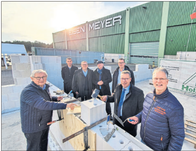
Zur Grundsteinlegung für das neue Verwaltungs- und Bürogebäude des Traditionsbetriebs Eisen-Meyer waren auch die Verantwortlichen der Unternehmensgruppe Thies+Co nach Soltau gekommen.

Eisen-Meyer baut Büros für Vertrieb und Verwaltung