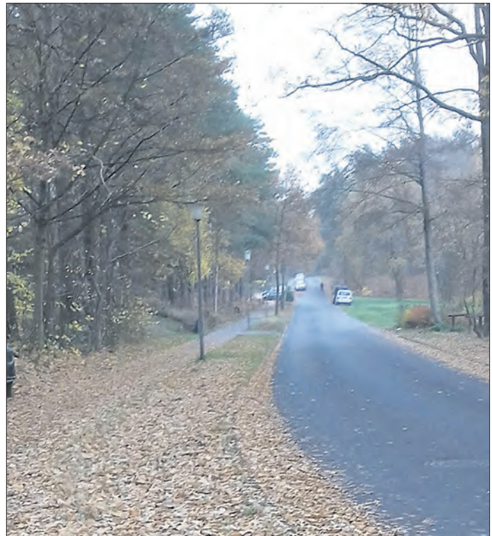
Zentimeterdick liegt das Laub in Munster auf dem Gehweg an der Straße Im Örtzetal.

„Es bilden sich zentimeterdicke Laubschichten, die besonders für Radfahrer und Fußgänger zur Gefahr werden können“, warnt der Verkehrswachtvorsitzende. Wenn in den kommenden Tagen auch noch Frost hinzukomme, „werden solche Flächen zu Rutschbahnen.“ Die Verkehrswacht Munster-Bispingen rät besonders älteren Radfahrern, an gefährlichen Stellen doch lieber vom Rad abzusteigen und zu schieben. Und: „Ein Fahrradhelm kann, wenn es doch einmal zum Sturz kommt, schlimmere Verletzungen am Kopf verhindern.“ Fußgänger sollten freigeräumte Wege bevorzugen.