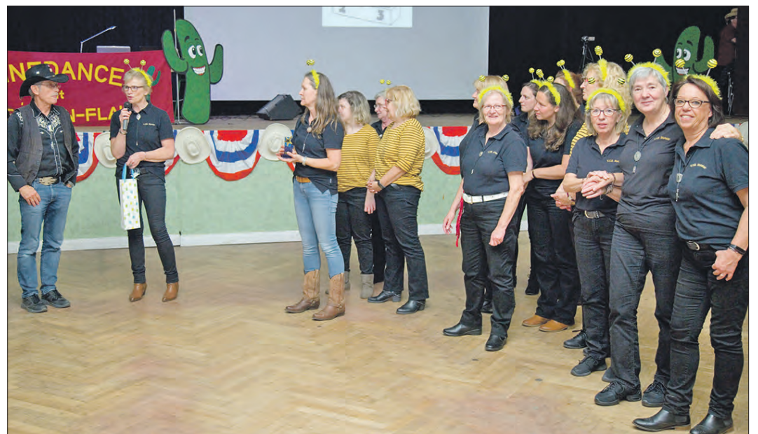
Die Gruppe „The Line-Walker“ vom VfB Munster zeigte bei der Line-Dance-Party in Winsen ihr Können.

Der Freundeskreis „Western-Flair-Linedance“ begrüßte als Veranstalter rund 250 Tänzerinnen und Tänzer zu dieser Party in der Winsener Stadthalle. Nach der offiziellen Eröffnung gab es zunächst drei Tänze zum Aufwärmen, bevor die erste Gruppe ihren Wettbewerbstanz vorführte. Fünf Tanzgruppen nahmen an diesem Wettbewerb teil, um im Laufe des Abends mit einer Vorführung ihr Können unter Beweis zu stellen. Anschließend wurden zehn Titel gespielt, wobei der Titelname und die Schrittbezeichnungen mittels eines Beamers an eine Leinwand geworfen wurden. So konnten sich die Teilnehmer kurz orientieren und in Erinnerung rufen, welche Schritte zum entsprechenden Tanz gehörten. Als dritte Gruppe gingen „The Line Walker“ vom VfB Munster auf die Tanz-