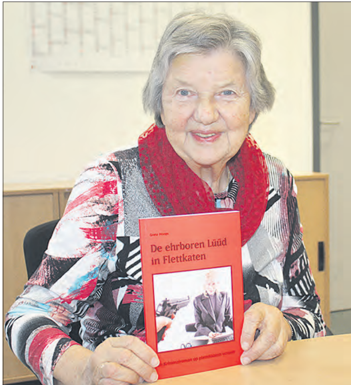
Diesmal hat Grete Hoops einen Krimi geschrieben - selbstverständlich in plattdeutscher Sprache.

Erhältlich ist der Band „De ehrboren Lüüd in Flettkatn“ - ein Kriminalroman op plattdöötsch vertelt“, erschienen im Isensee-Verlag, im Buchhandel (ISBN 978-3-7308-1487-1).