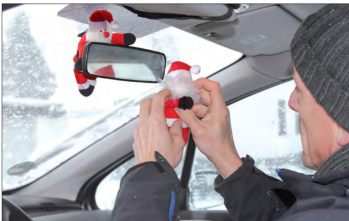
Weihnachtsschmuck ist erlaubt, solange Insassen und andere Verkehrsteilnehmer nicht gefährdet werden.

Blinkende LED-Weihnachtsbäume, Nikolaus-Anhänger oder Schneeflocken-Fensterbilder: In der Vorweihnachtszeit stapeln sich in den Geschäften die unterschiedlichsten Dekorationsartikel - auch für das Auto. Doch was ist dort als Schmuck erlaubt?