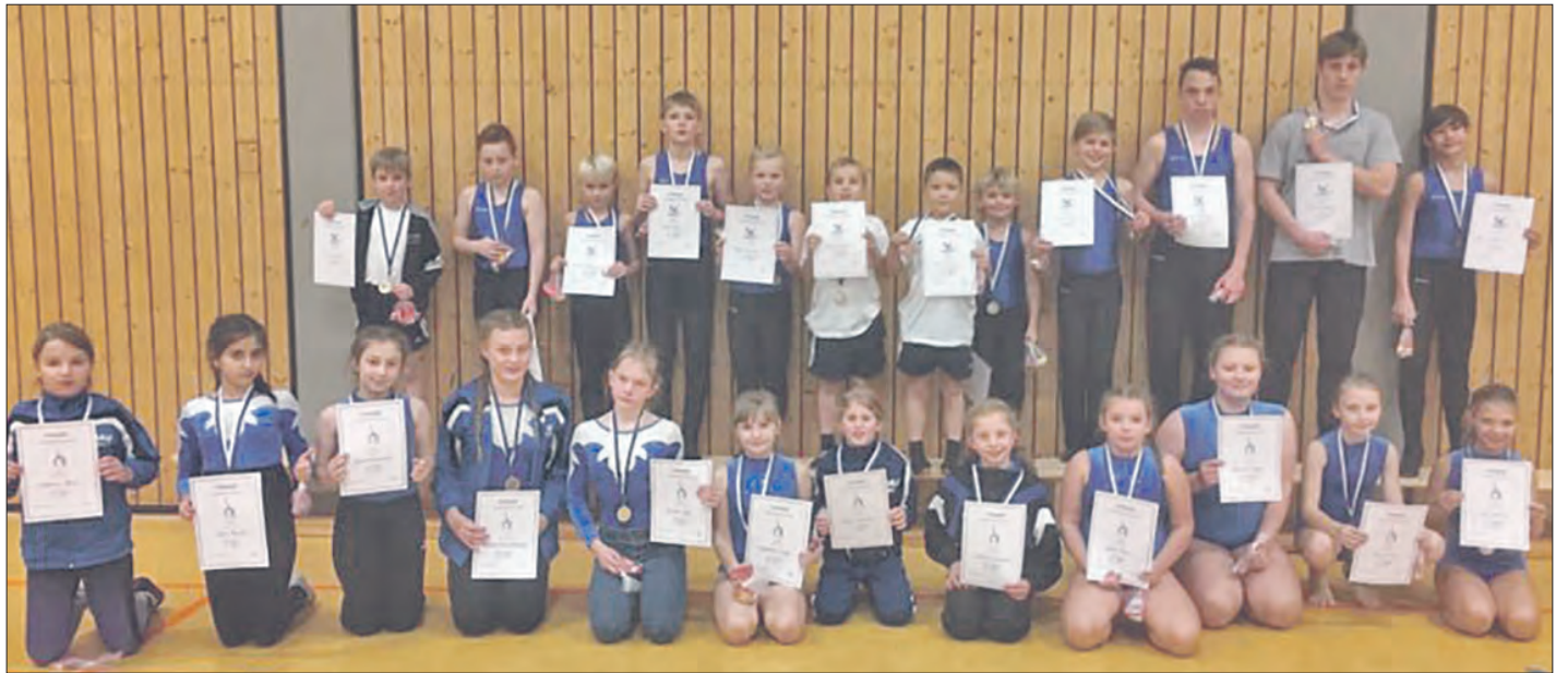
Präsentieren ihre Urkunden und Abzeichen sowie Medaillen: die Turnerinnen und Turner der Sportvereinigung Munster.

23. interner Wettkampf der Turnabteilung der Sportvereinigung Munster