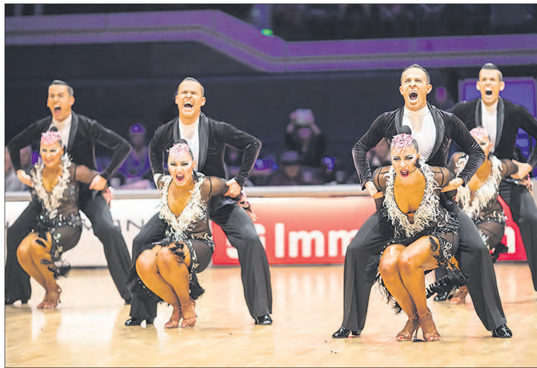
Der Tanzsportclub Schneverdingen feiert sein 40jähriges Bestehen mit einem Herbstball, bei dem zahlreiche Paare am kommenden Samstag ihr Können auf dem Parkett zeigen.