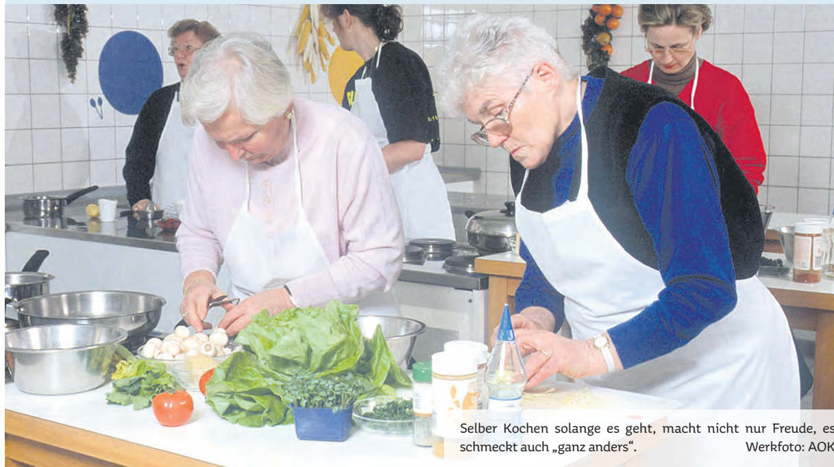
Selber kochen solange es geht, macht nicht nur Freude, es schmeckt auch „ganz anders“.