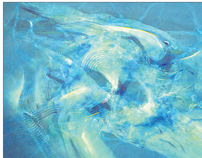
„Aquasphere“ heißt die Ausstellung, zu deren Eröffnung in Schneverdingen ein besonderer Abend geplant ist.

Ausstellungseröffnung als besonderer Abend