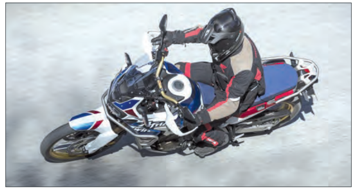
Vorsicht bei Ausfahrten im „Goldenen Herbst“: Das schöne Wetter kann sich trügerisch auf das Fahrverhalten auswirken.

Der Fahrzeugexperte mahnt zu mehr gegenseitiger Rücksichtnahme. „Gerade an den Wochenenden sind vermehrt Motorradfahrer unter-