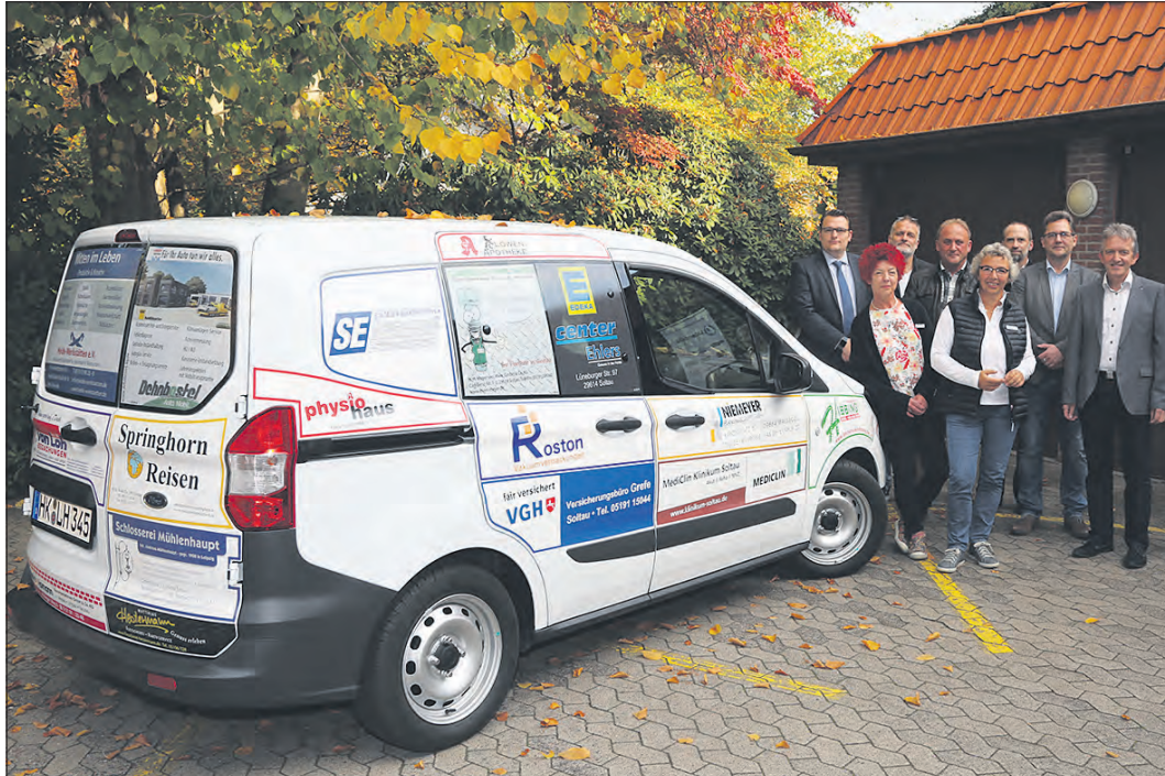
Feierliche Übergabe des neuen Fahrzeugs für die Lebenshilfe Soltau. Zahlreiche Sponsoren hatten durch ihre Unterstützung bei der Anschaffung des neuen Wagens geholfen.

Neues Auto für Einrichtung dank Firmenunterstützung