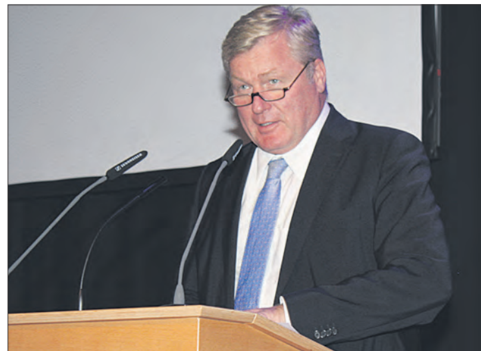
Wirtschaftsminister Dr. Bernd Althusmann.

Auch Althusmann wählte den Begriff „Erfolgsstory“, um die Arbeit der LHG zu charakterisieren. Der Tourismus mit seinen rund 293.000 Mitar-