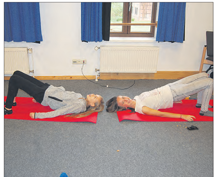
Sport und Ernährung stehen im Mittelpunkt eines Seminars auf dem Jugendhof Idingen.

IDINGEN. Das gemeinsame Kochen und Sport stehen im Mittelpunkt des Wochenendseminars vom 9. bis 11. November auf dem Jugendhof Idingen. Dabei geht es um Fragen wie: Was braucht der Körper, um fit für den Alltag zu sein? Was braucht mein Körper, um sich optimale Nährstoffe zu holen? Wie bringe ich meinem Kopf und Körper bei, in strengen Situationen trotzdem cool zu bleiben?