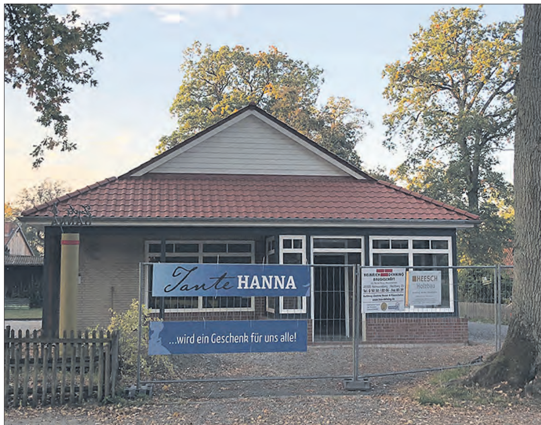
Das Projekt „Tante Hanna“ nähert sich der Vollendung, zumindest was Umbau und Sanierung des alten Gebäudes betrifft.

Hinsichtlich der Umbauarbeiten sind die Geschäftsführer und die zehn Kerngesellschafter derzeit damit beschäftigt, sich mit der Auswahl von Bodenbelägen, Wandfarben und Beleuchtungstechnik zu beschäftigen. Eine Arbeitsgruppe macht sich Gedanken zum Regalbau, denn neben den Industriebauten soll das Geschäft ja auch viele individuell gestaltete Elemente erhalten, die