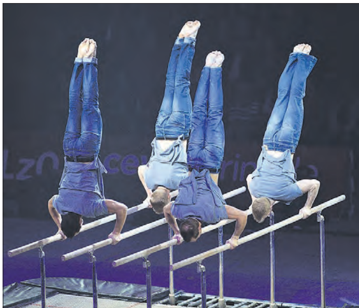
Perfektion oder Kollision: Das internationale Akrobatik-Quartett „Barrolin“ verblüfft das Publikum bei der 29. Sport-Gala mit heißer „Muskel-Sinfonie“ an einer Spezialkonstruktion.

Die 29. Auflage der Kult-Show am am 2. Februar läuft wie immer in zwei programmgleichen Vorstellungen um 15.30 und um 20 Uhr. Karten im Vorverkauf gibt es unter anderem bei der Soltau-Touristik. Ausführliche Informationen: www.sportgala-walsrode.de und facebook.com/sportgala-walsrode .