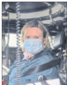
Högl wartete im Spähwagen Fennek auf den Kommandeur der Panzertruppenschule, Brigadegeneral Ulrich Spannuth.

die sehr engagiert und sehr professionell ihren Auftrag erfüllen. Ausbildung ist eines der wichtigsten Themen, die wir in der Bundeswehr haben, um den Auftrag zu erfüllen. Das Ministerium und der Bundestag sind in der Pflicht, den Soldaten und Soldatinnen die Rahmenbedingungen zur Verfügung zu stellen. Auch in Munster mangelt es in Bereichen des Materials, der Infrastruktur und des qualifizierten Personals. In diesen Bereichen sehe ich Handlungsbedarf - und diesen Auftrag nehme ich als Wehrbeauftragte mit nach Berlin.“