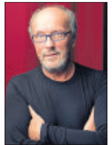
Mit dem Auftritt von Hans-Werner Olm startet am 27. Juli die Kulturwoche „Zwischenspiel - Das Zelt“. Der HK verlost für diesen Abend Freikarten.

SOLTAU. Gleich zum Auftakt der Kulturwoche in Soltau wartet ein Knaller: Mit dem Auftritt von Hans-Werner Olm startet am 27. Juli um 20 Uhr die Reihe „Zwischenspiel - Das Zelt“ im BöhmePark. Der Heide-Kurier verlost dreimal zwei Freikarten für diesen Abend.