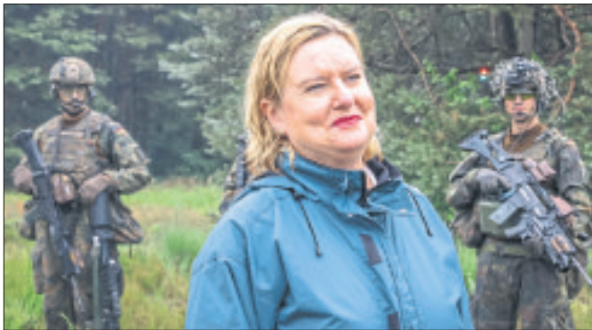
Die Wehrbeauftragte des Deutschen Bundestages, Dr. Eva Högl, hier mit abgesehenen Panzergrenadiern, informiert sich in Munster.

Dort lernte die Wehrbeauftragte den Kampfpanzer Leopard 2 und den Schützenpanzer Puma kennen. Die Soldaten präsentieren ihre komplexen Arbeitsplätze und die damit verknüpften Ausbildungen und Herausforderungen. Besonders bei Leopard 2 und Puma wird der Übergang zwischen dem analogen und dem digitalen Gefecht gut sichtbar. Högl ließ es sich nehmen, den Leopard 2 selbst vom Kommandantenplatz ins scharfe Schuss zu führen. Außerdem war sie als Teil der Besatzung mit den Bord des Schützenpanzers Puma, um den Feuerkampf der Panzergrenadiere hautnah mitzerleben. „Es ist für meine Aufgabe als Wehrbeauftragte sehr wichtig, die Ausbildung am Panzer unmittelbar zu erleben. Ich bin allen sehr dankbar, die sich für eine gute Ausbildung engagieren“, betonte Högl unmittelbar nach dem Schießen und der Fahrt