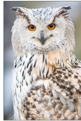
Uhus und Eulen sind die Stars bei der Greifvogelvorführung „Jäger der Nacht“.

Und noch bis zum 4. August gastiert das Lauenburg-Puppentheater im Park, dann heißt es dreimal täglich: Bühne frei für Kasperle, Räuber Hotzenplotz, die Hexe und Maskottchen „Willi Wildpark“. Mehr Infos gibt es online unter www.wild-park.de .