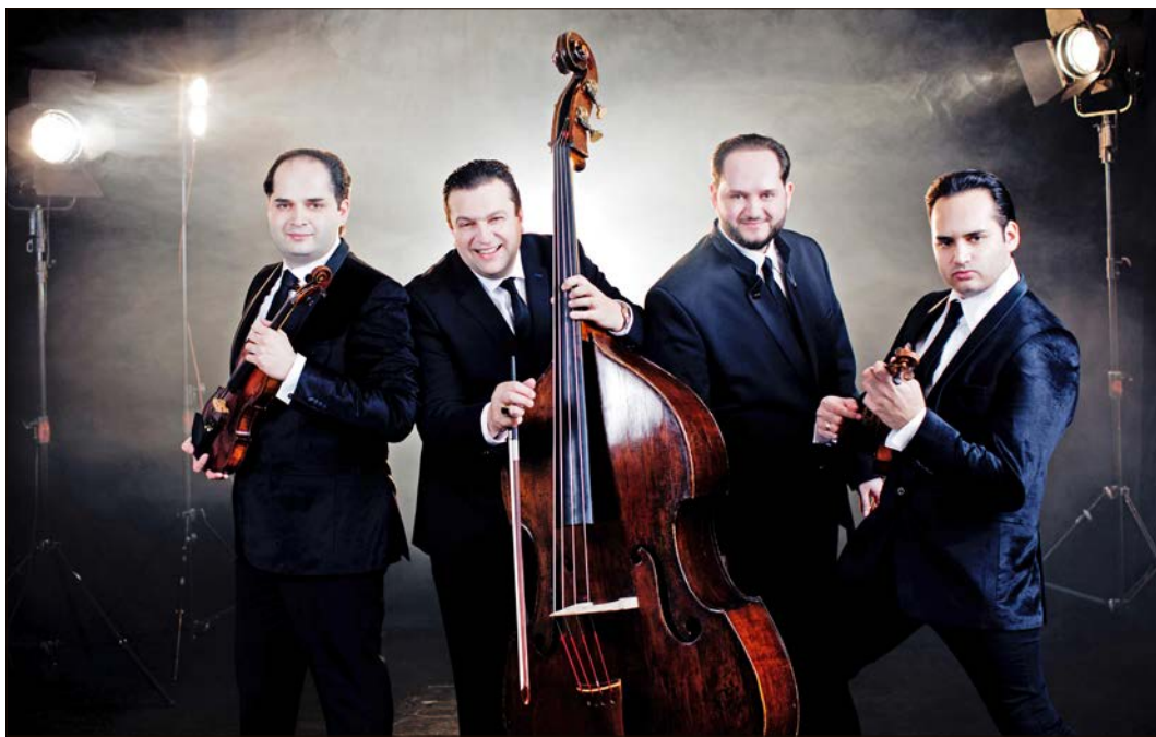
Beim Konzert im Rahmen der Niedersächsischen Musiktage präsentiert das Janoska Ensemble eine „kreative Kettenreaktion“ mit Bach, Beatles und viel Balkan-Swing.

Janoska Ensemble: Konzert als „kreative Kettenreaktion“ am 5. September