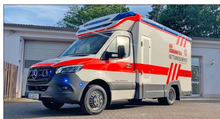
Die Johanniter-Unfall-Hilfe fährt ab sofort Einsätze im Norden des Landkreises Celle.

„Neben der Notfallrettung und dem Krankentransport im nördlichen Landkreis Celle greifen die Johanniter auf gewachsene ehrenamtliche Strukturen im Ortsverband Celle zurück“, erklärt Harmening. „Die Helferschaft hat bereits mehrfach bei Großschadensereignissen, Sondereinsätzen und auch bei zahlreichen Sanitätsdiensten ihre Kompetenzen und Stärke bewiesen.“ Beauftragt mit dem Rettungsdienst sind die Johanniter nun für acht Jahre, bis zum 30.