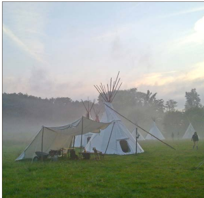
Zu „Tipi-Tagen“ lädt das Waldpädagogikzentrum (WPZ) Lüneburger Heide am 6. und 7. August ein.

Zwei Tage „Leben wie Indianer“ in Ehrhorn