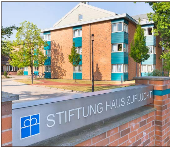
Die Nachfolge an der Spitze der Soltauer Stiftung steht bislang noch nicht fest.

„Die Stiftung Haus Zuflucht war und ist eine gemeinnützige Einrichtung der Diakonie der evangelisch-lutherischen Kirchengemeinden in Soltau. Mitarbeiterinnen und Mitarbeiter werden nach einem mit der Gewerkschaft ausgehandelten Tarif bezahlt. Und es wurde und wird zum Wohle der betreuten Menschen in die Weiterentwicklung der Stiftung investiert“, so Aufmkolk. Und weiter: „Es waren wunderbare 18 Jahre, in denen wir gemeinsam viel, sehr viel bewegt und erreicht haben - und immer zum Wohle der Kolleginnen und der Menschen, die wir betreuen.“ Wer nach Aufmkolk den Chefessel übernimmt, steht noch nicht fest: Die Suche nach einem Nachfolger läuft derzeit, Ergebnisse gibt es noch nicht.