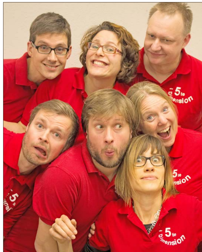
Zu Gast in Schneverdingen: „Die 5. Dimension“ aus Hannover ist eine lustige Gruppe, die das spontane Theater liebt.

Abendkasse. Weitere Infos finden Interessierte unter www.Kulturverein-Schneverdingen.de .