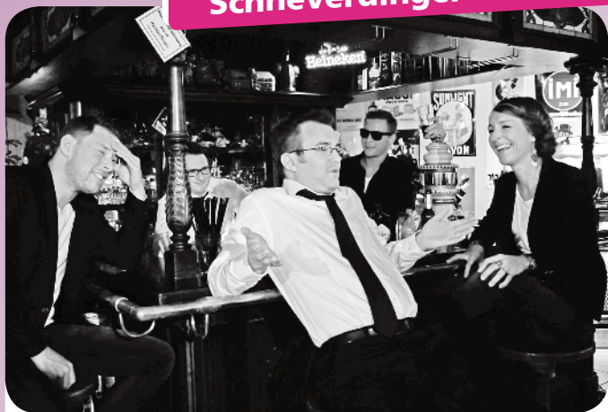
Die Band „Turbulenzen“ macht die kommende „Musik am Mittwoch“ am 24. Juli zur Scheunenfete.

In der Historie der Band ist zu lesen, daß sich die Musiker eher zufällig gefunden haben - im Herbst 2015: Seitdem machen die ehemaligen Mitglieder der Formationen „pimp'd noiz“ und „Mullersand“ unter neuem Namen Covermusik. „Musikalisch geht es ganz grob in Richtung Hurricane-Festival“, so die Einordnung seitens der Band. Mit Songs von „Kings of Leon“, „The Killers“, „Kraftklub“, „Florence and the Machine“, „No Doubt“, „Foo Fighters“ und „Green Day“ wird das aktuelle Rock-Genre bedient. Es gibt aber durchaus auch Stimmungstitel von Otto Waalkes oder den Ärzten, die