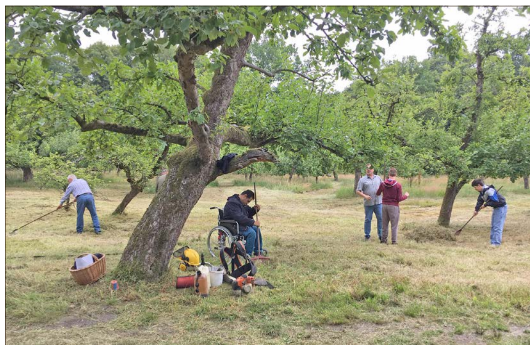
Leichtere Tätigkeiten wie das Harken von Grasschnitt gehören zum Arbeitsspektrum.

Wirklich schwierige Tätigkeiten sind es nicht, die dabei auf die Gäste warten: „Dabei geht es etwa um das Harken von Grasschnitt, das Einsammeln von Baumschnitt oder das Auflesen von Äpfeln“, berichtet Zielke. Für die maximal zwölf Personen, die einmal monatlich für rund zwei Stunden diese Arbeit mit ihren Betreuerinnen und Betreuern erledigen, ist dies indes ein wichtiger Termin, der nicht nur Abwechslung, sondern auch Bestätigung bringt. Dazu Kistner: „Es geht darum, Menschen mit