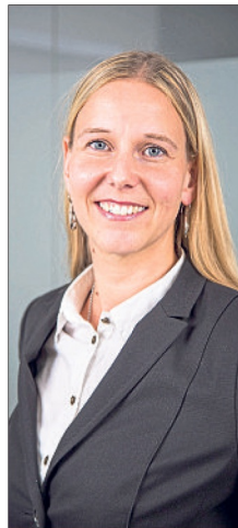
Anja Krebs.

Sprechtag sind unter www.heidekreis.de/foerderungssprechtag zu finden. Das Angebot ist kostenfrei. Eine vorherige Terminabsprache ist allerdings erforderlich. Für weitere Informationen und eine Anmeldung