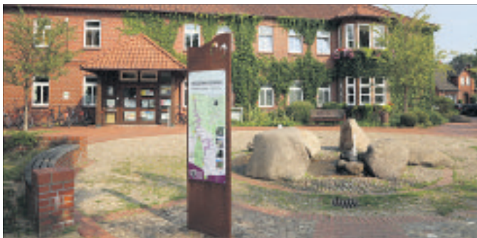
Die Gemeinde Wietzendorf lobt erneut einen Ehrenamtspreis aus.

Gemeinde Wietzendorf lobt erneut Ehrenamtspreis aus