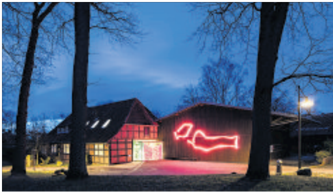
Leuchtend schwingen sich die Umrisse eines rosa Kopfkissens und einer Bettedecke über die Scheunenwand des Kunstvereins Springhornhof.

Kunstinstallation am Springhornhof Neuenkirchen