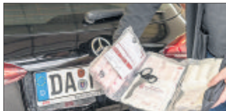
Seit 2014 dürfen nur noch Verbandkästen verkauft werden, die der Norm DIN 13164 entsprechen.

Verändert hat sich seit dem Beginn der Prüfpflicht vor 50 Jahren auch, wie Verbandkästen im Fahrzeug untergebracht werden. Auf der Hutablage zum Beispiel sind Erste-Hilfe-Sets starker Sonneneinstrahlung ausgesetzt, was schlecht für das Material ist. Am besten geeignet sind seitliche Fächer in der Fahrertür oder Taschen an der Rückseite des Fahrersitzes.