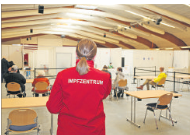
Momentan läuft der Betrieb im Impfzentrum in Bad Fallingbostal etwas ruhiger - notgedrungen.

BAD FALLINGBOSTEL (mwj). Eigentlich wollte Landrat Manfred Ostermann eine positive Perspektive in Sachen Corona-Impfung aufzeigen, als er für vergangenen Dienstag ins Impfzentrum nach Bad Fallingbostal geladen hatte. Doch der Stopp für den Impfstoff von Astrazeneca einen Tag zuvor hat den Plänen von Landkreis und Hilfsorganisationen am Montag einen kräftigen Dämpfer verpasst: „Wenn wir hätten weitermachen können, hätten wir eine Impfquote von elf Prozent erreicht“, so Ostermann. Jetzt allerdings ist dies wohl erst einmal hinfällig. Seit dem ersten Lockdown vor einem Jahr am 15. März 2020 „sind wir von einem Lockdown in den nächsten gerasselt mit geschlossenen Geschäften, geschlossenem Tourismus und geschlossenen Schulen. Deshalb waren wir froh, als wir am 4. Januar 2021 mit den Impfungen starten konnten“, blickt der Landrat zurück.