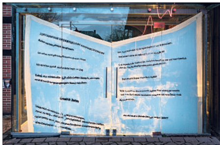
Auf den Doppelflügel der Eingangstür ein aufgeschlagenes Buch in Hinterglasmalerei zu sehen.

Die Ausstellung und die Ausstellungsinstallation werden gefördert durch das Land Niedersachsen, die Stiftung Niedersachsen und den Lüneburgerischen Landschaftsverband.