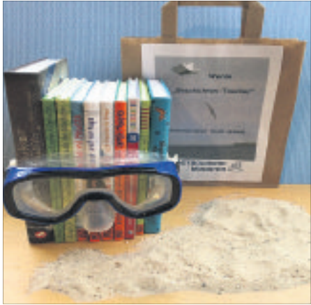
„Werde Geschichten-Taucher“: Dazu ruft die Stadtbücherei Munster jetzt mit einer besonderen Aktion auf.