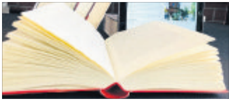
Die Buchvorstellungsrunde für Lesebegeisterte - „gerade zugeklappt - online“ - geht in die zweite Runde.

Zweite Runde: „gerade zugeklappt - online“