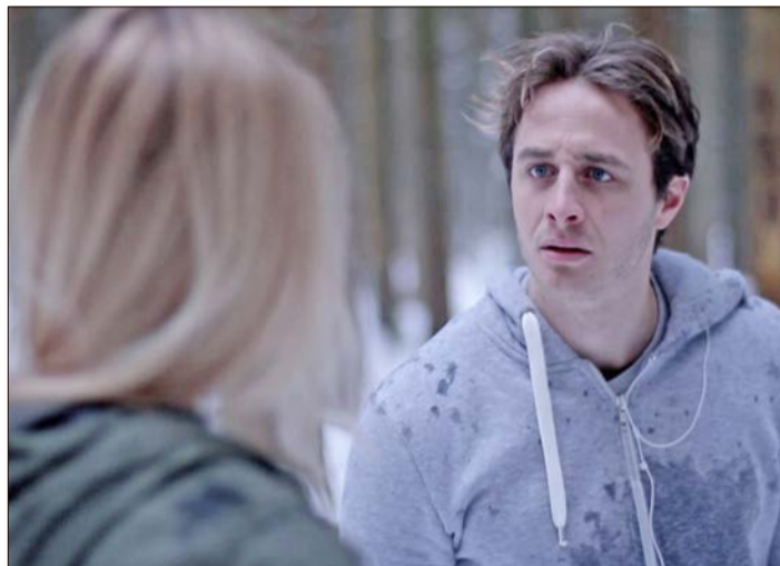
Eine Szene aus dem Kurzfilm „Happy B-Day“.