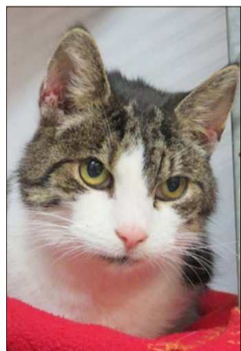
Zur Verbesserung ihrer Gesundheit benötigt Katze „Puschi“ Nierenfutter.

Doch auch die Katzen in der Einrichtung haben Weihnachtswünsche. Zur Verbesserung ihrer Gesundheit benötigt „Puschi“ Nierenfutter: „Wenn in einer langjährigen Beziehung zwischen Zwei- und Vier-