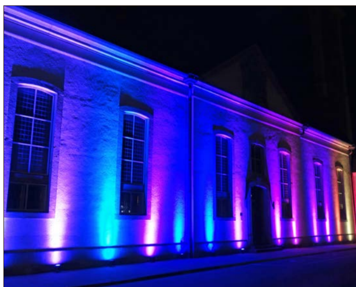
In den beiden Soltauer Kirchen St. Johannis und Luther stehen an Heiligabend Gottesdienste auf dem Plan; hierfür ist eine Anmeldung erforderlich.