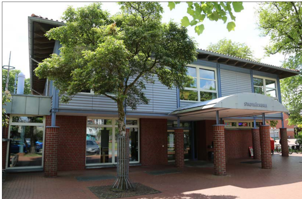
Die Stadtbücherei Munster bleibt wegen der niedersächsischen Corona-Verordnung weiterhin geschlossen, es gibt aber nach wie vor einen kontaktlosen Abholservice.

In Sachen Abholservice gibt es zwischen den Jahren vom 24. Dezember dieses Jahres bis zum 3. Januar 2021 eine Weihnachtspause. In dieser Zeit sind die Mitarbeiterinnen der Stadtbücherei nicht zu erreichen. Ab Montag, dem 4. Januar 2021, geht es dann mit dem Service