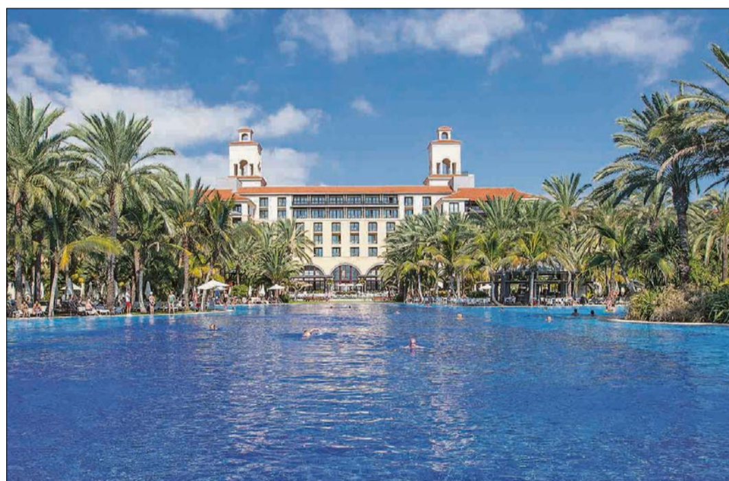
Poolblick aufs Hotel, das den Heidjern einen äußerst angenehmen Aufenthalt bieten wird.

Und wer diese außergewöhnliche Kanarische Insel mit ihren vielfältigen landschaftlichen Reizen und historischen Stätten noch intensiver entdecken möchte, der kann dazu vier Ausflüge buchen: Zunächst wartet ein Ausflug (halbtägig) mit dem Bus, der die Teilnehmerinnen und Teilnehmer auf der atemberaubend schönen Küstenstraße im Südwesten der Insel in das malerische Fischerdorf Puerto de Mogán bringt, das wegen seiner vielen Kanäle auch „Klein-Venedig“ genannt wird. Ebenfalls zum Ausflugspaket gehört eine ganztägige Inselrundfahrt (Mittag-