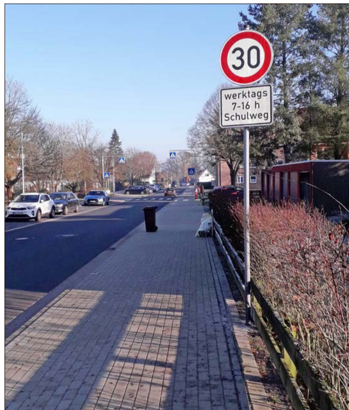
Jetzt gilt 30 auf dem Schulweg in Munster.

Hierzu bezieht sich die Verkehrswacht auf den Leiter des Polizeikommissariates Munster, Kriminalhauptkommissar Dirk Ebel. Der habe gemeint, dass aufgrund der derzeitigen positiven Personallage an eine erneute Ausbildung von Beamten gedacht werde, die Laser-Geschwindigkeitsmessung vornehmen könnten. Die Munsteraner Dienststelle ist neben der Örtzstadt auch für Bispingen und Wietzendorf zuständig.