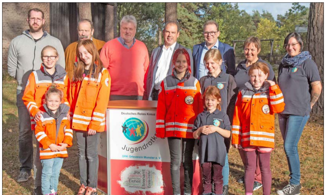
Bei der Spendenübergabe des Lions-Clubs Munster-Bispingen an das Jugendrotkreuz des DRK Munster.

Lions-Club unterstützt Munsteraner Jugendorganisation