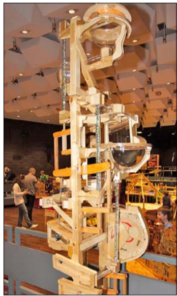
Mehr als zwei Meter hoch ist der Vier-Zylinder-Murrnelaufzug.

Mehr als zwanzig Murrnelburgen, Flipper, Wettrenn- und Kurbelbahnen verteilen sich auch in diesem Jahr