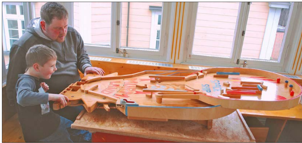
Die bespielbaren Murrnelkunstwerke - hier ein Flipper - sind allesamt Unikate.

SOLTAU. Winter und Murrnel gehören in Soltau zusammen. Und auch in diesem Jahr dürfen sich alle Murrnel-Freunde auf eine Neuauflage des Murrnelvergügens freuen. Pünktlich zum Beginn der Weihnachtsferien fällt in diesem Jahr der Startschuss für das große Kullern und Rauschen in Spielmuseum und Filzwelt: Vom 21. Dezember bis zum 23. Februar sind märchenhafte Holzkunstwerke zu Gast in den Ausstellungen. Und das Schönste daran ist: Alle Bahnen dürfen bespielt werden! Immer wieder sind staunende Rufe und begeisterte Jauchzer zu hören, wenn die Gäste mit Hingabe kleine Glaskugeln auf die Reise durch abenteuerliche Labyrinth und oder über rasante Flipperpisten schicken.