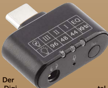
Der Digital-Analog-Wandler des Adapters optimiert die Klangqualität.

Wenn dann aber das Smartphone oder auch das Notebook nur noch einen USB-C-, der Kopfhörer aber einen Klinkeanschluss hat, ist das natürlich erst mal ärgerlich. Für genau dieses Szenario hat ein Zubehörhersteller mit seinem kleinen USB-C-Klinkeadapter eine praktische Lösung parat. Einfaches Anstecken genügt. Der Digital-Analog-Wandler des Adapters optimiert die Klangqualität, drei Equalizer-Einstellungen sollen bei jedem Musikstil und in jeder Umgebung für den perfekten Sound sorgen. Durch das integrierte Mikrofon kann jeder Audio-Kopfhörer sogar zum Telefonieren genutzt werden.