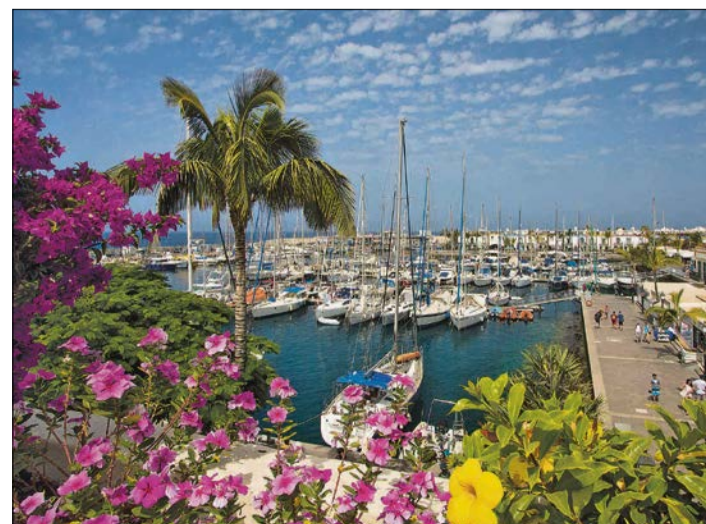
Malerisch präsentiert sich Puerto de Mogán.

Den Vormittag des achten Reisetages können die Teilnehmer noch für sich nutzen, bevor es dann gegen Mittag zum Flughafen geht. Am Nachmittag jetten sie zurück nach Hannover und werden von dort nach einer erlebnisreichen Woche per Bus und Taxi wieder nach Hause zurückgebracht.