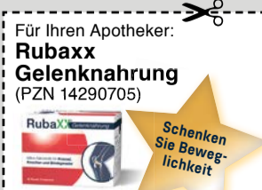
Abbildung Betroffenen nachempfunden • www.rubaxx.de

Unser Tipp: 1x täglich ein Glas Rubaxx Gelenknahrung.