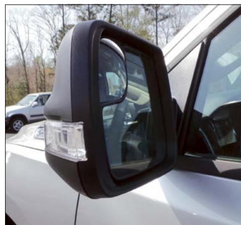
Dank ihrer Außenspiegel sind viele Fahrzeuge breiter als zwei Meter.

Nach Angaben des ADAC waren Autos der Kompaktklasse im Jahr 1978 im Mittel etwa 1,6 Meter breit. Seitdem wuchsen die Ausmaße von Autos dieser Klasse auf knapp 1,8 Meter an.