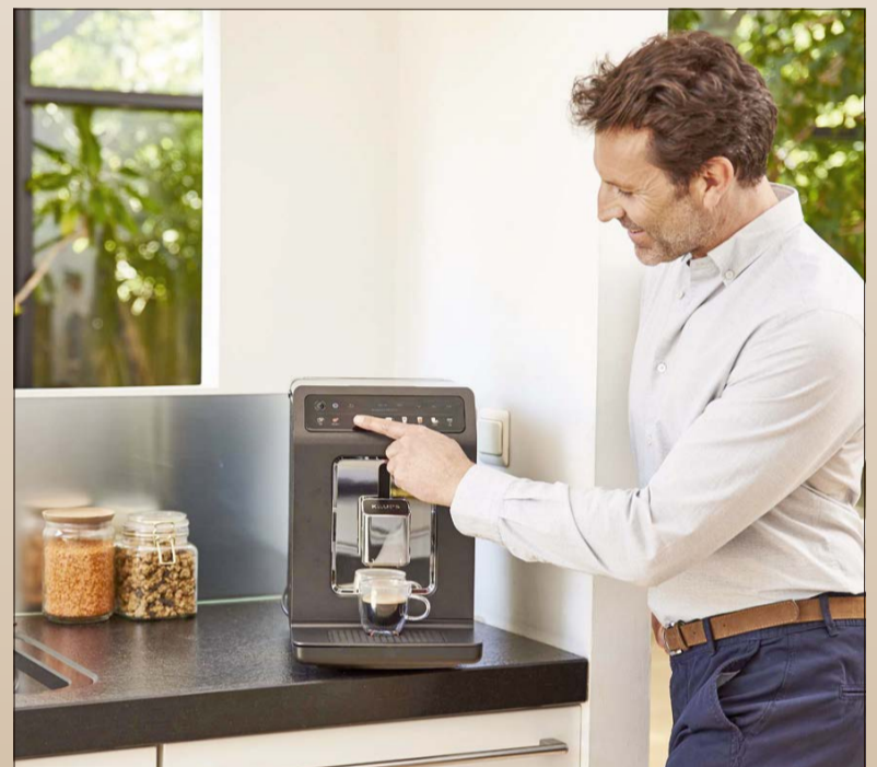
Genuss auf Knopfdruck: Bis zu zwölf Getränke können per Menü festgelegt und auch geändert werden.

Die Geschmäcker sind bekanntlich verschieden und mit dem Kaffeevollautomaten sollte jeder seinen individuellen Lieblingskaffee finden - und kann diesen über das Favoritenmenü gleich mit einem einzigen Knopfdruck abspeichern. Bis zu zwölf