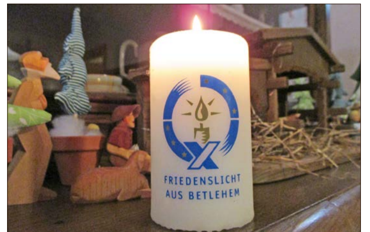
„Mut zum Frieden“ lautet das Thema der diesjährigen Aktion „Friedenslicht aus Bethlehem“.

Auf seinem Weg von Bethlehem in die Heide hat das Licht mehr als 3.000 Kilometer und zahlreiche Mauern und Grenzen überwunden. Es verbindet Menschen vieler Nationen und Religionen. Und die Pfadfinder möchten auch dieses Jahr wieder dazu einladen, das kleine Licht aus