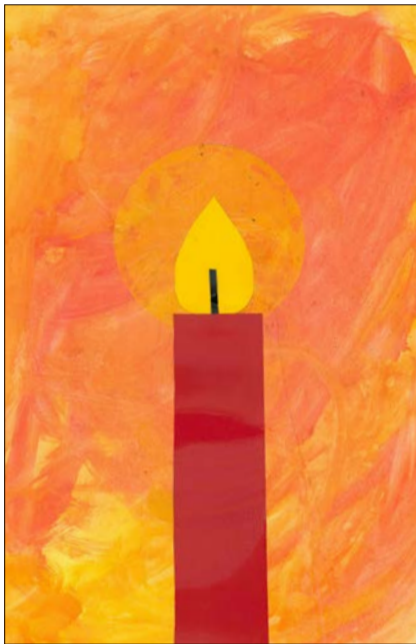
Zum letzten Mal öffnen Kita-Kinder ein Türchen.

Dann geht es vor allem musikalisch zu, denn die Kleinen bringen ihrem Publikum die Lieder „Wir zünden eine Kerze an“ und „Tragt in die Welt nun ein Licht“ mit in die Marktstraße. Die Lieder werden mit Instrumenten begleitet. Im Anschluss daran verteilen die Kinder Kerzen an das Publikum. Alle Soltauer sind eingeladen, dabei zusehen.