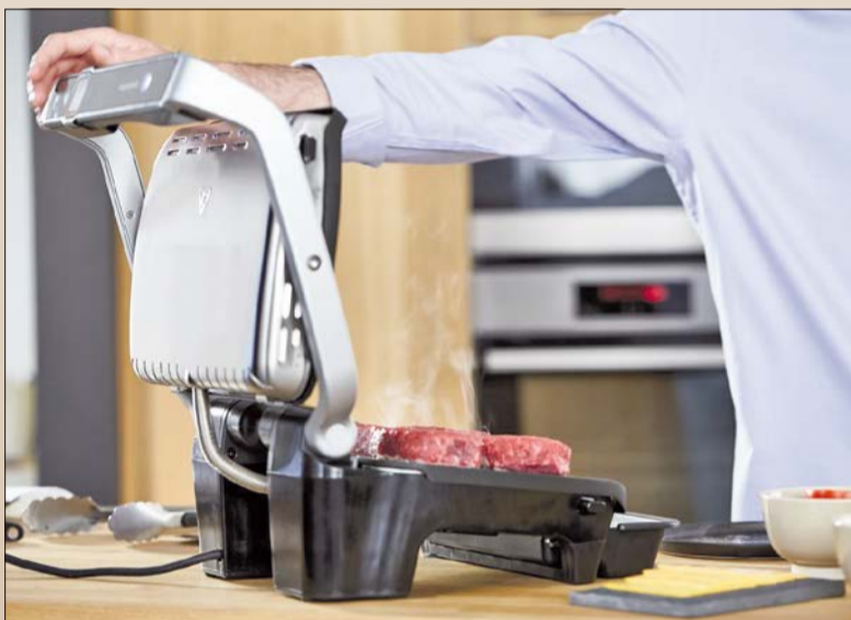
Keine Angst vor großen Fleischstücken - auch die gelingen perfekt.

Praktisch ist zudem die neue Funktion „Nachlegen“: Sind die ersten Steaks fertig, kann ohne Zeitverzögerung und ohne den Grill neu zu starten für Nachschub gesorgt oder das begleitende Gemüse gegrillt werden. In dem manuellen Modus gelingen nun auch bereits vorgebrühte