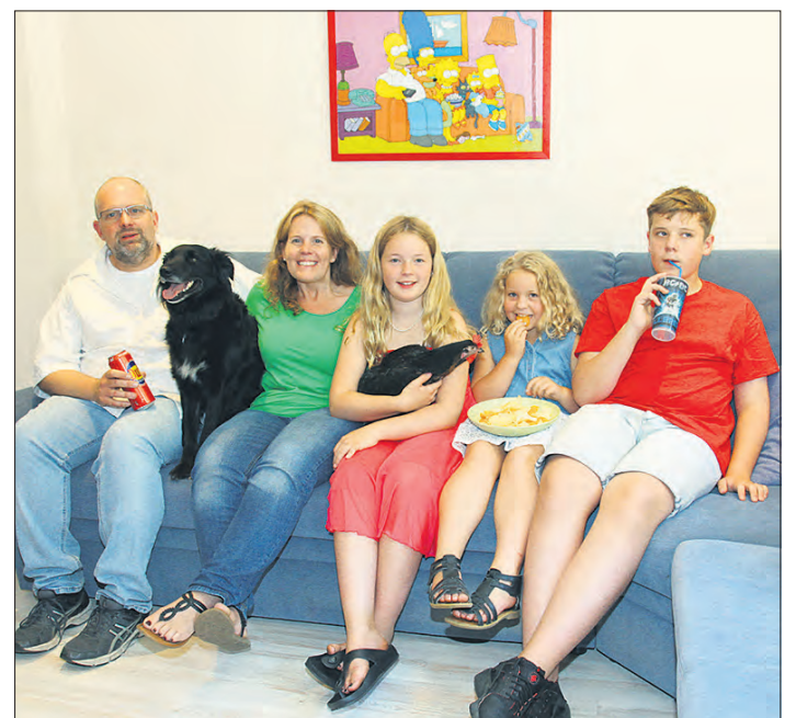
Simpsonsfans erkennen den Couchgag: Familie Allermann hat die Kult-Comicfamilie auf dem heimischen Sofa nachgestellt.

Die Sortierung der Bilder und das komplette Layout des Buchs hat das Team allerdings in professionelle