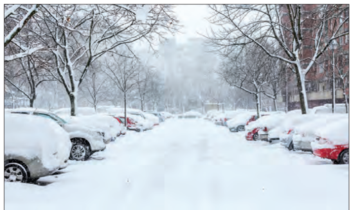
Um Parkschäden zu vermeiden, sollten Autofahrer bei winterlichen Straßenverhältnissen besonders vorsichtig vorgehen.

re winterliche Kalamität aufmerksam: „Verfügt ein Auto über Parkassistenzsysteme, kann es durch Schnee und Eis zu Störungen kommen.“ Sind die in der Stoßstange integrierten Sensoren von Schnee oder Eis bedeckt, piepsen diese dauerhaft. Deshalb rät der Fachmann, vor Fahrtbeginn nicht nur die Scheiben rundum zu reinigen, sondern auch gleich die Stoßfänger vorne und hinten von Schnee, Schmutz und Eis zu befreien. Ein weiteres Problem von Parkassistenzsystemen im Winter ist, dass die Sensoren an sich harmlose Schneemengen oftmals als Hindernis deuten und entsprechend lautstark Kollisionsalarm geben. Andererseits besteht bei getauten und dann durch eisige Temperaturen verhärteten Schneemengen tatsächlich ein erhöhtes Risiko, das Fahrzeug zu beschädigen.