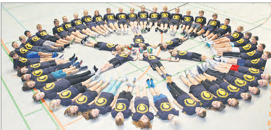
Gruppenfotos finden sich im Fotobuch 2018 reichlich: Ob Handballcamp (Foto) oder Feuerwehr, Nachbarschaften oder Vereine: Der Zusammenhalt der Dorfmarker wird deutlich dokumentiert.