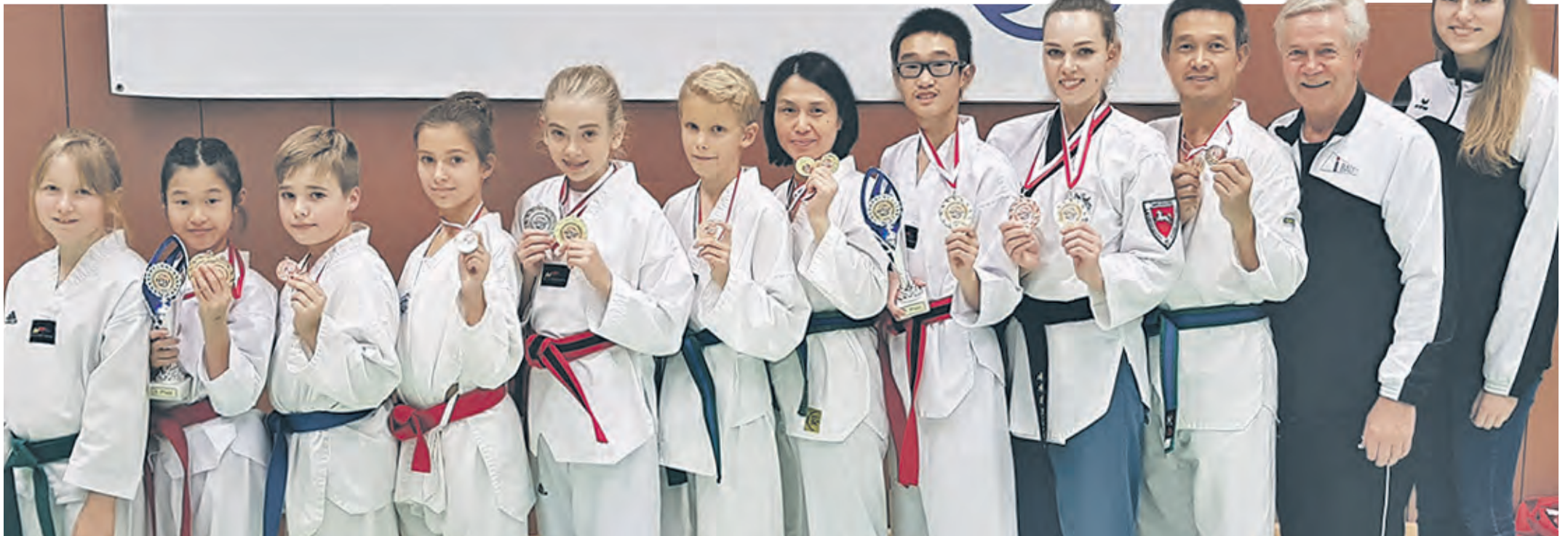
Trumpten beim 3. offenen Technik-Turnier der Niedersächsischen Taekwondo Union in Bomlitz groß auf: die Taekwondosportler vom MTV Bispingen.

Bispinger Kampfsportler beim Wettkampf in Bomlitz überaus erfolgreich / 16 Medaillen errungen