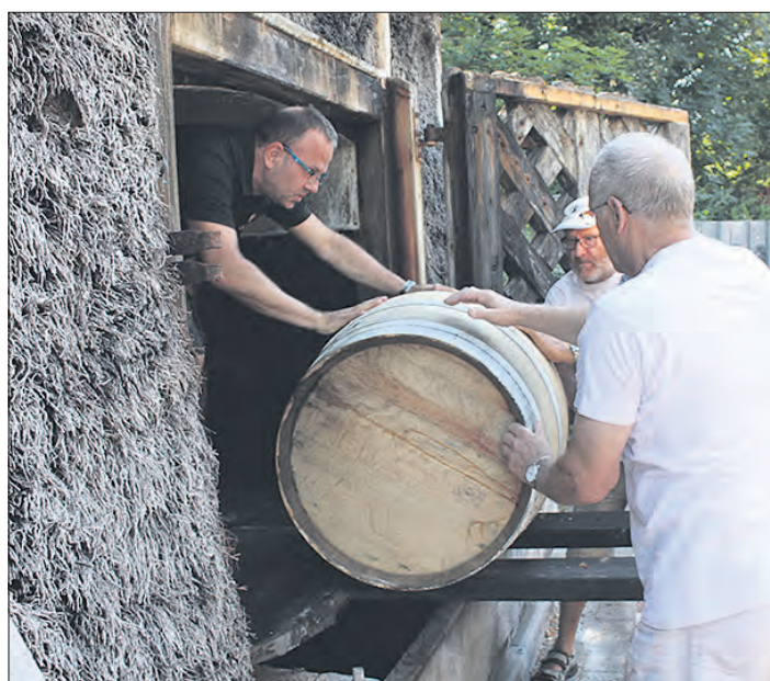
Im Juli verließ der Whisky im Eichenfaß sein „Quartier“ im Gradierwerk der Soltauer Salzsieder (Foto), um jetzt in der Flasche zurückzukehren.

Normalerweise reifte in den Fässern hinter den verschlossenen Türen des Gradierwerks in der Vergangenheit immer der Soltauer Gradierbrand, ein Apfelschnaps, der durch die salzige Umgebung einen besonderen Geschmack zu bieten hat. Für rund ein Jahr hatte der Gradierbrand dann allerdings Pause. Während dieser Zeit war ein Fäßchen Whisky ins Kämmerchen des Gra-