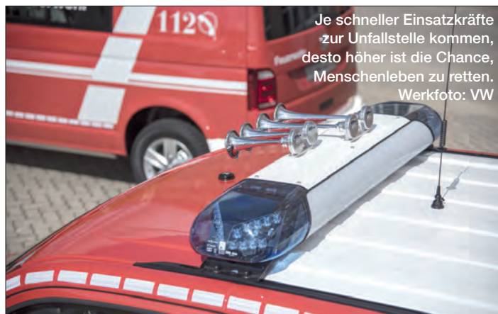
Je schneller Einsatzkräfte zur Unfallstelle kommen, desto höher ist die Chance, Menschenleben zu retten.

Gut merken kann man sich laut Kellner die neue Regelung mit der sogenannten „Rechte-Hand-Regel“. Der Experte vom DVR erklärt: „Man schaut auf die rechte Hand. Die Finger symbolisieren die Fahrspuren, die vor einem liegen. Der Daumen ist die linke Spur, auf der die Autos etwas weiter nach links fahren sollten. Die ‚Lücke‘ zwischen Daumen und Zeigefinger ist die Rettungsgasse.“