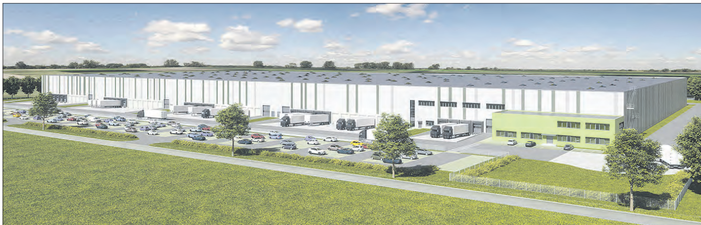
Visualisierung des Hallen-Neubaus von „bauwo“ für „Smyths Toys“ an der A 27 bei Walsrode.

Das Geschäft der Toys“R“Us-Landgesellschaften in der DACH-Region wurde im Mai 2018 von der inhabergeführten irischen „Smyths Toys Superstores Gruppe“ im Zuge ihrer Expansionsstrategie auf dem europäischen Kontinent übernommen. Für den Spielwarenhändler, der ab kommenden Jahr offiziell unter dem neuen Markennamen „Smyths Toys Superstores“ in der Handelslandschaft auftreten wird, stellt das neue Logistikkonzept des für den nach Unternehmensangaben nunmehr größten „Multichannel“-Spielwarenhändler Europas einen wesentlichen Baustein dar. Die Handelskette verfügt insgesamt über mehr als 200 stationäre Geschäfte in Irland, Großbritannien, Deutschland, Österreich und der Schweiz und betreibt zudem in allen Ländern erfolgreiche Onlineshops.