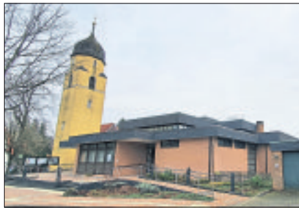
Auch in diesem Jahr gibt es ein Ferienprogramm der Pfarrgemeinde Sankt Marien Soltau und der Fachstelle Jugendpastoral.

SOLTAU. Auch in diesem Jahr wird es wieder ein Ferienprogramm der Pfarrgemeinde Sankt Marien Soltau und der Fachstelle Jugendpastoral geben. Nachdem im vergangenen Jahr rund um das Thema Schöpfung gebastelt und gespielt wurde, wird diesmal der „Auszug aus Ägypten“ mit Spiel und Spaß das Thema sein. Das Programm beinhaltet einen Barfußpfad, viele Bastelprojekte und bei entsprechendem Wetter auch eine „Wasserschlacht“. Das Angebot richtet sich an Kinder ab sechs Jahren und wird zwischen dem 27. und 30. Juli sowie 2. und 6. August jeweils zwischen 14 und 17 Uhr im Garten der katholischen Kirche Sankt Marien in Soltau, Wiesenstraße 5, angeboten.