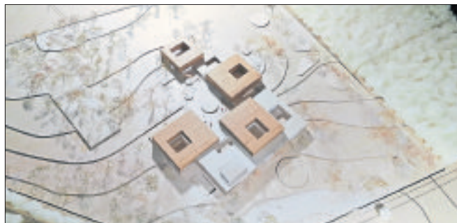
Nach dem erfolgreichen Abschluss des europaweit ausgeschriebenen Architektenwettbewerbs zum Neubau eines Gesamtklinikums für den Heidekreis ist das Modell des Wettbewerbsiegers nun im Landkreis „on tour“, wandert jetzt von Soltau nach Bad Fallingbostal weiter.

nungszeiten das Modell nebst umfangreicher Lagepläne und Objektbeschreibungen den Bürgerinnen und Bürgern präsentiert. Zur Ausstellung gehören auch Ausführungen zur Erschließungsstruktur, zum Städtebau und zur Architektur, zum Nachhaltigkeits- und Energiekonzept und zu Erweiterungsoptionen. Sie wird nun von Montag, 19. Juli, bis Donnerstag, 22. Juli, in der Geschäftsstelle der Kreissparkasse Walsrode, Walsroder Straße 9, in Bad Fallingbostal während der Öffnungszeiten präsentiert. Die ursprünglich vorgesehenen und bereits veröffentlichten acht Ausstellungsorte (Soltau, Bad Fallingbostal, Neuenkirchen, Walsrode, Munster, Schwarmstedt, Schneverdingen und Rethem) werden laut Kreisverwaltung noch um Bispingen und Hodenhagen ergänzt. Die Zeiten und Örtlichkeiten dazu werden rechtzeitig bekanntgegeben.