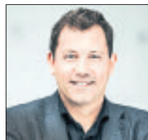
Lars Klingbeil.

SOLTAU. Der heimische Bundestagsabgeordnete Lars Klingbeil lädt interessierte Bürgerinnen und Bürger zu seiner Dialogveranstaltung „Klingbeil im Gespräch“ am 21. Juli in den Soltauer Hagen ein: Von 18 bis etwa 19.30 Uhr möchte der SPD-Politiker im direkten Gespräch Fragen beantworten und Hinweise aufnehmen. „Im persönlichen Gespräch möchte ich auch weiterhin erfahren, welche Themen für die Menschen wichtig sind und wofür ich mich als Abgeordneter einsetzen kann“, so Klingbeil. „Diese persönlichen Gespräche mit den Bürgerinnen und Bürgern sind enorm wichtig für meine Arbeit als Bundestagsabgeordneter für den Landkreis Heidekreis und den Landkreis Rotenburg. Nur wenn ich weiß, wo es Sorgen und Probleme gibt, kann ich mich kümmern“, so der SPD-Politiker. Interessierte können den 43-Jährigen bei der Diskussionsrunde Fragen stellen, mit ihm über eigene Anliegen sprechen und ihm Hinweise für seine Arbeit mitgeben.