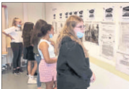
Schülerinnen sehen sich die Ausstellung in der KGS an.