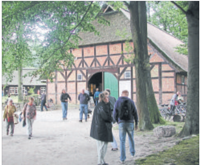
Das „Olen Hus“ in Wilsede steht Besuchern ab sofort wieder offen: Bis zum 31. Oktober hat das Heidemuseum im Ortskern von Wilsede wieder jeden Tag von 10 bis 16 Uhr geöffnet.

Ab sofort und noch bis zum 31. Oktober hat das Heidemuseum im Ortskern von Wilsede wieder jeden Tag von 10 bis 16 Uhr für Besucher geöffnet. Weitere Informationen, unter anderem zu Eintrittspreisen und Corona-Regeln, finden Interessierte im Internet unter https://www.stiftung-naturschutzpark.de/index.php?id=85 .