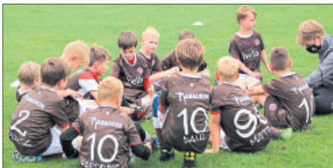
Im August startet die neue Auflage des Rabauken-Fußball-Camps des FC St. Pauli.

Spielfreude und Bewegungsdrang werden mit Koordination, Ballannahme und Ballmitnahme, Dribbling, Schusstechnik, Torabschluss, freiem Spiel, Zweikampfvorhalten und Mini-Fußball werden kombiniert. Alle teilnehmenden Kinder erhalten ein Trikot aus der Rabauken-Fußballschule, bestehend aus einem Trikot mit Wunschnamen und -nummer, einer Hose, einem Paar Strümpfen, einem Sportbeutel und einer Trinkflasche. Zudem erhalten alle Teilnehmerinnen und Teilnehmer einen Rabattgutschein für den St. Pauli-Fanshop. Zudem gibt es einen Dribbel-Contest der Rabauken mit Hilfe eines digitalen Dribbelparcours. Die Jahrgänge 2005 bis 2015 ermitteln die besten 40 Teilnehmer, die dann am Millerntor auf dem Südtübnenvorplatz gegenein-