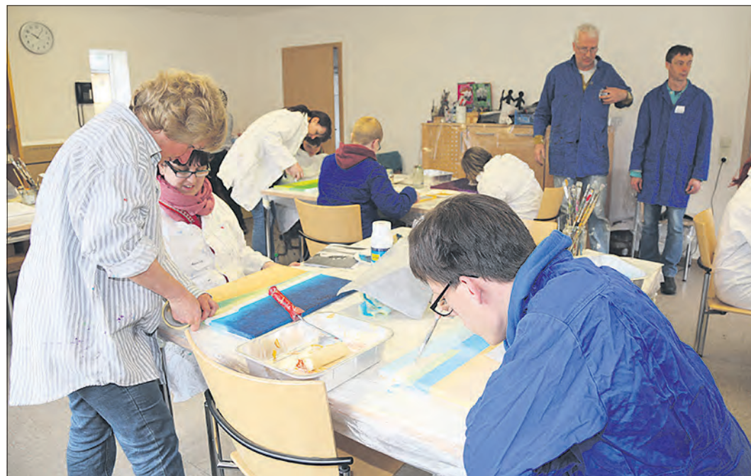
Die verschiedensten Motive bringen die Teilnehmer des Kunstprojektes an den Heide-Werkstätten in Munster zum Thema „Glück“ auf die Leinwand.