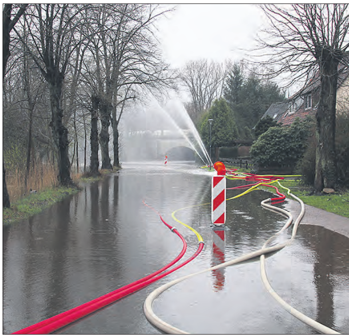
Ein großer See: Die Charlottenstraße in Soltau nach dem nächtlichen Dauerregen am Samstagmorgen.

29640 Schneverdingen, Tinesch 7, Mo.-Sa. 15.00-19.00 Uhr, Tel. 015777290396