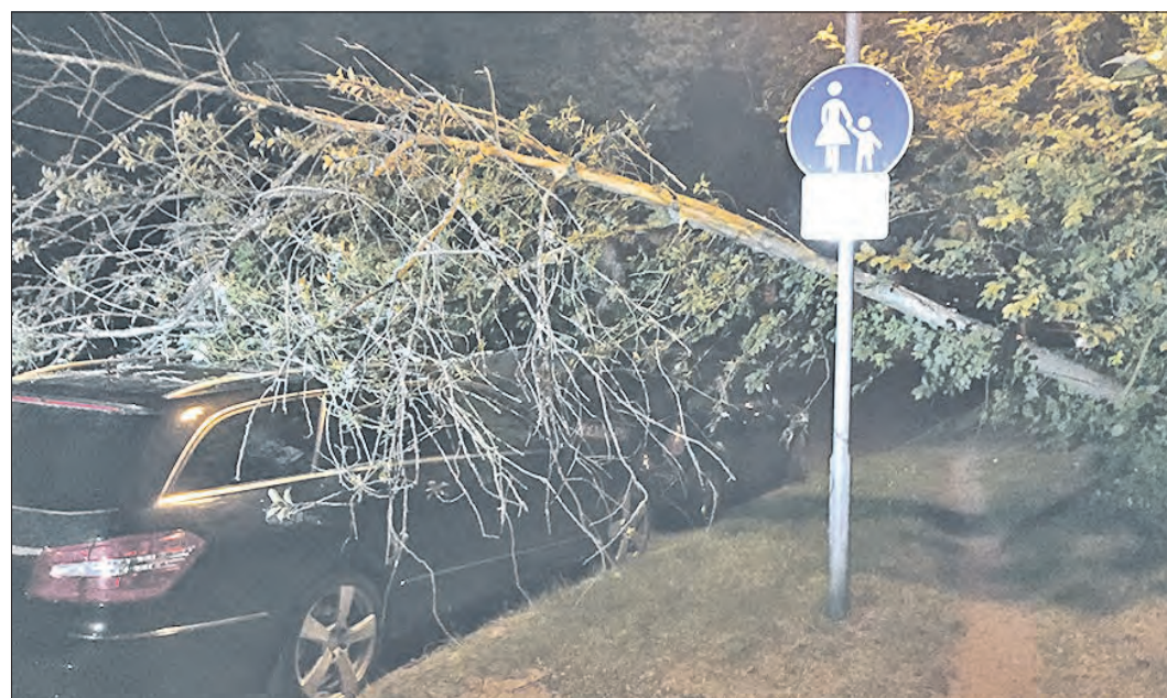
Bei größeren Schadenslagen will die Stadt Soltau nicht mehr für Feuerwehrdienstleistungen zur Kasse bitten.

„Das hat auch der Stadt und den Feuerwehrkameraden nicht gefallen. Es hat sich deshalb die Frage gestellt, was wir tun können, ohne unsere Gebührensatzung, die sich als gerichtsfest erwiesen hat, auszuhebeln“, so der Bürgermeister. Einzelfallentscheidungen wären hier, weil rechtlich kritisch, nicht angesagt gewesen. Die Lösung kam Anfang März von außen: „Seitdem liegt der Verwaltung der Entwurf einer Mustergebührensatzung der Arbeitsgemeinschaft der kommunalen Spitzenverbände Niedersachsens vor. Die beinhaltet nicht nur die neuen gesetzlichen Grundlagen, sondern