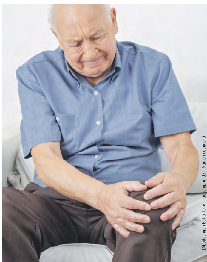
(Abbildungen Betroffener nachempfunden, Namen geändert)

Rücken- und Gelenkschmerzen sind weit verbreitet. Etwa 83 % der Deutschen leiden regelmäßig an Schmerzen im Kreuz, rund 10 Millionen Deutsche an Knieschmerzen. Doch auch Nacken, Hüfte oder Schultern bereiten vielen Probleme. Mittlerweile vertrauen zahlreiche Betroffene auf natürliche Arzneitropfen namens Rubaxx. Das Besondere daran ist der enthaltene Arzneistoff mit dem Namen T. quercifolium. Er entstammt einer