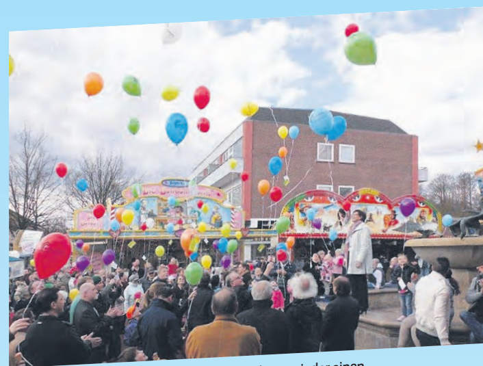
Auch in diesem Jahr gibt es wieder einen Luftballon-Weitflug-Wettbewerb.