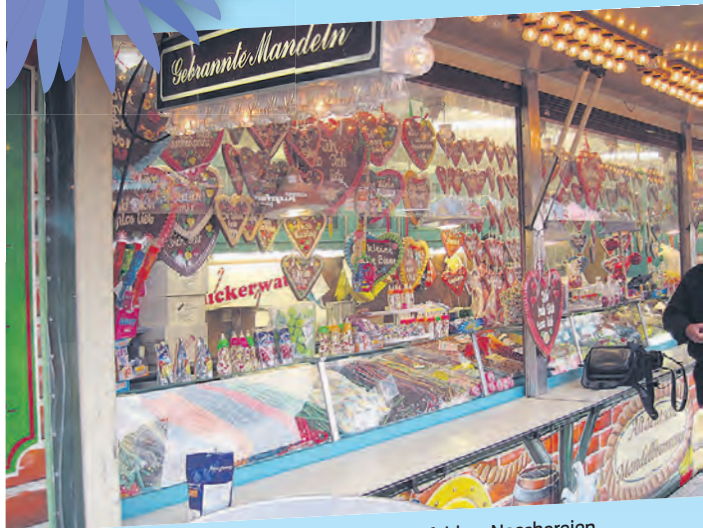
Dürfen auf dem Frühjahrsmarkt nicht fehlen: Naschereien.