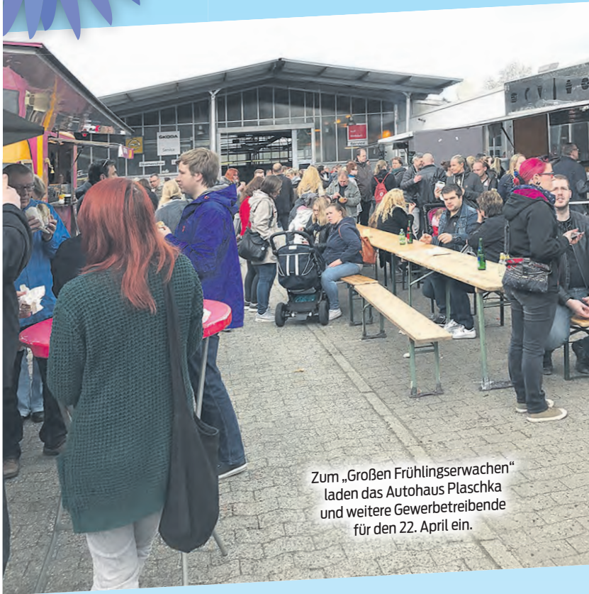
Zum „Großen Frühlingserwachen“ laden das Autohaus Plaschka und weitere Gewerbetreibende für den 22. April ein.

zierungs- und Leasingangeboten auf. Zu den Verkaufszeiten im Rahmen des verkaufsoffenen Sonntags in der Örtzstadt sind auch Probefahrten möglich.