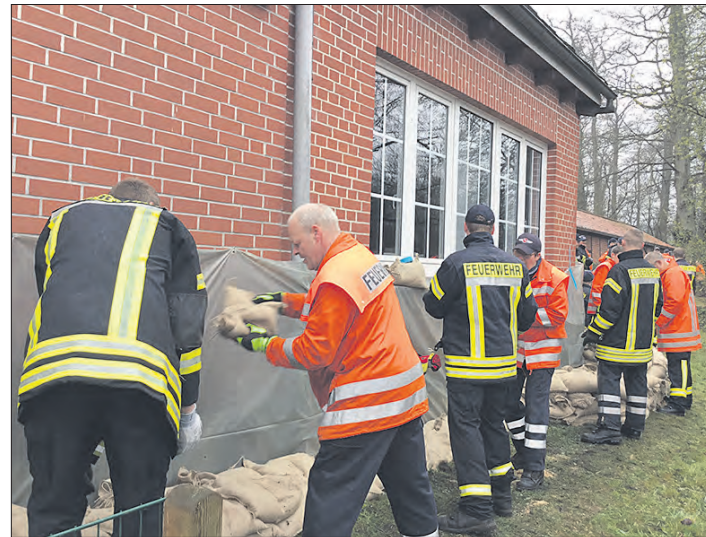
Mit Sandsäcken gegen die Flut: Die Feuerwehr im Heidekreis - hier in Dorfmark - war am Wochenende im Dauereinsatz.

Im gesamten Landkreis waren mehr als 500 Kräfte von Feuerwehr und THW im Einsatz, außerdem teilweise auch die Mitarbeiter der Bauhöfe, vom Kommunalservice und weitere Helfer. Nachdem sich die Lage im Raum Soltau langsam ent-