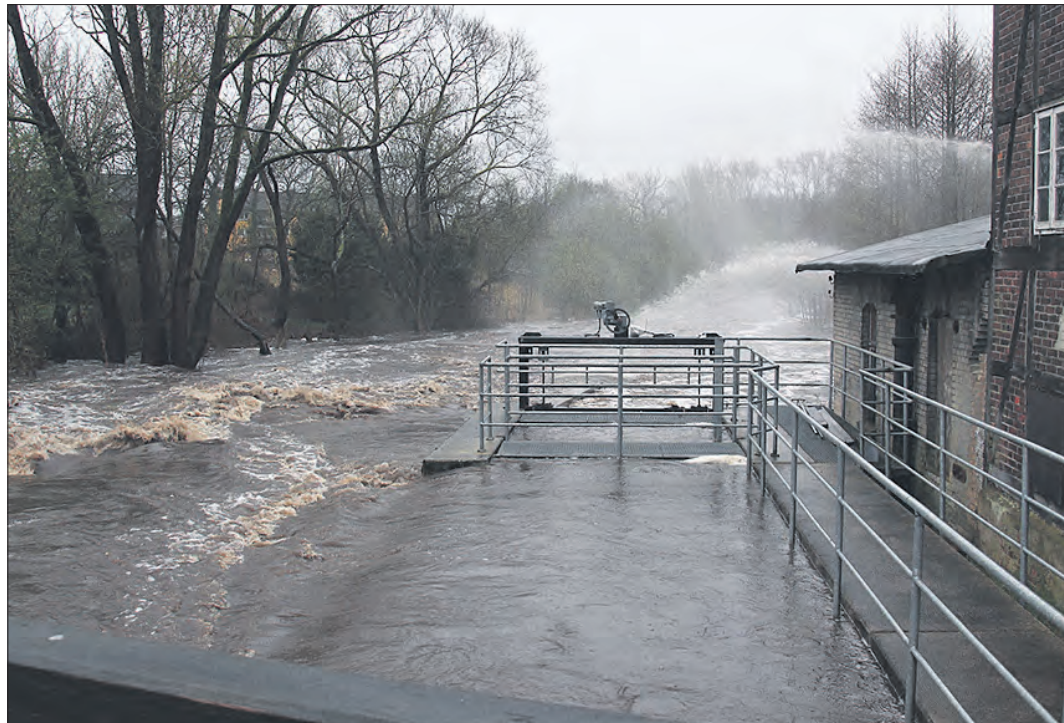
An der Soltauer Ratsmühle zeigten die gewaltigen Wassermassen von Böhme und Soltau ihre unbändige Kraft.