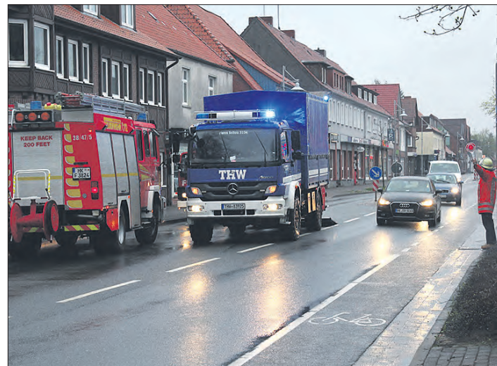
Immer wieder mußte die Soltauer Feuerwehr vollgelaufene Keller leerpumpen.

Entwarnung gab es im nördlichen Kreisgebiet sowie in Dorfmark und Bad Fallingb. Erst am Samstagabend und auch das ganze Ausmaß der Schäden offenbarte sich erst nach und nach.