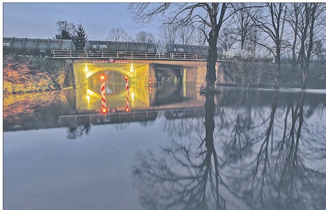
Straßensperrung wegen Wassermassen: Die überflutete Bahnunterführung in der Soltauer Charlottenstraße setzte Jens Kling aus Soltau für unsere Leser mit seiner Kamera in Szene.