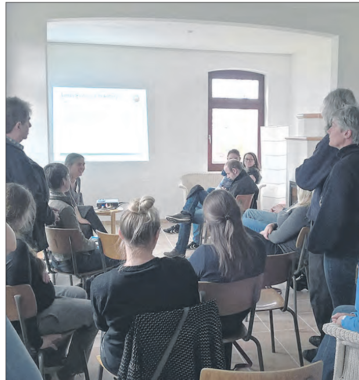
Zahlreiche Besucher interessierten sich für das Konzept der freien Schule, die in Wintermoor ihre Türen öffnen soll.

Noten und gemeinsame Klassenarbeiten wird es in diesem Jahr-