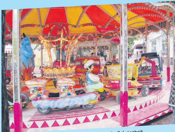
Für die kleinen Besucher gibt es wieder Gelegenheit, im Kinderkarussell ihre Runden zu drehen.