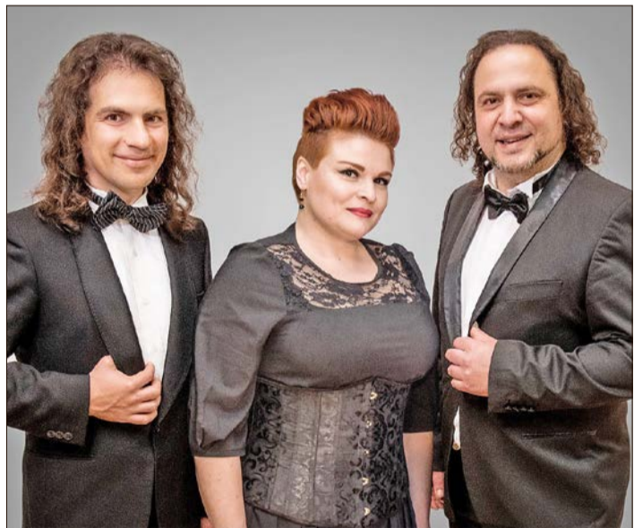
„Sacralissimo“ präsentiert in der Soltauer St. Marienkirche das Programm „Die schönsten Melodien der Welt“.

„Sacralissimo“: Schönsten Melodien der Welt