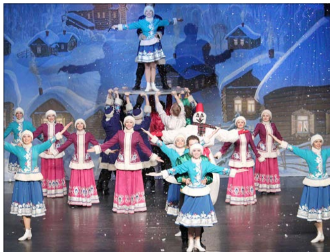
„Ivushka“ heißt die russische Weihnachtsrevue, für die der Heide-Kurier dreimal zwei Freikarten verlost.

SOLTAU. Auf eine farbenprächtige und temperamentvolle Weihnachtsrevue mit Orchester und Chor sowie Tänzern und Artisten in handgefertigten Kostümen nach Originalvorlagen können sich Besucher bei der Aufführung von „Ivushka“ am 28. November ab 19 Uhr in der Aula des Soltauer Gymnasiums freuen. Der Heide-Kurier verlost für die russische Weihnachtsrevue dreimal zwei Freikarten.