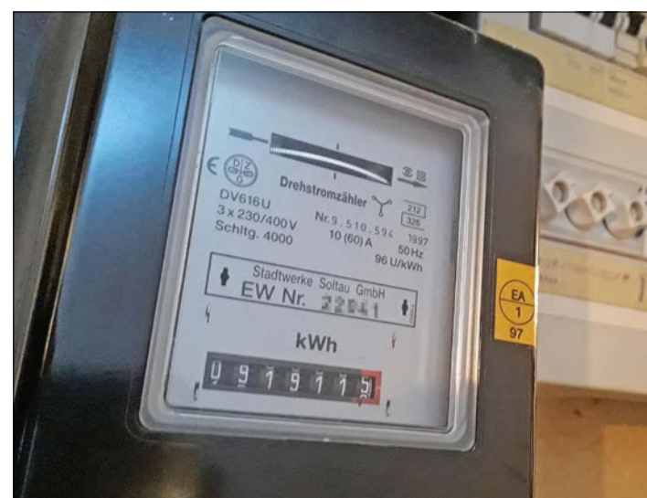
Die Stadtwerke Soltau halten die Strompreise weiter stabil.

SW Soltau: Naturstrom-Qualität bestätigt