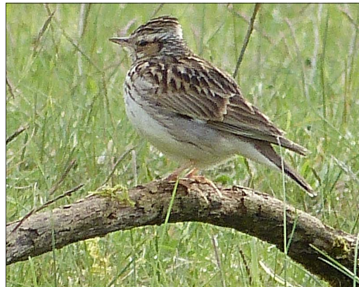
Auch der Gesang der Heidelerche könnte bei der vogelkundlichen Wanderung zu hören sein, zu der der Nabu einlädt.

Nabu lädt zur vogelkundlichen Exkursion ein