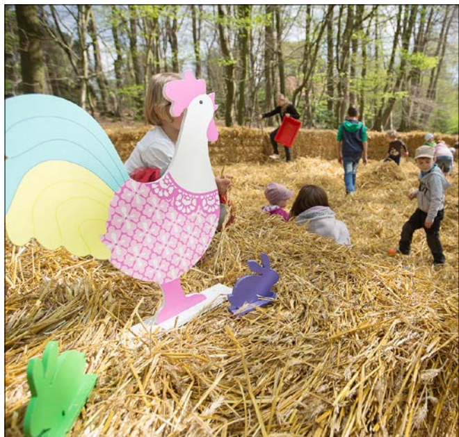
Die Ostereiersuche im größten Osternest des Nordens ist immer ein Highlight für die Kinder.

Wer ein Familienticket für den Wildpark gewinnen möchte, sollte sich am kommenden Donnerstag, 18. April, zwischen 12 und 12.20 Uhr unter der Telefonnummer (05191) 983246 beim Heide-Kurier melden - der ersten drei Anrufer, die „durchkommen“, gewinnen.