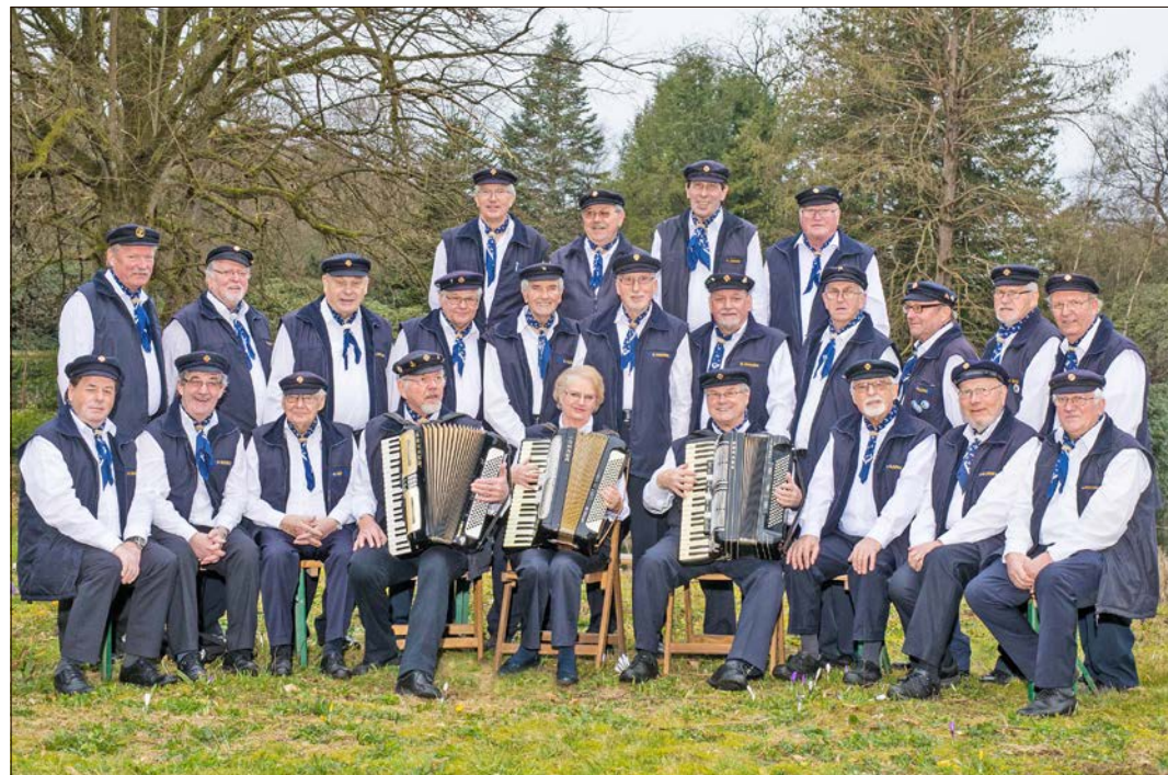
Der Soltauer Shantychor feiert sein 20jähriges Bestehen und lädt zum sechsten Shanty-Festival in die Alte Reithalle ein.

Um hier für sich die Werbetrömmel zu rühren, ist der Shantychor auch auf dem Soltauer Stadtfest, das am 25. und 26. Mai über die Bühne geht, vertreten: Das Ensemble will sich dann über das Fest bewegen, an verschiedenen Stellen singen, sich vorstellen - und vielleicht neue Mitglieder finden. Wer den Chor einmal hören möchte, hat dazu immer am letzten Sonntag eines jeden Monats Gelegenheit, wenn das Ensemble in der Cafeteria des Soltauer Medicin-Klinikums auftritt. Wer sich darüber hinaus informieren möchte, findet Näheres im Internet unter www.soltauer-shantychorev.de .