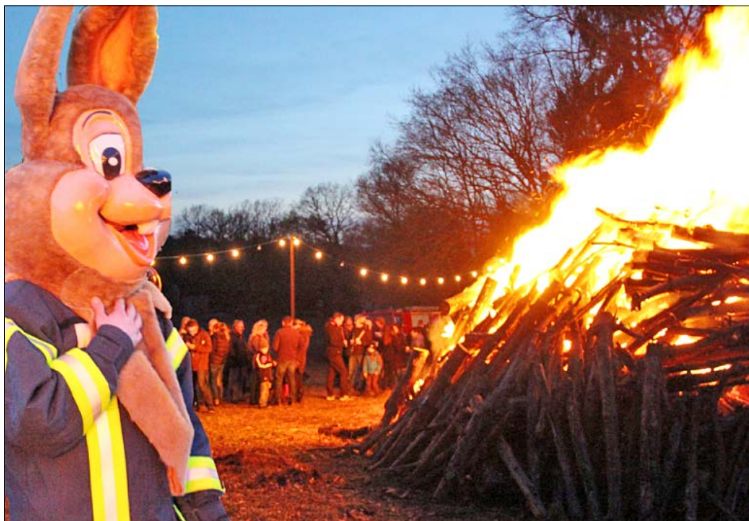
Osterfeuer brennen am kommenden Wochenende - teils am Samstag, teils am Sonntag - in zahlreichen Orten, so auch wieder in der Soltauer Ortschaft Harber, wo der Osterhase auf Kinder wartet.

In Neuenkirchen wird das Osterfeuer erneut am Samstag am Schützenplatz entfacht. Bei Einbruch der Dunkelheit wollen Mitglieder des Schützen-Corps das Stammfeuer auf dem Parkplatz anzünden. Für das leibliche Wohl ist ebenfalls gesorgt. Den Brandsicherheitsdienst übernimmt wieder die Freiwilligen Feuerwehr Neuenkirchen. Für die jungen Gäste gibt es - solange der Vorrat reicht - eine kleine Überraschung. Das traditionelle Osterfeuer in der Ortschaft Tewel brennt ebenso am Samstag ab 19 Uhr - bereits zum dritten Mal als kleineres Aufstellfeuer umrahmt von Feuerkörben und Fackeln. Zur Versorgung der Gäste hat