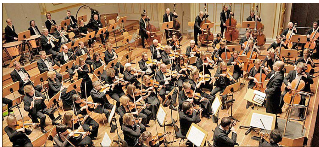
Das Haydn-Orchester Hamburg gastiert in der St.-Michael-Kirche in Munster.

Hamburger Ensemble spielt in der St.-Michael-Kirche