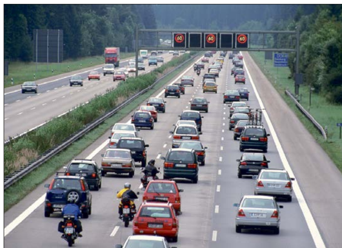
Durchschnittlich mehr als 2.000 Staus pro Tag zählten die Statistiker des ADAC im vergangenen Jahr.

Im Durchschnitt waren dies mehr als 2.000 Staus pro Tag. Die gemeldeten Staulängen wuchsen um rund fünf Prozent und summierten sich auf eine Gesamtlänge von etwa 1,5 Millionen Kilometer - eine Blechschlange, die etwa 38-mal um die Erde reichen würde. Die