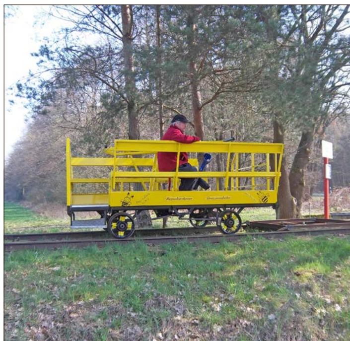
Wartet am Sonnabend auf neue Fahrgäste: Die Handhebel-draisine.

Die Betreiber bitten nach der Fahrt um eine kleine Spende. Neben den beiden schwedischen Schienenfahrzeugen kamen am ersten Fahrbetriebsstag in diesem Jahr auch das Play-Team-Schienenfahrzeug und die Handhebel-draisine zum Einsatz, die leiser ist als die schwedischen Schienenräder, aber auch langsamer. Die Handhebel-draisine hat mehr Platz und ist sehr leicht zu fahren - schon eine einzige Person kann sie locker bewegen. „Aber das Pumpen geht auf die Oberarme“, so Christian Thal von der Interessengemeinschaft der Neuenkirchener Draisinenbahn.