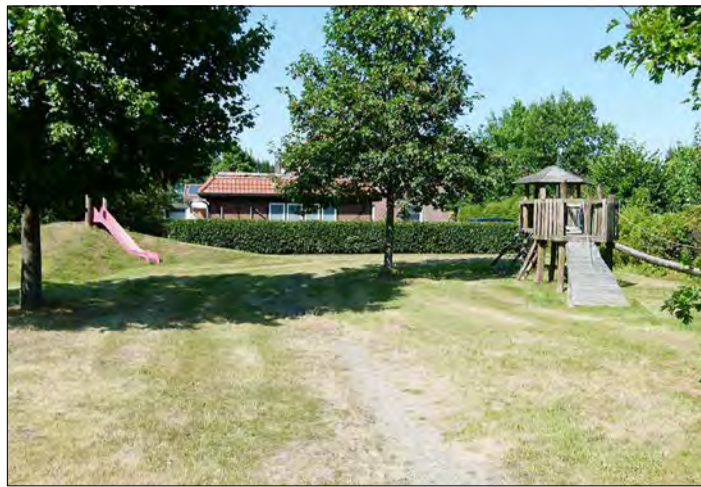
Auch der Spielplatz im Bispinger Ahornweg soll zu Bauland werden, weil er nicht mehr von Kindern genutzt wird.

Vielleicht ist es eine Frage der lieben Gewohnheit oder auch der Ruhe, die mittlerweile von den Spielplätzen ausgeht, dass Anlieger dieser Wohngebiete dem Heide-Kurier gegenüber die anstehende Maßnahme bedauern. Doch auch sie räumen ein, dass diese Areale schon seit langem unverständlicherweise nicht