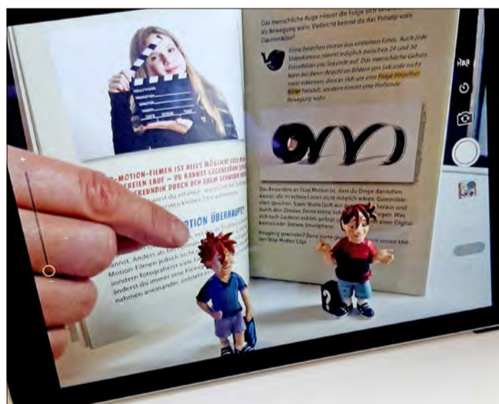
Die Soltauer Bibliothek Waldmühle bietet im Ferienprogramm „Stop-Motion-Animation“ an.

„Stop-Motion-Animation“ in der Waldmühle