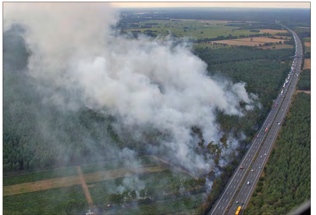
Ein sich schnell ausbreitender Böschungsbrand an der Autobahn 7 sorgte am Mittwoch für eine Vollsperrung zwischen Westenholz und Allertal.

Das für die Brandbekämpfung benötigte Wasser wurde mit Tanklöschfahrzeugen im Pendelverkehr zur Einsatzstelle gebracht, außerdem wurde eine rund drei Kilometer lange Schlauchleitung zur Aller verlegt. „Die Arbeiten für die Einsatzkräfte bei Außentemperaturen um die 30 Grad sind körperlich stark belastend, da in Bereichen mit dichter Rauchentwicklung Atemluftfilter getragen