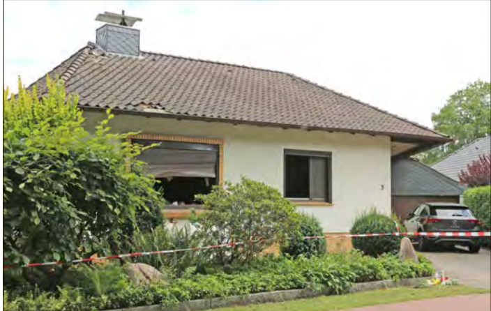
In diesem Haus geschah das Verbrechen - ein 20-jähriger wurde jetzt festgenommen.

Der Beschuldigte habe sich zeitweise im nachbarschaftlichen Umfeld der Opfer aufgehalten: „Derzeit wird davon ausgegangen, dass er aufgrund einer finanziellen Schieflage versuchte, von den Getöteten Geld zu erlangen. Die schwer verletzte Frau konnte aufgrund ihres gesundheitlichen Zustandes immer noch nicht umfassend vernommen werden.“ Da die Ermittlungen zum konkreten Tat-ablauf sowie zu den genauen Hintergründen der Tat andauerten, gebe es derzeit keine weitergehende Auskünfte, so die Staatsanwaltschaft.