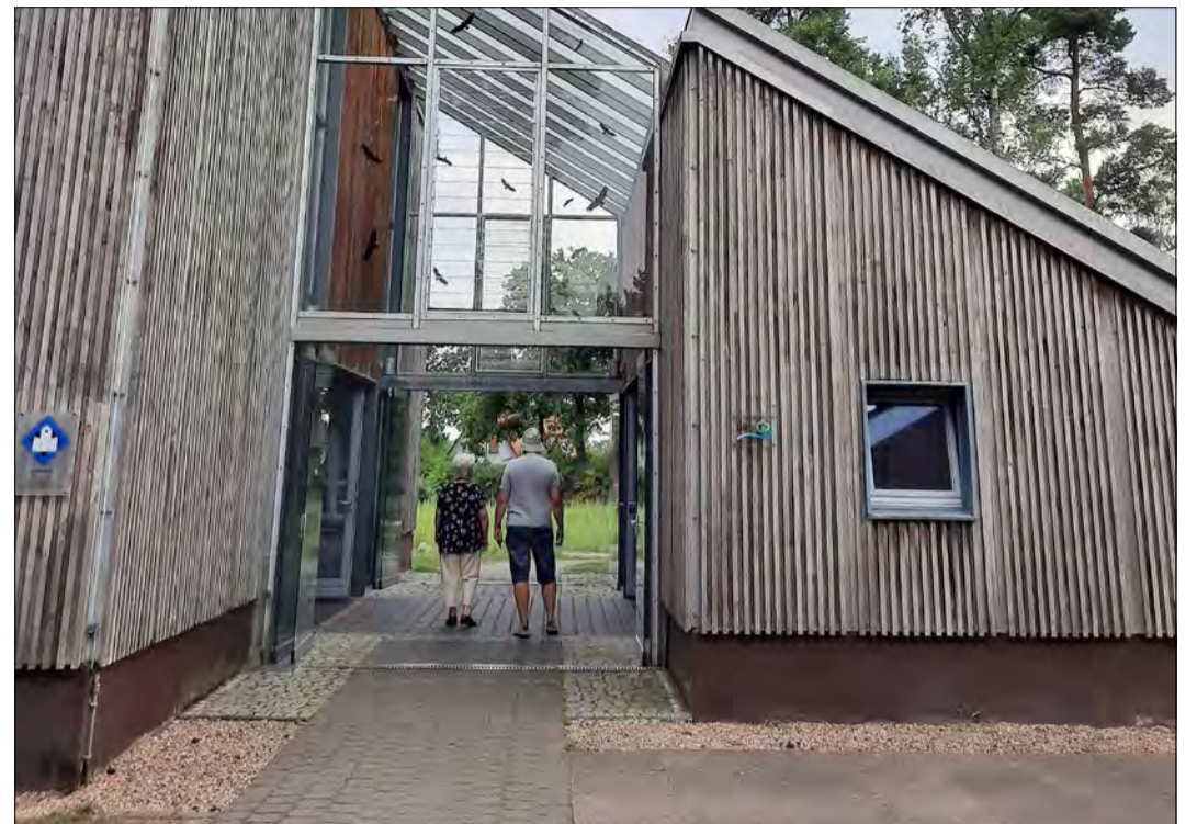
Im Kampf gegen die Alkoholsucht gemeinsam auf den Weg machen: Im Gemeindehaus der Eine-Welt-Kirche trifft sich immer donnerstags die Schneverdinger Gruppe der Anonymen Alkoholiker. Die Gruppe gibt es seit mehr als 25 Jahren.

SOLTAU. Die Mitglieder des Aktiven Frauenkreises Soltau treffen sich am Montag, den 24. August, um 15 Uhr zum Eisessen in der Eisdielen „Cortina“ im Hagen. Anmeldungen sind erforderlich bis zum 21. August unter Telefon (05191) 12775 oder 13243. Die Kaffeemittagspause des Frauenkreises entfallen aufgrund der Corona-Pandemie bis auf Weiteres.