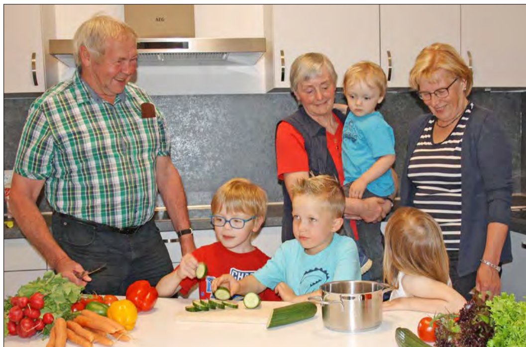
„Generation KiTa trifft Kukident“ lautet das Motto eines Kochprojektes in der Kindertagesstätte Wesseloh. Mit möglichst vielen Stimmen beim „Voting“ im Internet gewinnt der Verein vielleicht einen Förderpreis.

Nun bildet der SHV mit Konkurrenten aus Bienenbüttel und Posthausen eines der bundesweit 40 Regionaltrios, für die am Montag die Abstimmungsphase begonnen hat. Bis zum 11. September entscheidet sich, welcher Verein im kommenden Jahr zusätzlich Nutznießer der Aufrundungsspenden aller Penny-Märkte seiner Region wird. Dabei spenden Kunden an der Kasse bequem für den jeweiligen lokalen Verein, sobald sie beim Bezahlen „stimmt so“ sagen. Automatisch wird dann der Betrag des Kassensbons auf die nächsten vollen zehn Cent aufgerundet. So