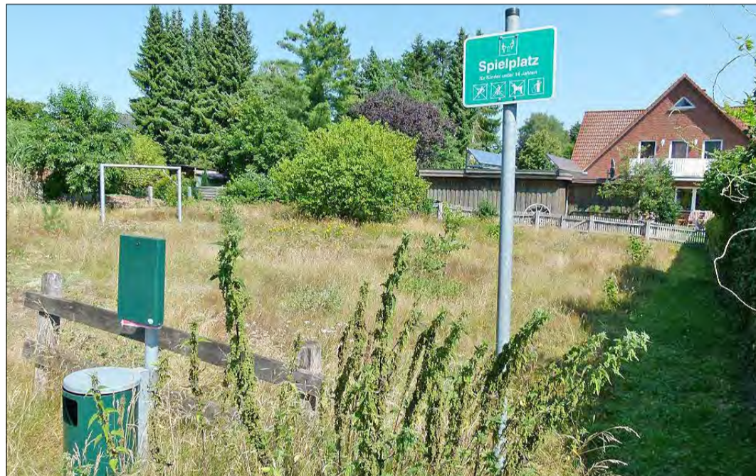
Ungenutzt und überwuchert: Der Spielplatz Brockmannsheide hat schon bessere Tage gesehen.

Er, Bühlhais selbst, habe beispielsweise mit einer kinderreichen Familie gesprochen, bei der sich alles im Garten abspiele. „Sie haben mir gesagt, ein Spielplatz sei für ihre Kinder nicht nötig. Wir haben in Bispingen wieder eine steigende Kinderzahl - und das ist gut. Aber die Spielbedürfnisse werden anderswo ausgelebt, während die Nutzungsfrequenz dieser betreffenden Plätze gleich null ist.“