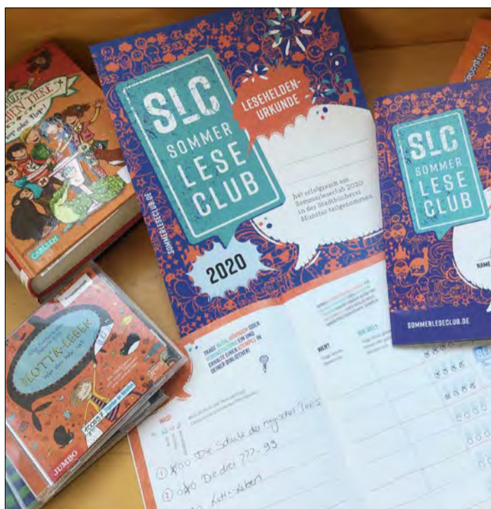
In diesem Jahr gibt es keine Feste zum Abschluss des Sommerleseclubs.

Aufgrund der Corona-Pandemie gibt es in allen Bibliotheken in diesem Jahr keine Abschlussveranstaltungen. Alle Teilnehmerinnen und Teilnehmer, die eine Urkunde, einen Preis oder einen Oskar erhalten, können diese zu festen Zeiten in den einzelnen Stadtbüchereien abholen. Dabei sind die bekannten Hygiene- und Abstandsregeln zu beachten. In Munster teilt die Stadtbücherei den erfolgreichen Kindern und Ju-