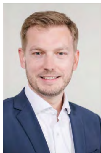
Sebastian Zinke: „Die Landesregierung hält Wort“.

Anlass seien, so die entsprechende Mitteilung der niedersächsischen Staatskanzlei, die gestiegenen Sorgen der Bevölkerung vor möglichen Auswirkungen der Erdöl- und Erdgasförderung für die Umwelt, insbesondere auf das Trinkwasser. Daher seien Genehmigungsverfahren notwendig, die eine maximale Transparenz sowie die stärkere Beachtung der Umweltbelange sicherstellen. Durch eine Umweltverträglichkeitsprüfung und die damit verbundene Öffentlichkeitsbeteiligung könne ein