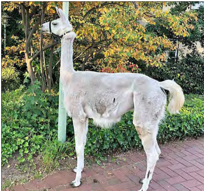
An der Laterne, bei der Soltau-Therme, steht „Klaus“. Ein Passant band ihn dort kurzerhand fest.

SOLTAU. „Drama“ mit Lama: Vierbeiner „Klaus“, der auf einer Koppel in der Straße An der Weide in Soltau lebt, ist die sommerliche Hitze offenbar zu Kopf gestiegen. Vielleicht hatte er auch einfach mal Lust auf einen Tapetenwechsel, denn „Klaus“ bühste am gestrigen Dienstagmorgen aus, um einen Streifzug durch die Böhme zu machen. Dazu übersprang er die Umzäunung seiner Koppel. Der „Ausbruch“ indes blieb nicht unbeobachtet. „Ein Anwohner der angrenzenden Straße konnte das Tier sofort zuordnen und verständigte dessen Besitzerin, die wiederum die Polizei alarmierte“, heißt es im Polizeibericht. Und weiter: „Nach mehreren Hinweisen aus