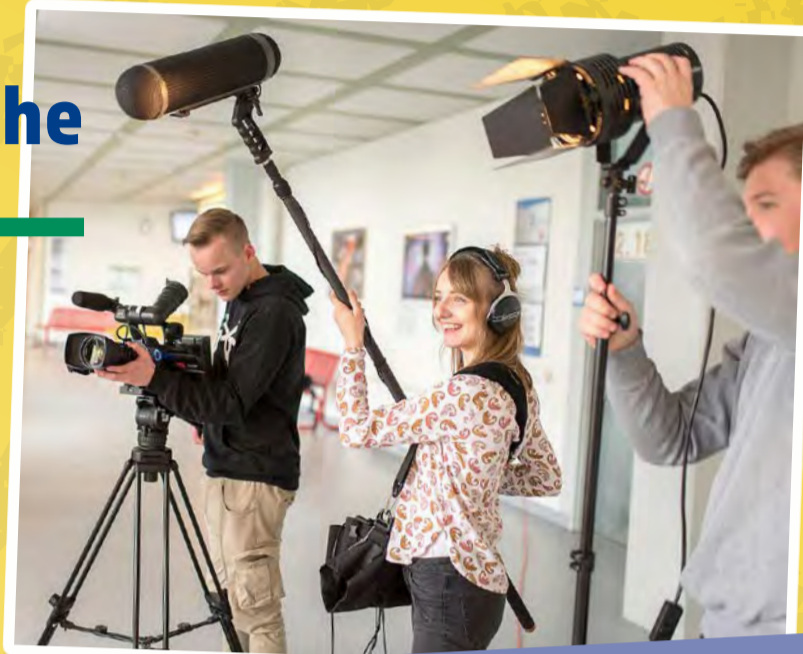
Mediengestalter/-innen Bild und Ton üben in diversen Branchen einen sehr vielseitigen Beruf aus.

Ob in Hörfunk-, Film-, TV- oder Onlineproduktionen, ob in Theatern, Messe- und Veranstaltungsagenturen oder im Marketing und der Unternehmenskommunikation - Mediengestalter/-innen Bild und Ton üben in den unterschiedlichsten Branchen einen vielseitigen Beruf aus, der zudem ständigen technischen Weiterentwicklungen unterliegt.