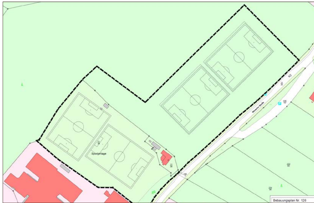
So sähe Variante 3 aus - mit zwei bestehenden (li.) und zwei neuen Sportplätzen (re.). Graphik: Stadt Soltau

Zu den Teilzielen des Sportentwicklungskonzeptes, das auch die Bedarfe der Vereine und Schulen berücksichtigt, gehört unter anderem die Sanierung des Hindenburgstadions, um es zukunftsfähig zu machen. Dazu ist es nötig, für die Leichtathletikanlage „Hindenburgstadion“ einen B-Plan aufzustellen. Das ist unproblematisch, weil der Geltungsbereich durch die derzeitigen Grundstücksgrenzen festgelegt wird. Hier fasste der Bauausschuss einstimmig den Empfehlungsbeschluss zur Aufstellung des entsprechenden B-Planes. Die weitere Ent-