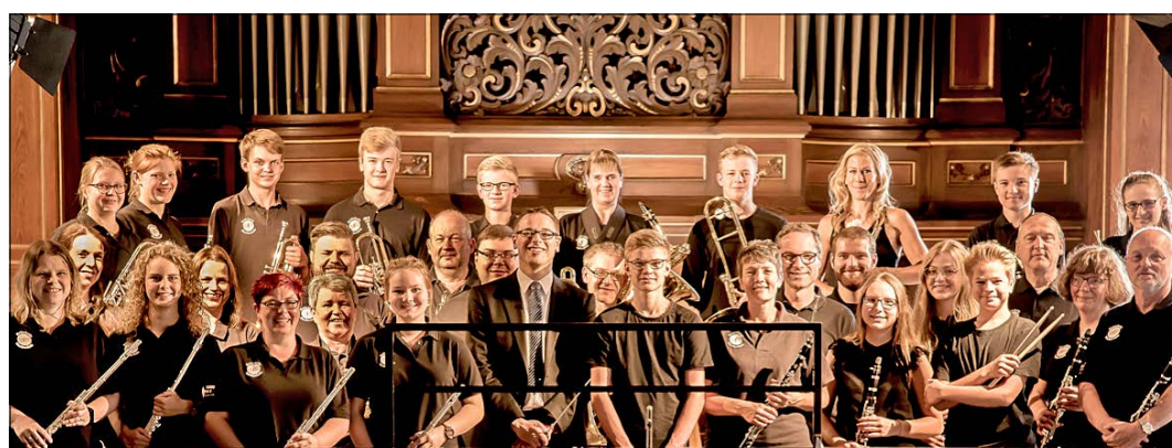
Das Blasorchester „United Winds“ führt im Rahmen eines Benefizkonzertes in der Aula des Gymnasiums Munster „Der kleine Prinz“ auf.

zelung des Menschen durch das Zusammenwirken in der Gemeinschaft aufzulösen“, passe in besonderem Maße zu dem Leitspruch des Lions-Clubs „We serve“, also dem Ziel, der Gemeinschaft dienen zu wollen. Der Reinerlös der Veranstaltung geht an den Schulverein des Gymnasiums Munster. Eintrittskarten sind in Munster erhältlich bei „Optik + Hörgeräte“ Kahnwald, dem Autohaus Plaschka, der Sonnen-Apotheke und der Volksbank Munster.