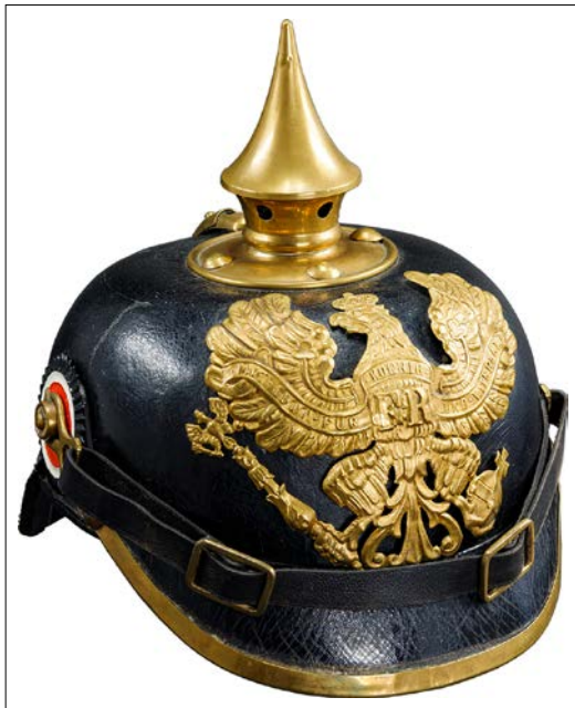
Ihre traditionelle Pickelhaube (li.) mussten die Soldaten im Ersten Weltkrieg ablegen. In der Sonderausstellung sind auch Stahlhelmmodelle wie die Version mit Stirnschutz (re.) zu sehen.

Ausstellung mit ihrem Spezialwissen.“ Nach der Eröffnung am 20. Februar ist „Lebensretter? Der deutsche Stahlhelm im Ersten Weltkrieg“ noch bis zum 1. Dezember im Panzermuseum in Munster zu sehen. Begleitend zu dieser kleinen Sonderausstellung erscheint ein Katalog in Deutsch und Englisch mit hochwertigen Fotografien der Helme. Der Eintritt zur Sonderausstellung ist kostenlos.