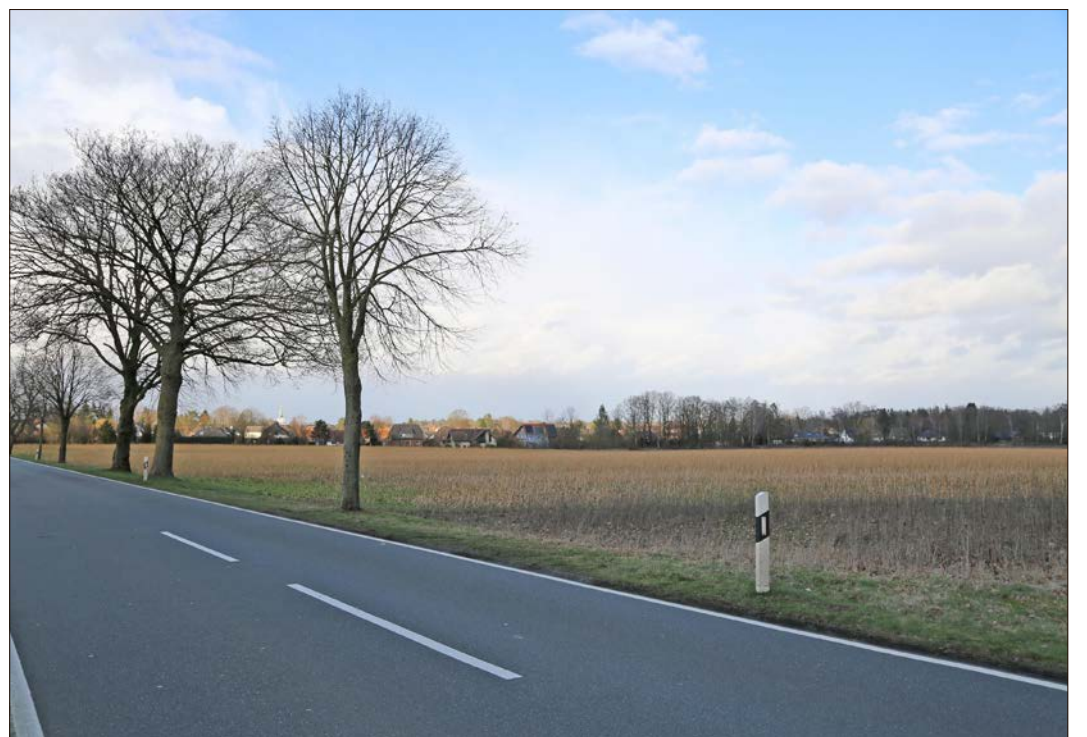
Auf dieser Fläche soll nicht nur Wohnbebauung entstehen - dort befindet sich auch einer von sieben Suchbereichen für einen neuen HKK-Standort.

Details dazu hatte zuvor Bürgermeister Helge Röbber beigesteuert - verbunden mit einer klaren persönlichen Positionierung in der HKK-Neubaufgabe. Auf dem in Rede stehenden Areal - einer Ackerfläche - solle sich die strategische Weiterentwicklung der Stadt vollziehen. Auf den neun Hektar für Wohnbauzwecke, so der Plan, „sollen in einem zukunftsweisenden und nachhaltigen Entwurf um die 100 bis 120 Einfamilienhäuser und Reihenhäuser entstehen“, kündigte Röbber an. Damit solle ein lebendiges und ab-