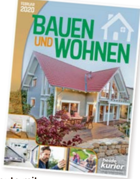
Heute mit Verlagssonderveröffentlichung „Bauen und Wohnen“