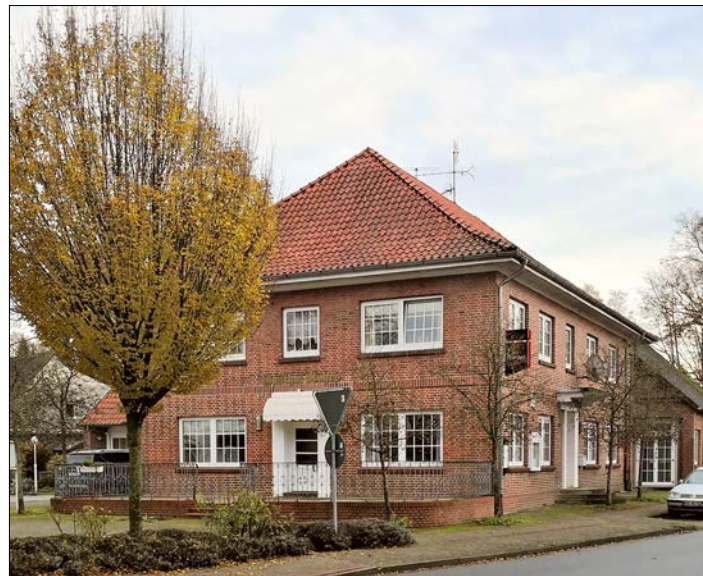
Der Gasthof Röhrs in Fintel soll als Gasthof erhalten bleiben, dafür gründen Dorfbewohner jetzt eine Genossenschaft.