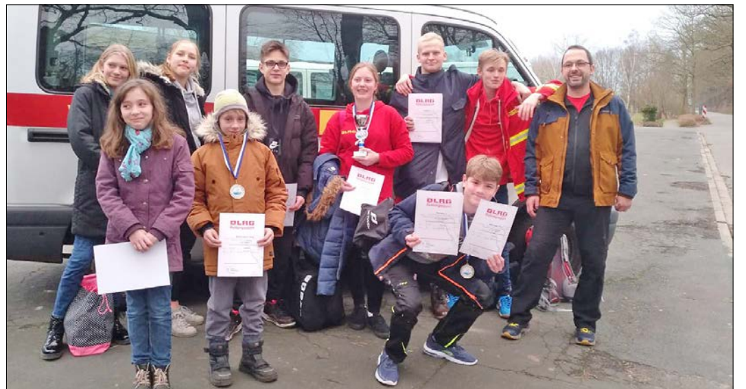
Bei den Bezirksmeisterschaften am Start: die Schwimmerinnen und Schwimmer der DLRG Munster.

Seit dem 1. Januar dieses Jahres gibt es ein verändertes Regelwerk. Die zu schwimmenden Disziplinen sind dadurch noch anspruchsvoller geworden. Die Schwimmerinnen und Schwimmer aus der Örtzestadt mussten sich diesen neuen Herausforderungen im Wettkampf stellen. Einige waren aufgrund ihres Jahrganges gezwungen, sich in ihrer Al-