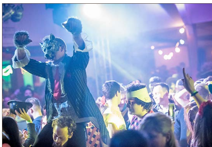
Bunt, laut, schräg und schrill soll auch in diesem Jahr wieder in Neuenkirchen gefeiert werden.

Neuenkirchen: Zwei Feten in Schützenhalle