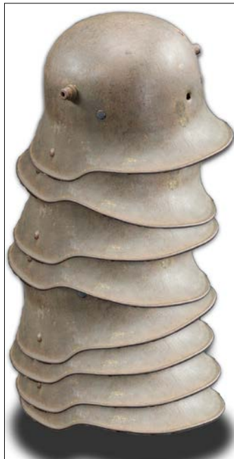
„Lebensretter? Der deutsche Stahlhelm im Ersten Weltkrieg“ heißt die Sonderausstellung, die das Panzermuseum Munster jetzt zeigt.

Der Fokus der aktuellen Sonderausstellung liegt auf der menschlichen Dimension und beschäftigt mit Fragen wie diesen: Welche Verletzungen erlitten die Soldaten? Vor welche Herausforderungen stellten die Materialschlachten das medizinische Personal? Wer erfand und produzierte den Stahlhelm und wie reagierten die Soldaten darauf, ihre traditionelle Pickelhaube ablegen zu müssen? Ein Blick wird außerdem auf die Symbolkraft des Stahlhelms über den Ersten Weltkrieg hinaus sowie auf internationale Stahlhelmentwürfe und -exporte geworfen. „Die Ausstellung ist das Produkt der guten Zusammenarbeit des Panzermuseums mit dem Förderverein des Museums“, so Engau. „So unterstützte dieser die Sonderausstellung nicht nur finanziell, einzelne Mitglieder halfen auch ehrenamtlich bei der Erfassung der Helme, stellten Leihgaben aus ihrer Privatsammlung zur Verfügung und bereicherten die