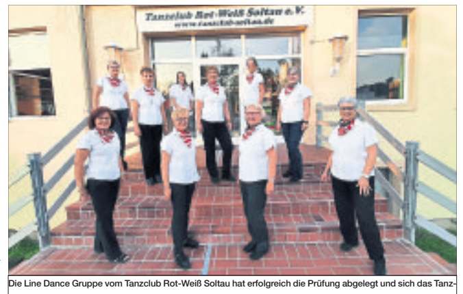
Die Line Dance Gruppe vom Tanzclub Rot-Weiß Soltau hat erfolgreich die Prüfung abgelegt und sich das Tanz-

mehrfach wöchentlich angeboten hatte. Im Kinder- und Jugendbereich wurden acht kleine Tanzstärchen, ein großes Tanzstärchen, 20 Bronze-, vier Silber-, ein Gold- sowie vier Brillantabzeichen verliehen. Die Erwachsenen erlanten sich 20 Bronze-, neun Silber-, zehn Gold- sowie 18 Brillantabzeichen. Weitere Informationen zum Tanzclub finden Interessierte im Internet unter www.tanzclub-soltau.de .