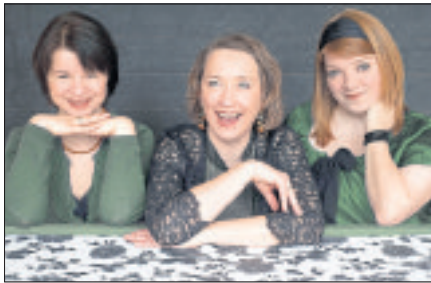
„More Maids“ heißt das Trio, das jetzt zu Gast in Soltau ist. Die „First Ladies of Irish Folk“ geben am 27. August ab 20 Uhr ein Konzert im Garten des Heimatmuseums der Böhmestadt.