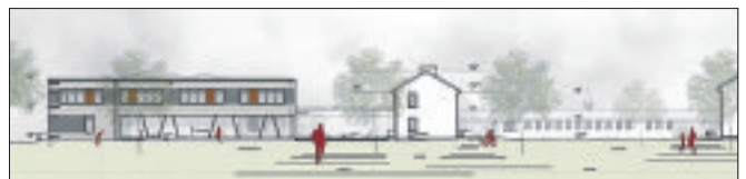
Neu- und Altbau sollen sich auf dem Schulgelände in Brelöh ergänzen.