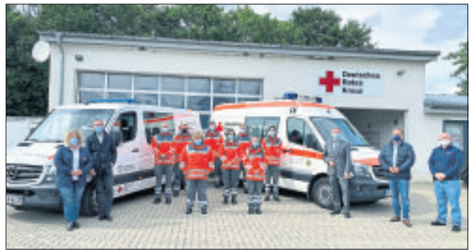
Hiesige DRK-Kräfte rückten aus ins Hochwasser-Gebiet in Rheinland-Pfalz.

DRK-Kräfte aus Heidekreis im Einsatz in Rheinland-Pfalz