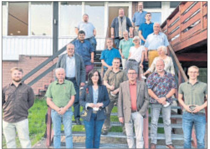
Die FDP Heidekreis stellte jetzt ihre Kandidaten der Kreislisten vor.