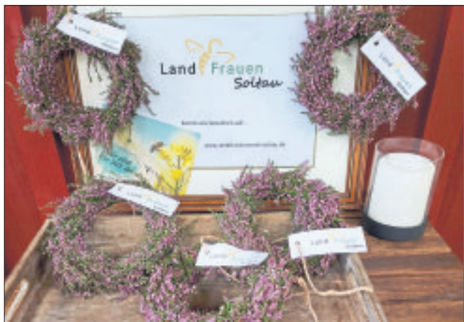
Die Landfrauen Soltau ergänzen das Angebot des „kult-O-maten“ mit traditionell handgebastelten Heidekränzen.