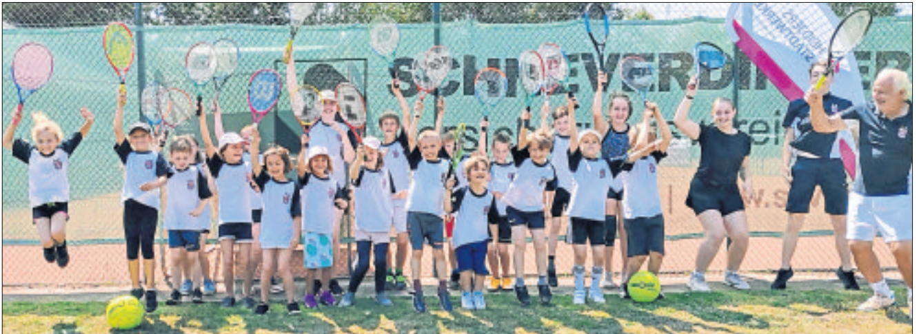
Die jungen Tenniscracks und ihre Trainerinnen und Trainer hatten beim Camp des Sport- und Heimvereins Wesseloh sichtlich Spaß.

Veranstaltung des Sport- und Heimvereins Wesseloh: „Spielerisch Tennis lernen - und neue Freunde finden“