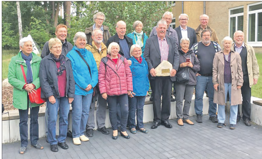
Feierten „Goldenes Abitur“: die „68er“, der Abitursjahrgang des Jahres 1968 des Gymnasiums Soltau.

32 ehemalige Schüler tauschen Erinnerungen aus