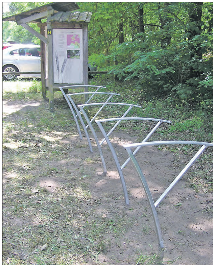
Das abgeschlossene Leader-Förderprojekt „Mit Rückenwind im Naturpark Lüneburger Heide“ sorgt für eine Stärkung des naturnahen Tourismus im Kerngebiet des Naturparks - hier mit Fahrradständern am Hof Tütsberg (Foto) und in Wilsede.

Leader-Projekt im Naturpark abgeschlossen