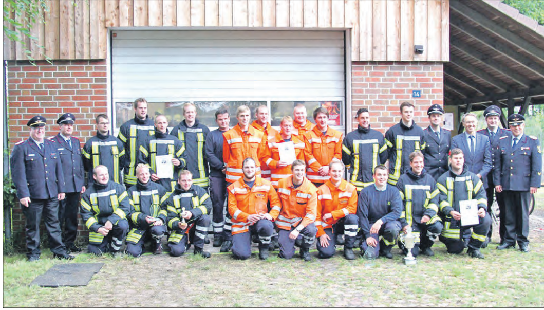
Die Siegerteams: die Gruppen der Feuerwehren aus Altenwahlingen, Südkampen und Kroge (v.li.).

Der Siegerpokal geht in diesem Jahr an die Freiwillige Feuerwehr Südkampen mit einem Zielerreichungsgrad von 99,91 Prozent. Platz zwei erreichte die Feuerwehr Kroge (99,83 Prozent), gefolgt von der Feuerwehr Altenwahlingen (99,82 Prozent). Auf den weiteren Plätzen folgten die Feuerwehren Brochdorf (99,82 Prozent, aber schlechterer Zeittakt), Krelingen (99,79 Prozent) und Hamwiede (99,78 Prozent). Außerdem wurden die besten Teilnehmer in den jeweiligen Einzelmodulen mit Pokalen geehrt. Der Pokal für die beste Maschinistenprüfung ging an die Gruppe Kirchboitzen 1, der Pokal für den besten Kuppelzeittakt an die Gruppe aus Kroge sowie der Pokal für den besten Zeittakt im Löschangriff an die Feuerwehr Altenwahlingen.