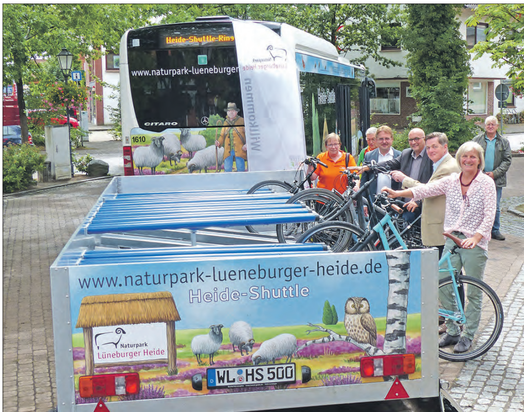
Die kostenlos nutzbaren Heide-Shuttle-Busse rollen wieder. Der neue Niederfluranhänger macht das Auf- und Abladen der Fahrräder deutlich leichter.

Heide-Shuttle startet in die nächste Saison / Auftakt in Salzhausen