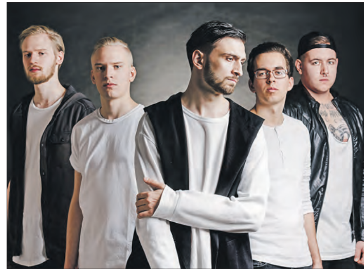
Die Soltauer Metalband „Artemis Rising“ feiert im Band-Center der Böhmestadt ihre „CD-Release-Show“ und hat dafür noch drei weitere Formationen eingeladen, die am 21. Juli ebenfalls auf der Bühne stehen.

„Artemis Rising“ - seit 2013 ist das junge Quintett aufstrebender Musiker auf den Bühnen Deutschlands unterwegs und überzeugt dabei mit einer einzigartigen Kombination aus modernem, energiegeladene Post-Hardcore und einer Neuauflage klassischer Metalcorestrukturen. Auch abseits der Bühne konnte die Band mit ihrer EP „Your Gods Won't Save You Now“ (2014) und den darauffolgenden Soloveröffentlichungen „Broken Faith“, „Mislead“ (beide 2016) und „Unchosen“ (2017) einen nachhaltigen Eindruck hinterlassen. Mit ihrer aktuellen Single „Demons“ leiten sie eine neue Ära ihrer Bandgeschichte ein: Nach mehr als einem Jahr akribischer Detailarbeit erscheint am 20. Juli ihr Debütalbum „Ascension“, das den bisherigen Sound der Band konsequent weiterentwickelt, dabei aber auch stärkere Kontraste setzt. Das gilt sowohl für die zehn Titel des Albums untereinander, als auch für die Dynamik innerhalb der Songs: Es wird ruhiger,