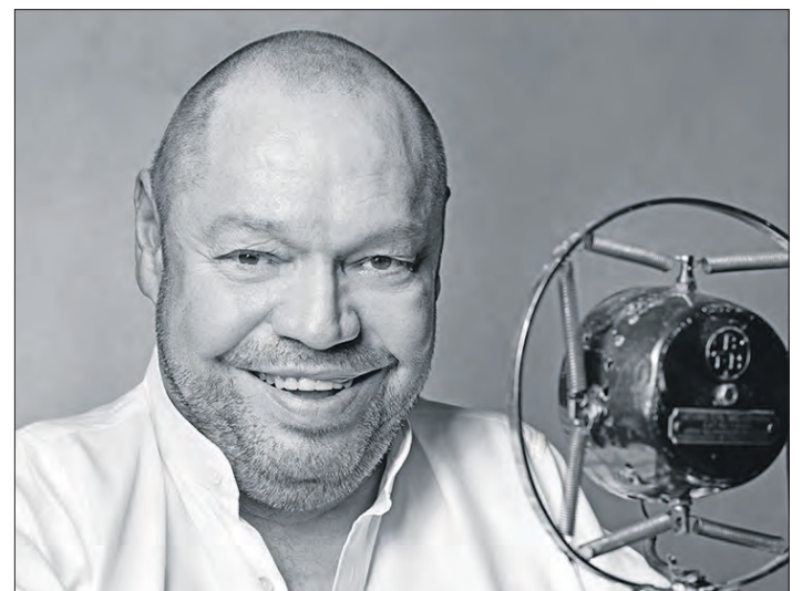
Star-Bariton Thomas Quasthoff steht mit seinem Jazz-Programm auf der Aulabühne des Soltauer Gymnasiums.

Welch hochkarätige Musiker in die Böhme Stadt kommen, hat sich inzwischen herumgesprochen - zahlreiche Tickets sind bereits verkauft. Wer noch einen Platz ergattern möchte, sollte sich also möglichst schnell um eine Eintrittskarte kümmern. Die gibt es im Vorverkauf in den Geschäftsstellen der KSK Soltau, Tel. (05191) 86240, bei der Soltau-Touristik, Tel. (05191) 828284 und unter www.musiktage.de beziehungsweise unter Telefon 0800-4566540.