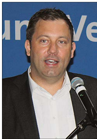
SPD-Generalsekretär Lars Klingbeil ist beim Picknick im Soltauer Böhme-Park dabei.

Veranstaltung am Sonntag im Soltauer BöhmePark