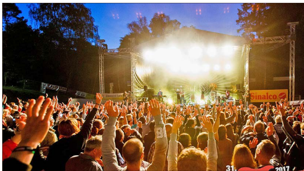
„Hände Hoch“: Das „HöpenAir“ ist bekannt als Festival für die ganze Familie.

Die Gruppe hat ihre sehenswerten Shows in den vergangenen Jahren vor zehntausend Fans präsentiert, unter anderem gleich dreimal auf dem