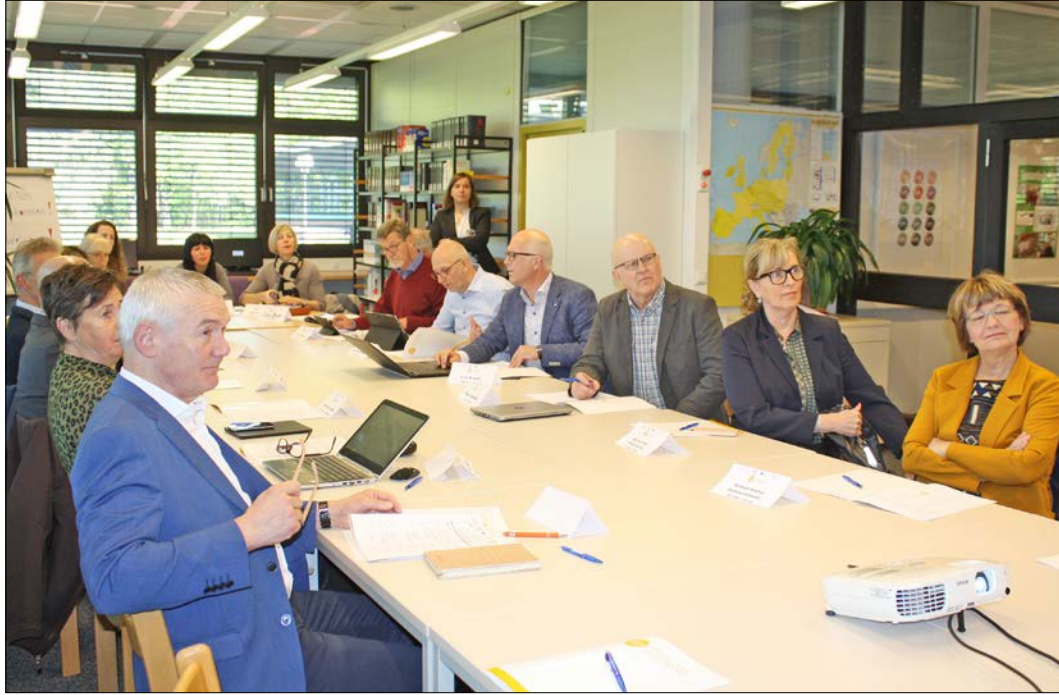
17 Lehrkräfte aus Belgien, Finnland, den Niederlanden, Portugal, Italien und Island waren jetzt bei den BBS Soltau zu Gast.

Projekttreffen an den Berufsbildenden Schulen Soltau