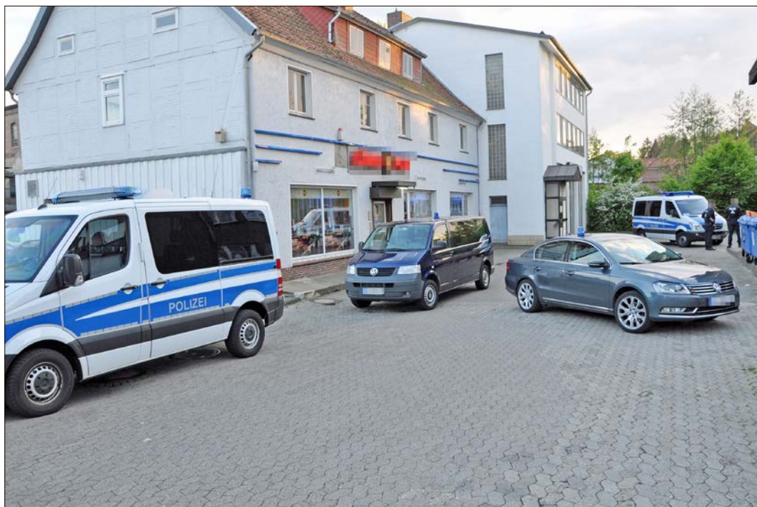
Insgesamt acht Objekte in der Soltauer Innenstadt wurden vom „Räderwerk“ kontrolliert.

Am 9. Mai nun hat das „Räderwerk“ seine erste gemeinsame Aktion umgesetzt. Nach einer vorgeschalteten Besprechung machten