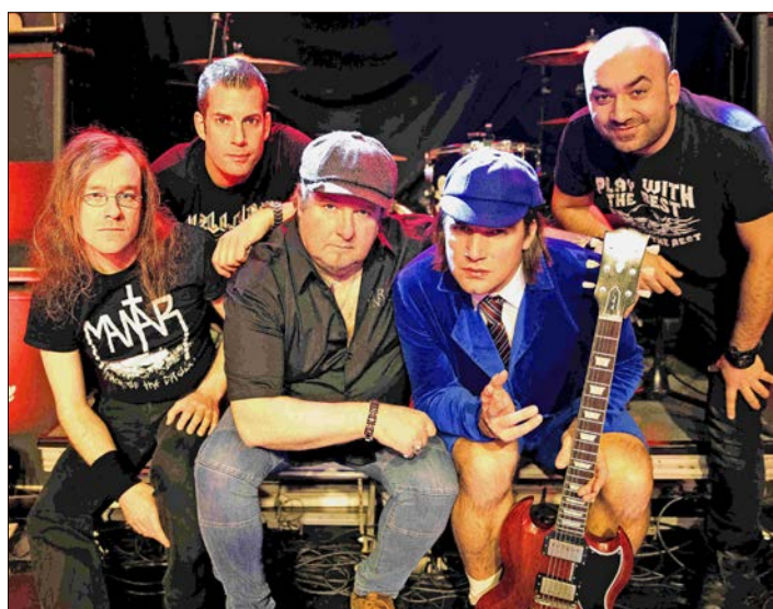
Präsentiert im Schneverdingen Höpen eine AD/DC-Show mit allem Drum und Dran: die Coverband „Hellfire“.

„Eine lebenswerte Umwelt kann wirklich Unterstützung durch mehr Mitgliedschaften im NABU gebrauchen“, betont die Pressesprecherin noch einmal und hofft, daß das Werbetaam auf viele offene Ohren trifft bei seinen Hausbesuchen.