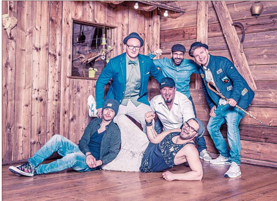
Die Band „Qunstwerk“ (Foto) sowie andere Gruppen und Musiker stehen am 18. Mai beim „Mai City Festival“ in Faßberg auf der Bühne.

Sieben Bands am 18. Mai in Faßberg auf der Bühne