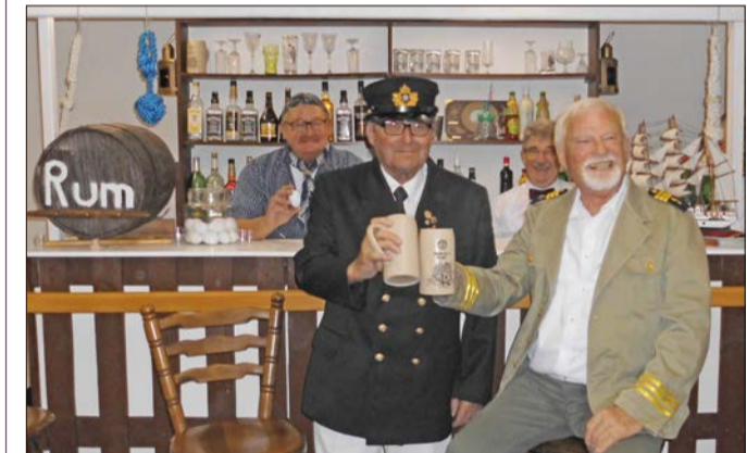
Am 19. und 20. Oktober heißt der Shantychor die Gäste „Willkommen in der Haifischbar“. Der Heide-Kurier verlost für die maritime Revue dreimal zwei Freikarten für die Sonntagsvorstellung.

Shantychor: „Willkommen in der Haifischbar“