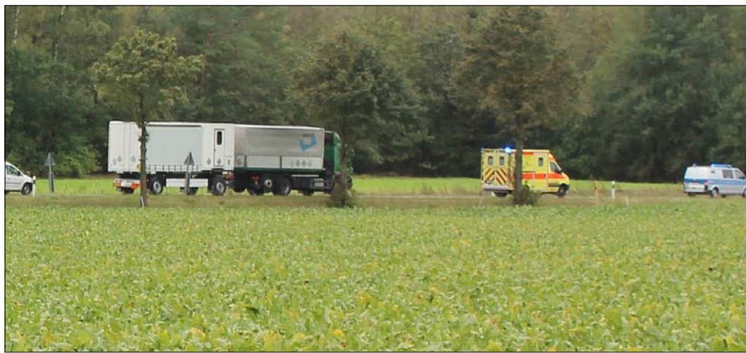
Per Gefahrguttransport wurde der Munitionsfund zur GEKA gebracht.

Dethlinger Teich: Noch keine Kampfstoffe nachgewiesen