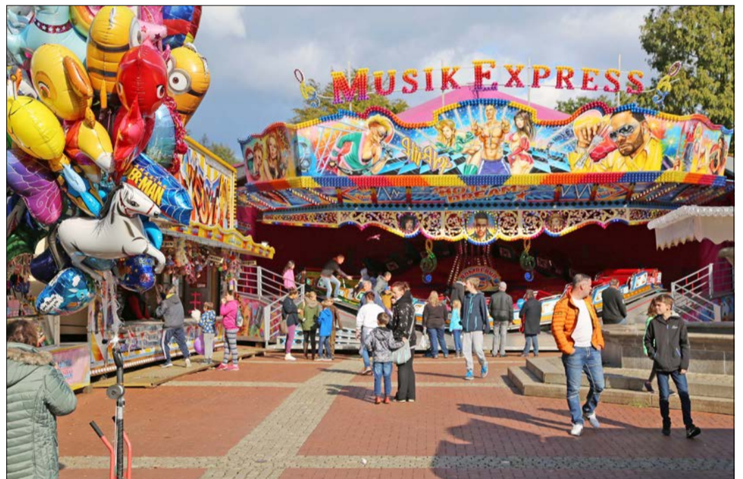
Zum großen Teil sonniges Wetter lockte die Besucher auf den Herbstmarkt in Munsters Innenstadt.