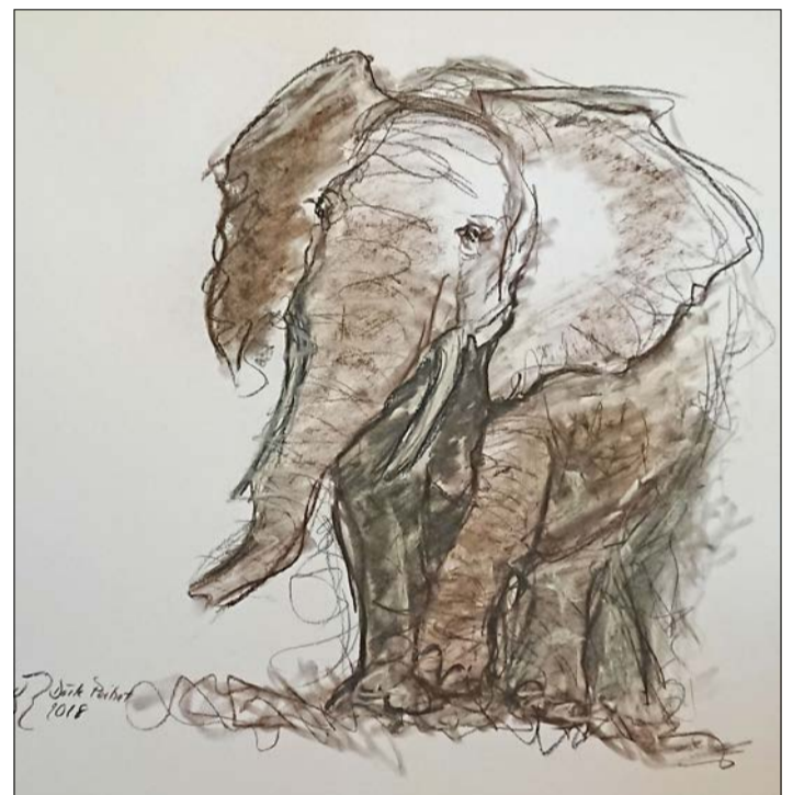
Die Dickhäuter stehen im Mittelpunkt der Ausstellung.