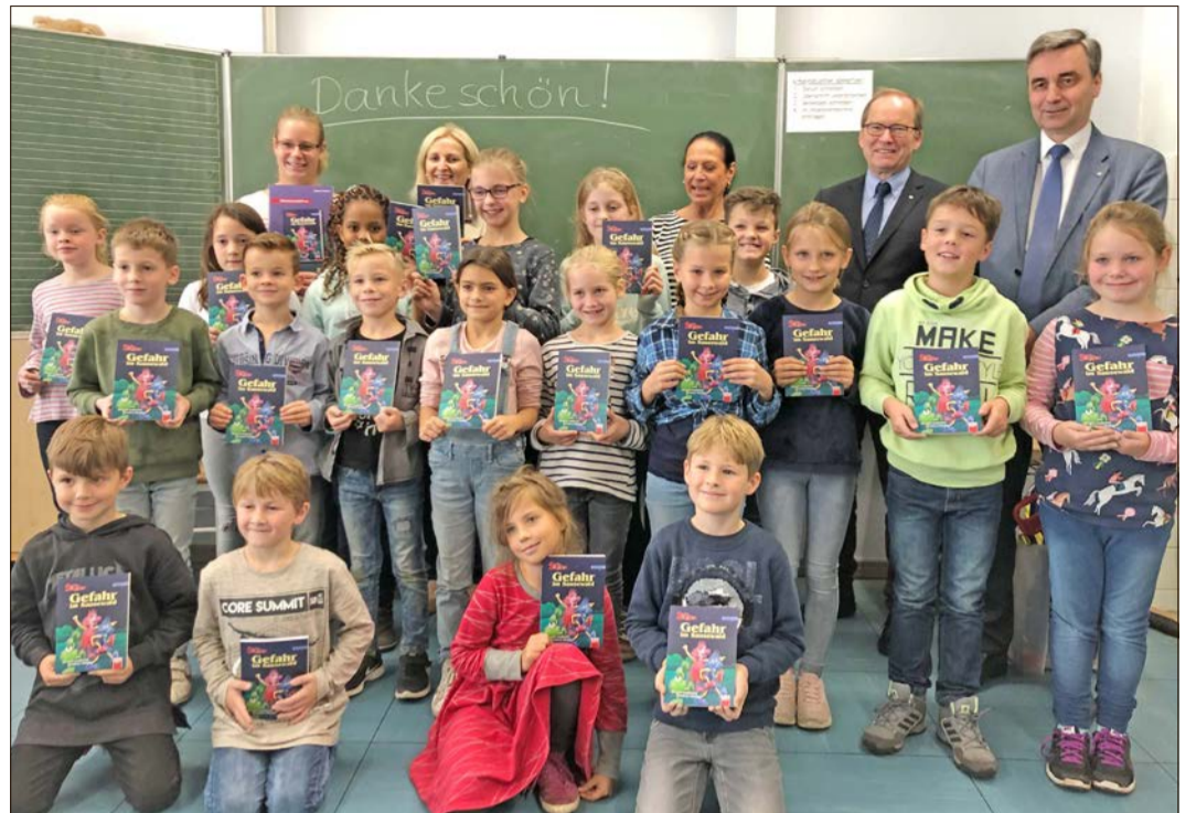
Am letzten Schultag vor den Herbstferien nahmen die dritten Klassen der Schneverdinger Grundschule am Osterwald ihre neue Lektüren entgegen.