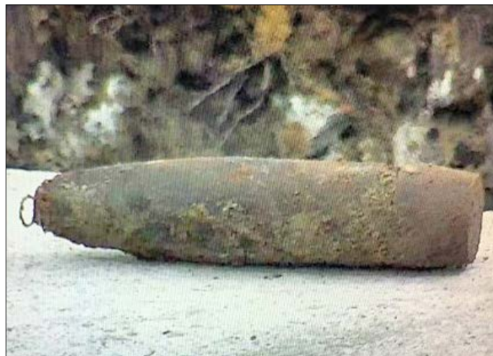
Erster Munitionsfund im Dethlinger Teich.

Mit dem Aushub haben die Experten unter strengen Sicherheitsmaßnahmen am 27. September begonnen. Da sich das Team zunächst mit Hilfe eines Greifarmbaggers durch die „Oberfläche“ hindurcharbeiten und dieses Material dann überprüfen musste (HK berichtete), rechneten die Fachleute mit einem Munitionsfund nicht vor dem 14. Oktober. Jetzt sind die Experten doch schneller als erwartet auf „erste Ergebnisse“ gestoßen.