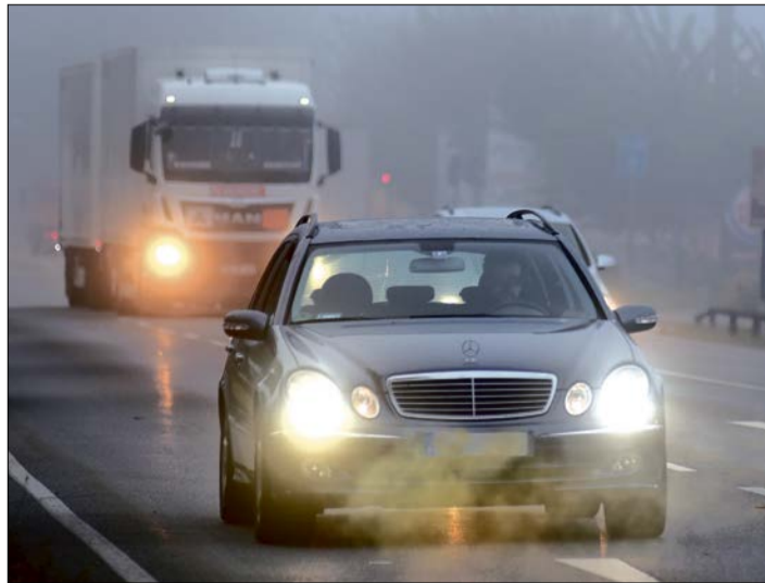
Eine Verkehrsregel, die bei Nebel viel zu wenig beachtet wird: Bei Sichtweiten unter 50 Metern gilt Tempo 50.

Beim Eingewöhnen in den mobilen Herbst sollten sich Autofahrer die damit verbundenen Gefahren vergegenwärtigen. Neben Nebel und erstem Frost droht auf Land- und Dorfstraßen zusätzlich Glätte durch Laub oder Schmutz von den Erntefahrzeugen.