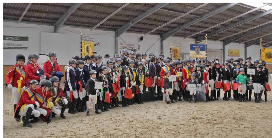
Alle teilnehmenden Mannschaften der Bezirksmeisterschaften im Drei- und Vierkampf in Schlieckau nach der Siegerehrung in der Reithalle.

Alle Ergebnisse sind im Internet unter www.bezirkspferdesportverband-l-h.de zu finden.