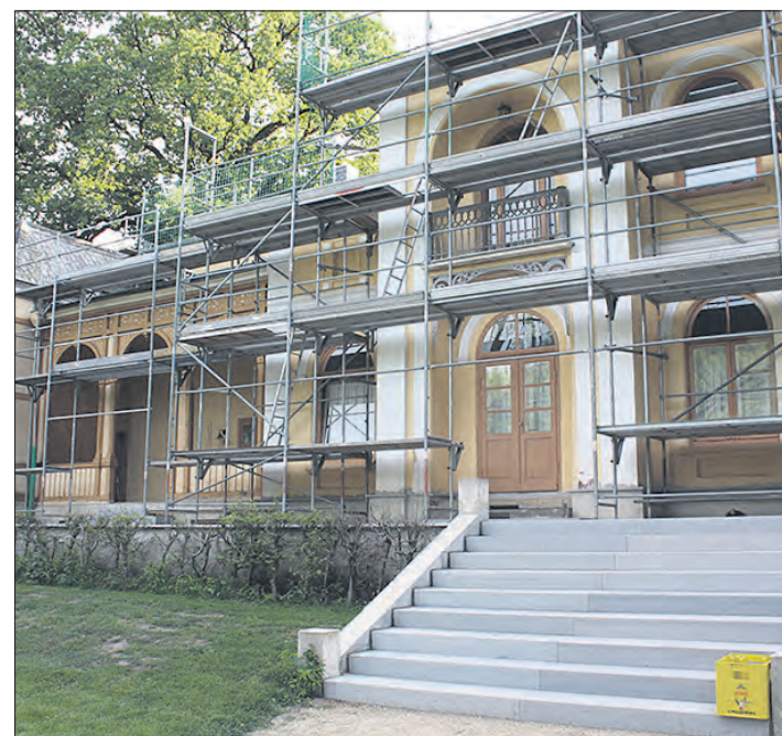
Es gibt noch viel zu tun, bis die Villa in Breidings Garten wieder in altem Glanz erstrahlen kann. Derzeit ist sie für Dach- und Fassadenarbeiten eingerüstet.

Gäste von außen zugänglich sein soll. Bis das alles umgesetzt ist, wird also noch einige Zeit vergehen, in der nicht nur weitere Ausdauer gefragt, sondern auch weitere Spenden willkommen sein dürften.