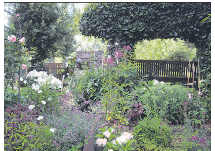
„Über Zäune schauen“: Viele Gärten öffnen sich wieder für Besucher.