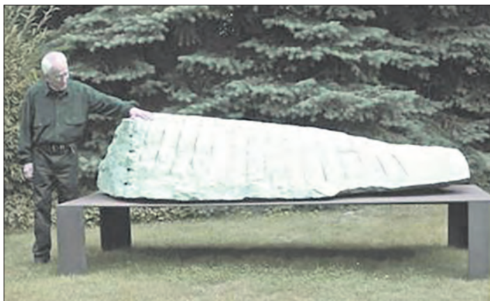
Skulpturen des Künstlers HAWOLI sind erstmals in Breidings Garten in Soltau zu sehen.

stein und Stahl, bestimmen sein Werk; etliche davon sind im öffentlichen Raum zu finden. Arbeiten HAWOLIs gehören zum Kunst-Landschaft-Projekt des Springhornhofs Neuenkirchen, und drei sind auch im Soltauer Stadtbild zu finden. „Die Themen zu meinen bildhauerischen und fotografischen Arbeiten entwickeln sich meist durch Beobachtungen und Erfahrungen aus erlebten Situationen“, erläutert HAWOLI seine Werke. Die Begrüßung zur Vernissage am 26. Mai übernimmt Horst Geissler für den Verein und die Stiftung Breidings Garten. Landrat Manfred Ostermann spricht ein Grußwort, die offizielle Eröffnung übernimmt der hiesige Bundestagsabgeordnete Lars Klingbeil. Der Literaturwissenschaftler Dr. Mario Fuhse führt in die Ausstellung ein. Die Kunstwerke sind bis zum 30. September in Breidings Garten zu sehen, der Garten ist täglich geöffnet. Zur Ausstellung erscheint ein Katalog.