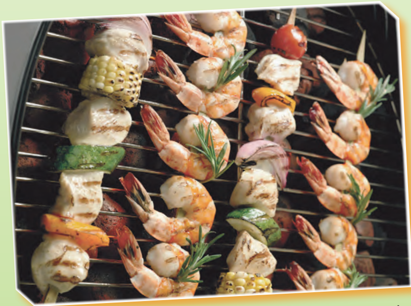
(pb) Grillen „International“ sorgt für Abwechslung und Gaumenfreuden.

Doch die Möglichkeiten beim Barbecue gehen über die Zubereitung von Hamburgern weit hinaus, gelten die USA doch als Ursprungsland des Grillens. Südstaaten-Charme bekommt das Barbecue mit Spareribs in würziger Soße. Beim Grillen der Spareribs wird niedrige Temperatur benötigt, damit das Fleisch schön zart bleibt. Typisch für Kalifornien oder Florida sind Meeresfrüchte auf dem Rost - zum Beispiel lecker mariniert mit Olivenöl, Zitrone, braunem Zucker und etwas Ingwer.