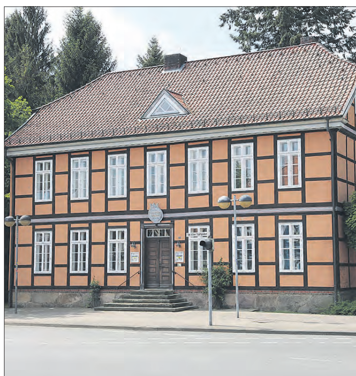
„Die Geschichte Israels und jüdisches Leben in Soltau“ ist noch bis zum 27. Mai im Soltauer Museum zu sehen.

Ausstellung läuft noch bis zum 27. Mai weiter