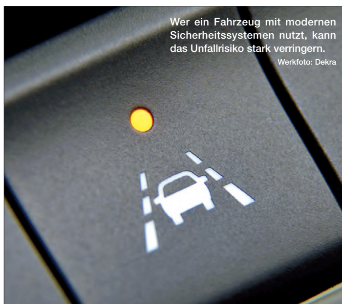
Wer ein Fahrzeug mit modernen Sicherheitssystemen nutzt, kann das Unfallrisiko stark verringern.

Unfallforscher rechnen mit jährlich 5.000 Verkehrstoten weniger in der EU, nachdem im Jahr 2014 elektronische Fahrdynamikregelsysteme, wie etwa ESP, für alle Fahrzeuge sowie Notbrems- und Spurhaltewarnsysteme für Lkw und Busse verpflichtend eingeführt wurden.