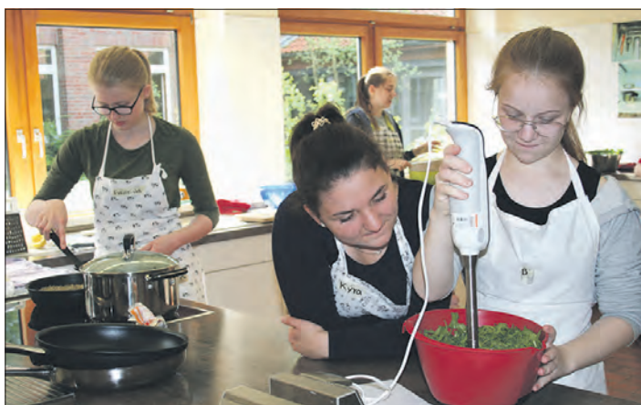
Die Schülerinnen und Schüler der KGS stellten fest, „daß klimafreundliche Ernährung auch schmeckt“.