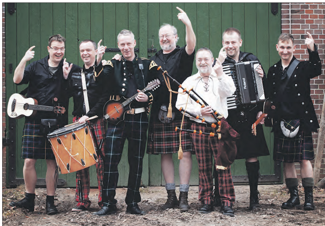
„The Keltics“ spielen am 26. Mai im Jugendbereich der Schneverdinger FZB.

Irish-Folk-Rock live / Vorverkauf hat bereits begonnen