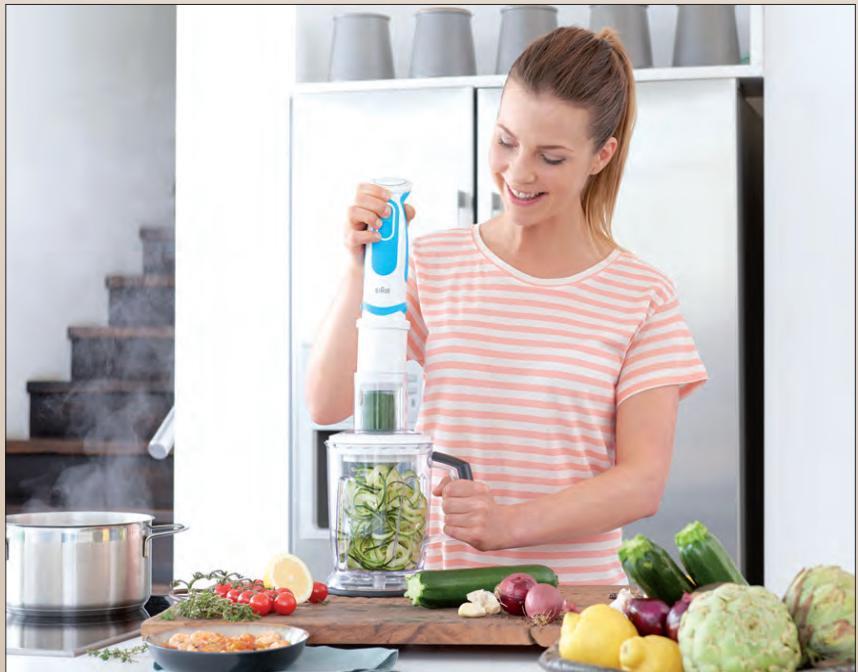
Selbst harte Zutaten wie Karotten lassen sich einfach zu gesunden Gemüsenudeln verarbeiten.

Das neue Multitalent ist Stabmixer und Spiralschneider und verwandelt mit drei verschiedenen Schneideeinheiten Karotten, Rote Bete & Co. im Handumdrehen in gesunde Linguine, Pappardelle oder Tagliatelle. Mit dem bereits im Set enthaltenen, praktischen Zubehör ist der Küchenhelfer darüber hinaus vielseitig einsetzbar - von der Zubereitung des Frühstückssmoothies über das gesunde Mittagsmenü bis hin zur leichten Suppe am Abend.