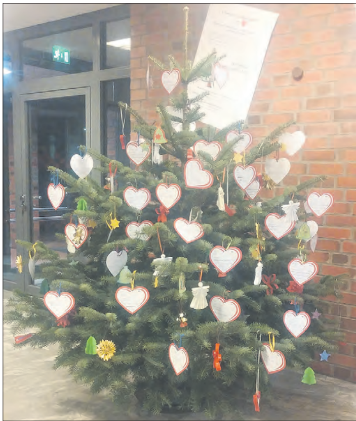
Herzen mit den Wünschen von Kindern und Jugendlichen warten am Schneverdinger Wunschbaum auf Menschen, die diese erfüllen.

Weitere Informationen erhalten Interessierte im Mehrgenerationenhaus Schneverdingen, Ruf (05193) 9769889 oder E-Mail info@mgh-schneverdingen.de.