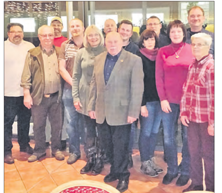
Teilnehmer der ersten Sitzung des erweiterten Arbeitskreises der Bürgerinitiative „Gerechtigkeit & Transparenz für den Straßen- und Wegebau in Faßberg“.

werden mehr als 500 gültige Unterschriften von Bürgern benötigt, die ihren Erstwohnsitz seit mindestens drei Monaten in der Gemeinde Faßberg haben und mindestens 16 Jahre alt sind.