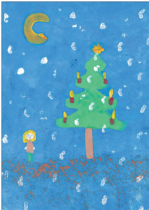
Sabine wünscht sich einen Weihnachtsbaum.

markt und darf sich etwas aussuchen. Am Ende schaut sie den Christbaum an und wünscht sich einen solchen für ihr Zuhause. Die Kinder begleiten die einzelnen Strophen mit Musikinstrumenten. Vorher und nachher singen sie ihren Zuhörern noch ein Lied.