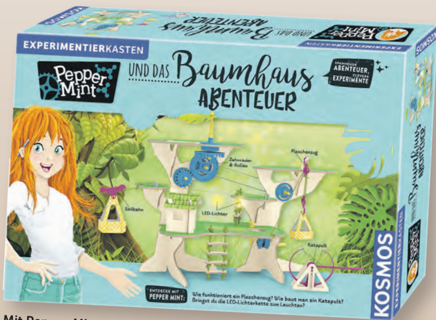
Mit Pepper Mint forschen und experimentieren.

Die neue Experimentierkasten-Reihe „Pepper Mint“ verpackt Naturwissenschaften in spannende