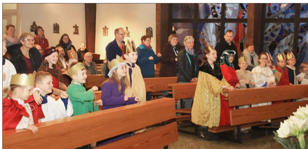
Das „Miterleben“ der beschwerlichen Reise der Könige im Aussendungsgottesdienst war für die kleinen Majestäten und Sterne schon eindrucksvoll, dann ging es in fünf Gruppen los.

Hermannsburger Sternsinger besuchen über 70 Häuser