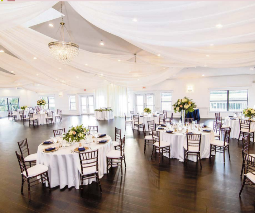
Hochzeitsplaner kümmern sich um den reibungslosen Ablauf der Feier und halten Brautpaaren so den Rücken frei.