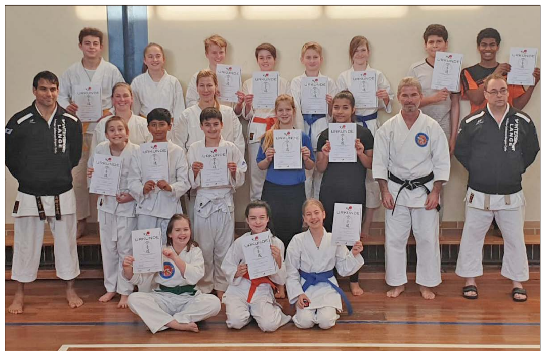
Die erfolgreichen Schneverdingen Karateka mit ihren Trainern und Prüfern.