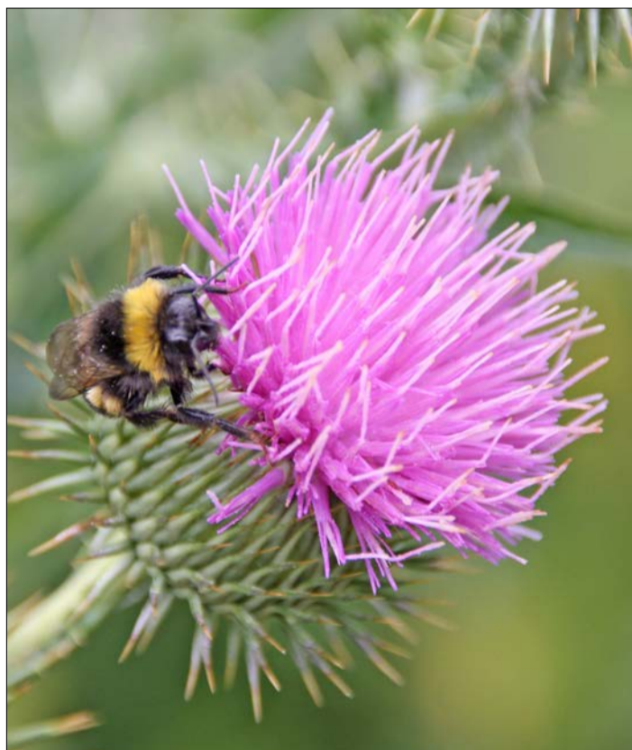
Disteln sind bei Hummeln sehr beliebt.

„Wir wünschen uns, dass Schneverdingen als Bündnismitglied der Kommunen für biologische Vielfalt noch stärker sichtbar und Vorbild für andere wird“, so die BUND-Ortsgruppe. Für Fragen und Anregungen ist sie erreichbar unter bund.schneverdingen@bund.net.