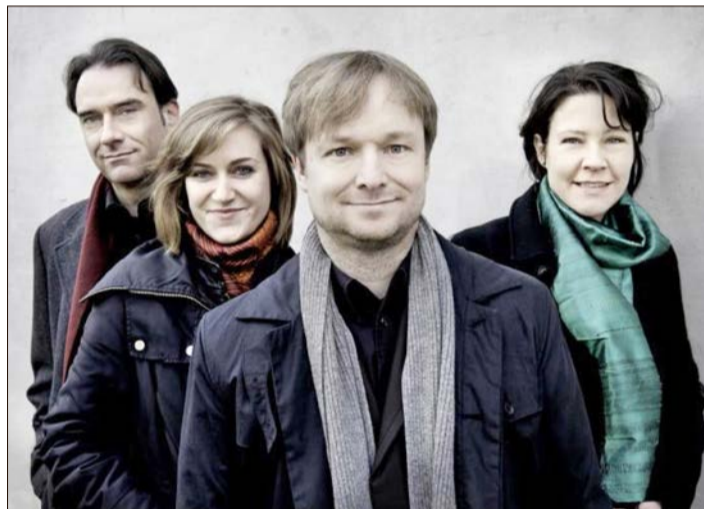
Musiziert am 16. Januar in der Soltauer Bibliothek Waldmühle: das Diogenes-Quartett.

SOLTAU. Im Rahmen der Konzertreihe „Soltauer Kammermusiken“ ist am 16. Januar um 20 Uhr das bekannte Diogenes-Quartett in der Soltauer Bibliothek Waldmühle zu Gast. Das 1998 gegründete Ensemble gehört seit mehr als 20 Jahren zu den international gefragten Streichquartetten. Bei Festspielen wie dem Mozartfest Würzburg oder dem Festival de Radio France et Montpellier ist das Diogenes-Quartett ebenso zu hören wie bei regelmäßigen Tourneen ins nähere und fernere Ausland. Das Ensemble weist eine beeindruckende und umfangreiche Diskogra-