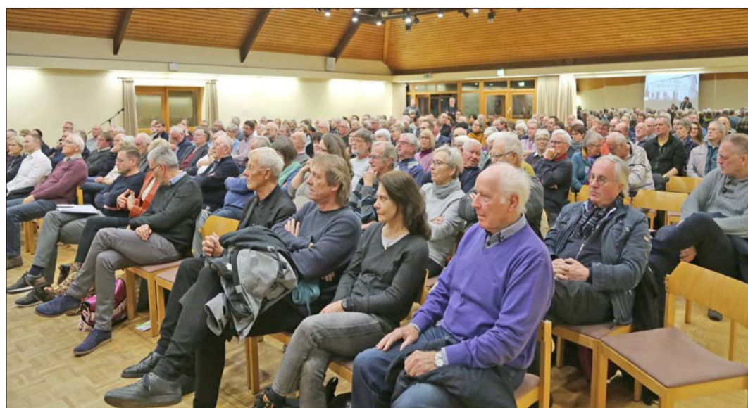
Fast 200 interessierte Gäste füllten den Bürgersaal der Freizeitbegegnungsstätte.

zentrums auf die Straße getreten. Eine 30jährige Pkw-Fahrerin erfasste den 83jährigen frontal mit ihrem Auto. Der Schwerverletzte wurde mit einem Rettungswagen in ein Krankenhaus gebracht. Die 30jährige erlitt laut Polizeibericht einen Schock. Die B 71 musste kurzfristig gesperrt werden.