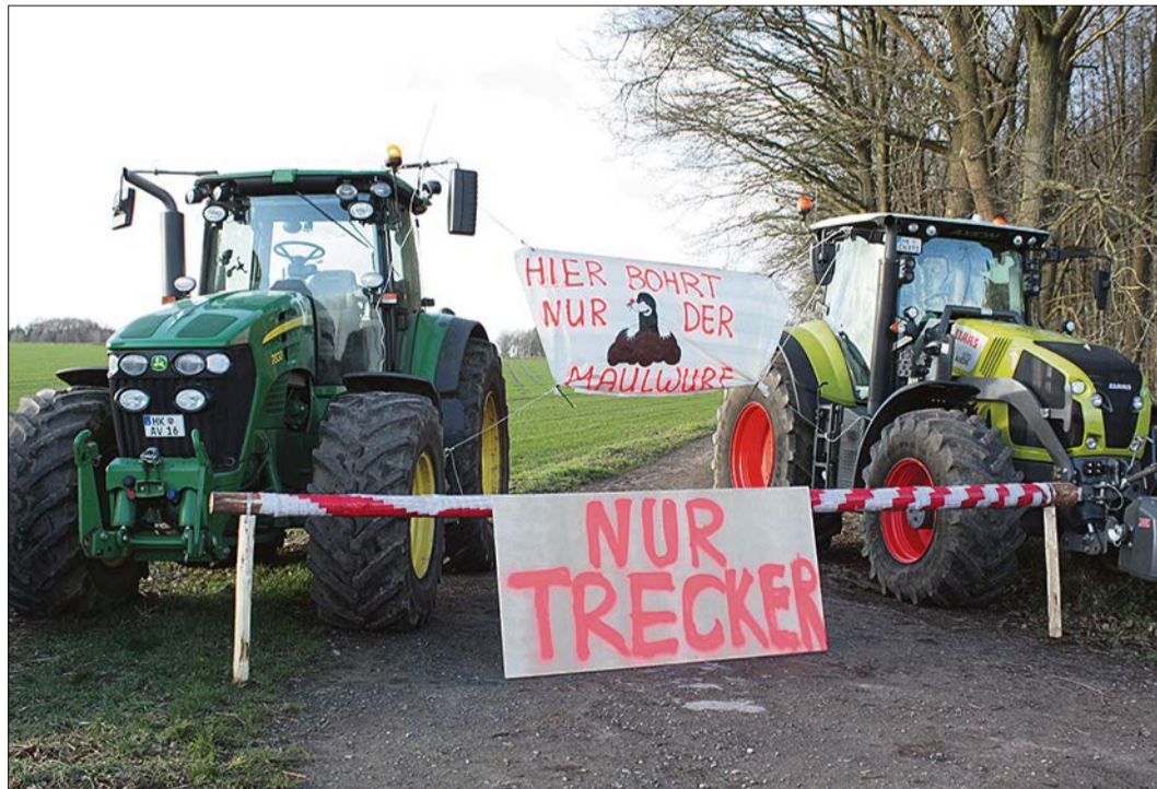
Zur Podiumsdiskussion lädt das „Aktionsbündnis gegen Gasbohren Bad Fallingbostal“ am Mittwoch, dem 22. Januar, ein, denn die Förderung von Erdgas sorgt für Protest, so wie hier in Dorfmark.

„Aktionsbündnis gegen Gasbohren“ lädt zur Diskussion