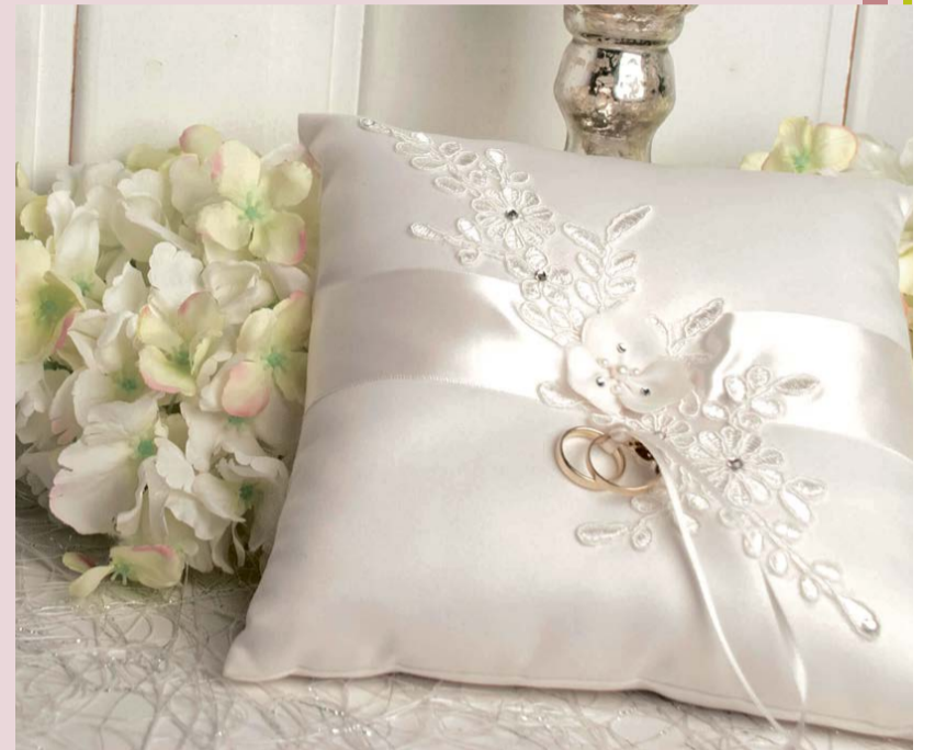
Symbol für die Verbindung zweier Menschen.

Das Warm-up für eine Hochzeit ist der Polterabend. Freunde und Familie treffen sich vor der gemeinsamen Wohnung des zukünftigen Ehepaares oder vor dem Haus derer Eltern und zerschmettern vorzugsweise Porzellan oder Töpfergut. Die Tradition des Polterabends beruht auf der volkstümlichen Auffassung „Scherben bringen Glück“. Ursprünglich fand der Polterabend direkt am Tag vor einer kirchlichen Trauung statt. Gefeierte wurde bis Mitternacht als Schwellenritual für den Übergang vom Junggesellendasein in das Eheleben. Heutzutage poltern auch Paare, die nicht kirchlich heiraten. Viele ziehen es jedoch vor, den Polterabend ein paar Wochen vor der Hochzeit zu veranstalten, damit man am großen Tag fit ist.