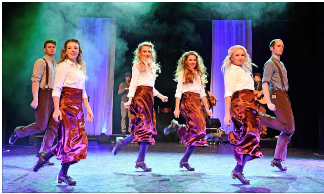
„Celtic Rythms direct from Ireland“ heißt die Show, die eine virtuose Synthese aus Tap Dance und Irish Folk Music verspricht.

„Celtic Rythms“: Synthese aus Tap Dance und Irish Folk