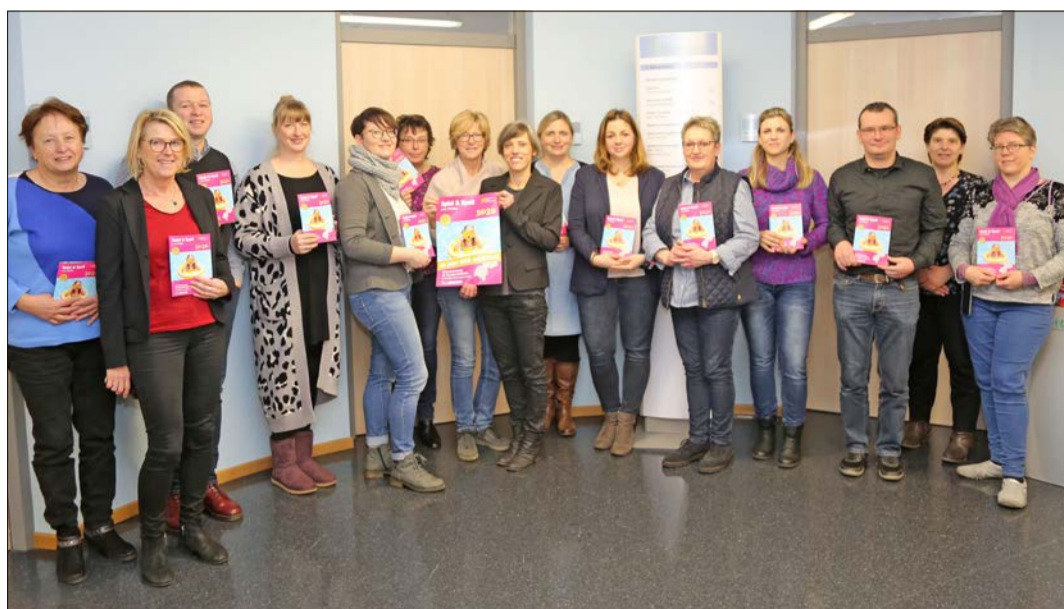
Zahlreiche Kooperationspartner haben sich am vergangenen Donnerstag zur Vorstellung der aktuellen Broschüre „Spiel & Spaß in den Ferien“ im Kreishaus in Soltau getroffen.

Insgesamt 70 Betreuungswochen, flächendeckend und verlässlich, stehen in diesem Jahr im Programm, organisiert von Vereinen, Institutionen, Kommunen oder anderen Partnern. Meist vormittags, teilweise auch ganztags, können die Kinder die Angebote in den Oster-, Sommer- und Herbstferien nutzen. „Nur die Weihnachtsferien lassen wir aus“, so die Vertreterin des ÜBV. Überwiegend erhalten die Mädchen und Jungen auch ein Mittagessen. Im Vergleich zum Vorjahr gebe es, meinte