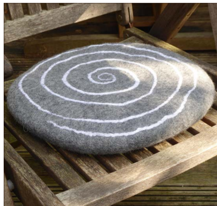
Für Sitzbleiber: Ein handgefertigtes Kissen aus Filz.

Der nächste Filzabend folgt eine Woche später, also am Mittwoch, dem 22. Januar, wieder von 18 bis 21.30 Uhr. Dieser trägt dazu bei, die noch dunkle Jahreszeit stimmungsvoll zu erhellen: Aus einer einfachen