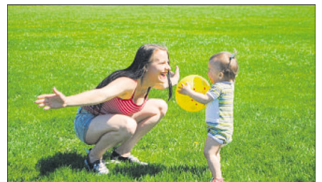
In Soltau startet am 13. Juli das Präventionsprojekt „3F - Fit for Family“.