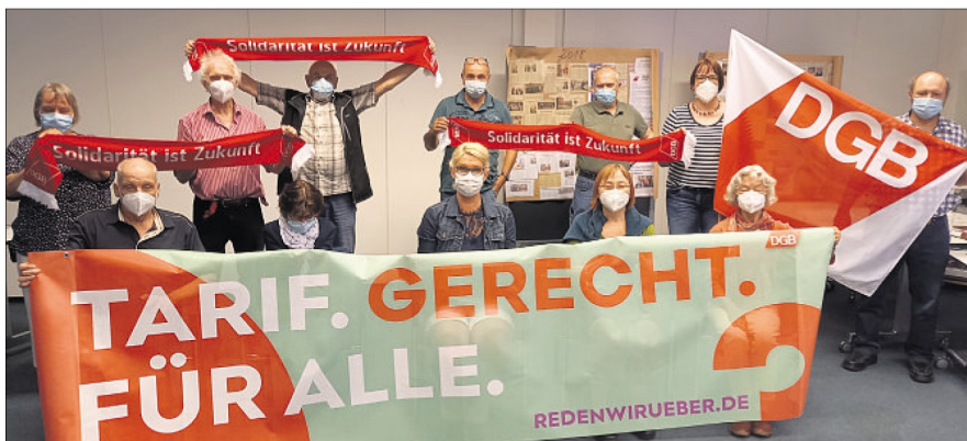
Nach der Delegiertenversammlung: Die neu gewählte DGB-Kreisvorsitzende inmitten von Kolleginnen und Kollegen.

Delegiertenversammlung des DGB: Braun und Gerstel an der Kreisspitze