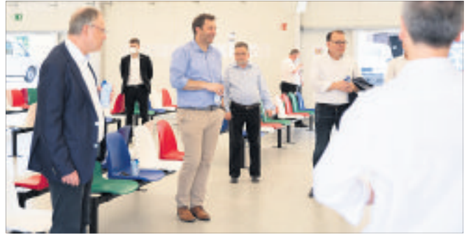
Niedersachsens Ministerpräsident Stephan Weil und Lars Klingbeil (v.li.) besuchten mit weiteren teilnehmerinnen und Teilnehmern auch das Ankunftszentrum Bad Fallingböstel-Oerbbe.