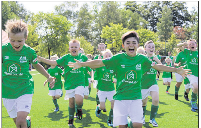
„Starkes Training in Grün-Weiß!“ - unter diesem Motto ist vom 3. bis 5. September der SV Werder Bremen mit seiner Fußballschule im Neuenkirchener Ortsteil Tewel zu Gast.

Egal, ob als Neueinsteiger oder Vereinsspieler - das erfahrene Trainerteam bietet wertvolle Tipps für das Dribbling, Passen, Schießen und Fintieren. Beim Camptraining können Jungen und Mädchen zwischen sechs und 13 Jahren viel erleben und ihre fußballerischen Fähigkeiten verbessern. Ausgerüstet mit aktuellem Outfit (Trikot, Hose und Stutzen der Werder-Fußballschule) und unter Anleitung von lizenzierten Trainern des Traditionsclubs steht dem perfekten Fußballspaß in altersgerechten Trainingsgruppen nichts im Wege. Training, Spiele, Turniere, der Erwerb des Camp-Abzeichens, dazu ein Werder-Quiz - all das sorgt für ein ab-