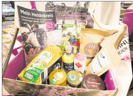
Typische Leckereien aus der Region sind für die Box zusammengestellt worden. Das Geschenk aus der Heide für Heide-Fans enthält außerdem kulturelle Informationen und Präsenten aus dem Landkreis.

Schriftzug. Ergänzt wird die Box durch die Broschüre „Aktiv in der Natur“ mit Rad- und Wandertouren in der Region, das Gastgeberverzeichnis der Erlebniswelt Lüneburger Heide sowie mit Informationen zur „Erlebnis Card“ und zwei Gewinnspielen. Damit ist die Geschenkbox auch ein ideales Geschenk für Neubürger des Heidekreises.