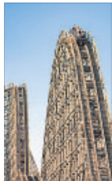
Colossos, Europas höchste und schnellste Holzachterbahn, feiert 20. Geburtstag.

Übrigens verlängert der Heide-Park auch diesen Sommer wieder seine Öffnungszeiten: Vom 24. Juli bis zum 8. August stehen die Tore bis zu 20 Uhr offen.