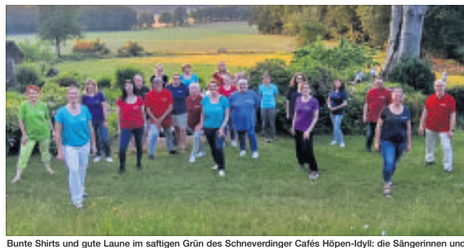
Bunte Shirts und gute Laune im saftigen Grün des Schneverdinger Cafés Höpen-lylly: die Sängerinnen und Sänger des Rock- und Popchores „Rechoir“ in ihren neuen Outfits.

Klangfarben sind die eine Sache, doch seit kurzem bringen die singefreudigen Heidejinnen und Heidejager auch in optischer Hinsicht Farbe