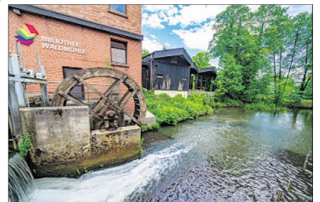
In der Soltauer Bibliothek Waldmühle sind Kinder ab acht Jahren am 14. Juli zum nächsten Medien-Treff eingeladen.

Zwar haben einige wenige Mitglieder den Chor im Lockdown verlassen, jedoch sind alle Verbliebenen zuversichtlich, dass der oder die eine oder andere den Weg in die Gemeinschaft zurückfinden wird. Neue Gesichter sind stets willkommen und zum „Hineinschnuppern“ eingeladen – und zwar jeweils mittwochs um 19.30 Uhr. Seit 7. Juli stehen die Chorproben wieder in der Schützenhalle am Plan. Weitere Informationen erhalten Interessierte unter Telefon (05193) 9664428 oder unter 0173-2521970 sowie über die Internetseite www.lena-tessmann.de .