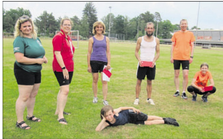
Beim MTV Soltau hat die Sportabzeichensaison begonnen.