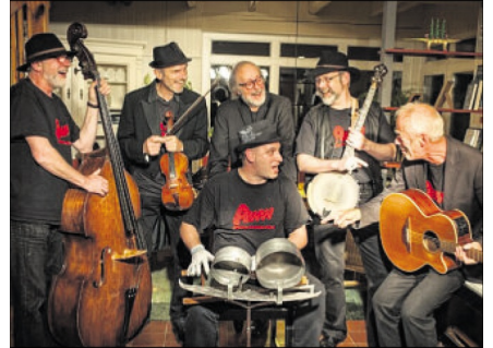
Die Gruppe „Appeltown Washboard Worms“ gibt am 16. Juli ein Konzert im Biergarten am Rathaus.

Das Programm der Band enthält filigrane Bluegrass-Stücke ebenso