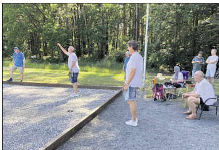
Auf der vereinseigenen Anlage des FVD lieferten sich die Spielerinnen und Spieler spannende Partien.

Auch in der Bezirksliga 3 stand, einen Montag darauf, ein Spiel an. Das erste offizielle Ligaspiel der Boulesparte des FVD führte kurioserweise beide Dittmerner Mannschaften zusammen, die „Erste“ traf auf die „Zweite“. Entsprechend motiviert gingen beide Teams die Partien an. Im Ligamodus werden drei Doublettes (2-2) sowie zwei Triplettes (3-3) gespielt. Von Beginn an entwickelte sich ein spannendes Spiel, bei dem jedes Duell hart umkämpft war. Ständig wechselnde Führungen zeigten die Ausgeglichenheit in allen Partien. Die Doublettes blieben spannend bis zum