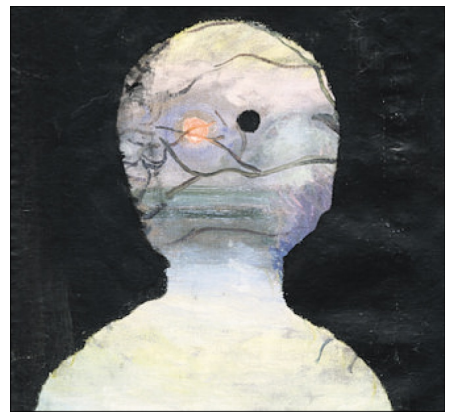
„Claude M.“ von Alexandra Leykauf (2019).

Alexandra Leykauf wurde 1976 in Nürnberg geboren, hat in Nürnberg und Amsterdam studiert und lebt mittlerweile in Berlin. Einzel- und Gruppenausstellungen hatte sie unter anderem in der Villa Du Parc, Annemasse (2015), der GAK, Bremen (2015), der Städtischen Galerie Wolfsburg (2014) im Stedelijk Museum Amsterdam (2014), und bei der III. Moscow Biennale in Moskau (2012). Ihre Werke sind in zahlreichen Sammlungen wie der des Centre Pompidou (Frankreich), des Musée d'Art Moderne de la Ville de Paris