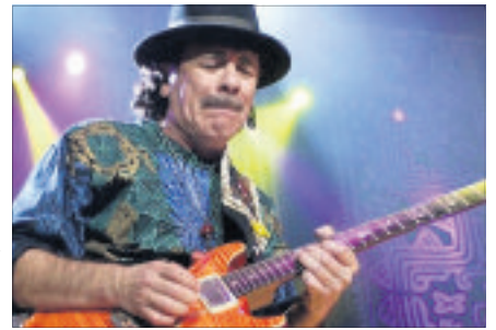
Mexikanisch-amerikanischer Ausnahmsmusiker: Carlos Santana. Um ihn und seine Musik geht es bei den „KultLegenden“ am 17. Juli.

Carlos Santana fasziniert seit seinem spektakulären Auftritt in Woodstock bis heute die Musikwelt. Viele, die ihn und Band „live“ gesehen und gehört haben, möchten die mitrei-