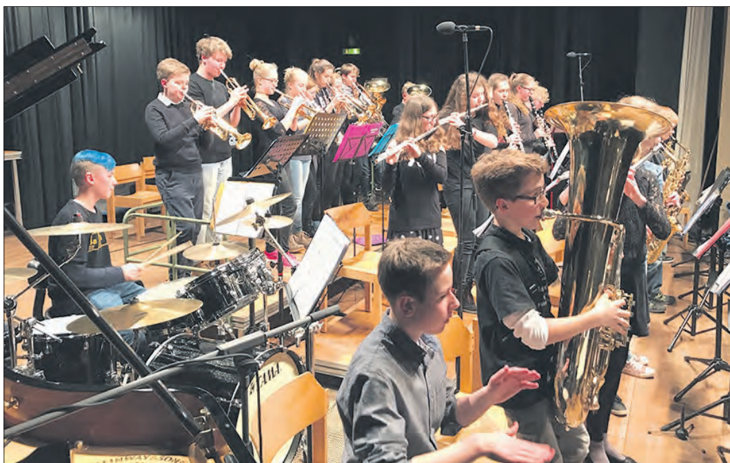
In der Aula des Gymnasiums Soltau geht in diesem Jahr das Big-Band-Festival der Heidekreis-Musikschule über die Bühne.

Heidekreis-Musikschule lädt am 23. Februar ein