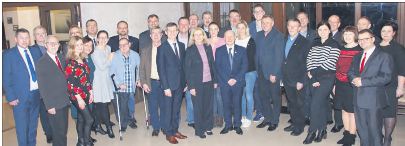
Vertreter der beiden Stadträte im Rahmen der Feierlichkeiten aus Anlaß des 25jährigen Jubiläums der Städtepartnerschaft von Schneverdingen und Barlinek.

Delegation aus Schneverdingen in Barlinek zu Gast