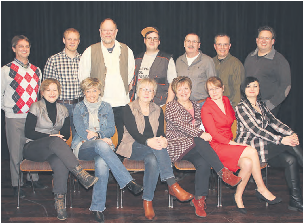
Führt im April in Soltau und Munster die Komödie „Camping, Koks und Hollywood!“ auf: die Theatergruppe „Wundertüte“. Der Kartenvorverkauf beginnt am 21. Februar.

Theatergruppe „Wundertüte“ zeigt Komödie in drei Akten