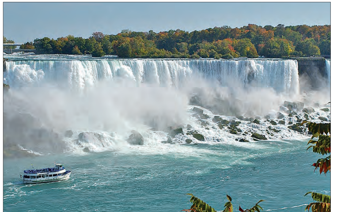
Die Niagara-Fälle sind ein absolutes „Muß“ auf einer Kanada-Reise.

SOLTAU (mwi). Für viele ist eine Tour nach Kanada ein ganz besonderes Erlebnis, wenn sich das Laub der Bäume in einem überwältigenden Spiel der Farben präsentiert. Dieses Erlebnis möchten wir Ihnen, liebe Leserinnen und Leser, auf unserer Heide-Kurier-Leserreise „Indian Summer im Osten Kanadas - Metropolenzauber und atemberaubende Naturwunder“ bieten: Vom 29. September bis zum 9. Oktober 2018 können Sie dabei sein, und das für 2.895 Euro (pro Person im Doppelzimmer), wobei im Reisepreis neben dem Frühstück auch das Abendessen enthalten ist. Buchen können Sie diese Leserreise ausschließlich beim Heide-Kurier, Kirchstraße 4, in 29614 Soltau, Telefon (05191) 98320. Hier gibt es auch weitere Informationen.