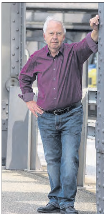
Harald Maack lädt ein zur Lesung in der Eine-Welt-Kirche.

Wer träumt nicht von einer Weltreise auf einem Containerschiff, den vielen Häfen? Als Passagier auf einem Containerschiff hat der Harald Maack in drei Monaten die Welt umrundet - und damit gemeint, sich einen Jugendtraum zu erfüllen. Erlebt hat der dabei die für ihn vorher unvorstellbare, faszinierende Weite und Einsamkeit des Pazifiks, überlebt hat er einen satten Sturm mit bis zu 17 Meter hohen Wellen mitten im Atlantik. Mit diesen und noch vielen weiteren außergewöhnlichen Erlebnissen wurde er belohnt - und der Erkenntnis, daß Träume nicht unbedingt immer in Erfüllung gehen. Besucher der Lesung können sich auf einen spannenden Abend mit dem Schauspieler und Autor freuen. Maack wurde 1955 in der Nähe von Hamburg geboren und wuchs dort in Ramelsloh auf. Seit 1982 ist er Schauspieler und hat zudem in unzähligen Hörspielen als Sprecher mitgewirkt. Aber Lesungen sind seine Passion: Sie