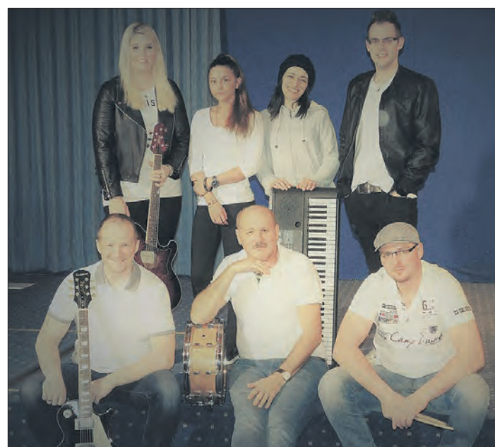
Die „CKs Worship Band“ spielt bei den Lobpreisabenden in der Christuskirche Schneverdingen.

Nähere Informationen zu den Lobpreisabenden gibt es unter der Internetadresse www.christuskirche-schneverdingen.de , mehr Informationen zur Band erhalten Interessierte per E-Mail an worship@christuskirche-schneverdingen.de oder telefonisch unter der Mobilnummer 0160-98080807.