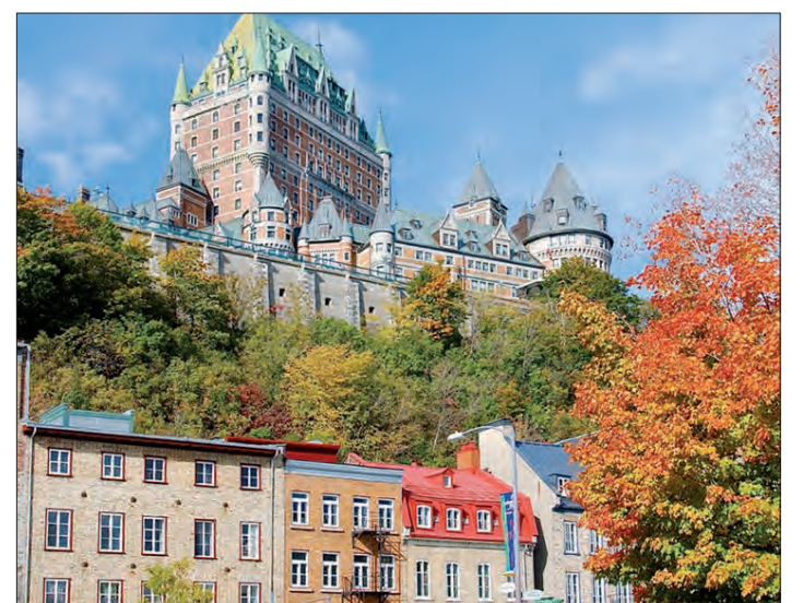
Sehenswert ist das Château Frontenac in Québec City.

dann haben sie darüber hinaus die Möglichkeit, diese beeindruckende Naturgewalt bei einer Bootsfahrt auch von unten hautnah zu erleben. Gegen Mittag dann steuern die Teilnehmer zum Abschied den schönen Ort Niagara-on-the-Lake mit seinen bunten Häusern an, um schließlich wieder nach Toronto aufzubrechen. Von dort aus bringt sie der Jet zunächst nach Frankfurt/Main und dann weiter nach Hamburg. Dort wartet dann schon der Bus, um die Reisenden wieder in die Heide zurückzuchaffieren.