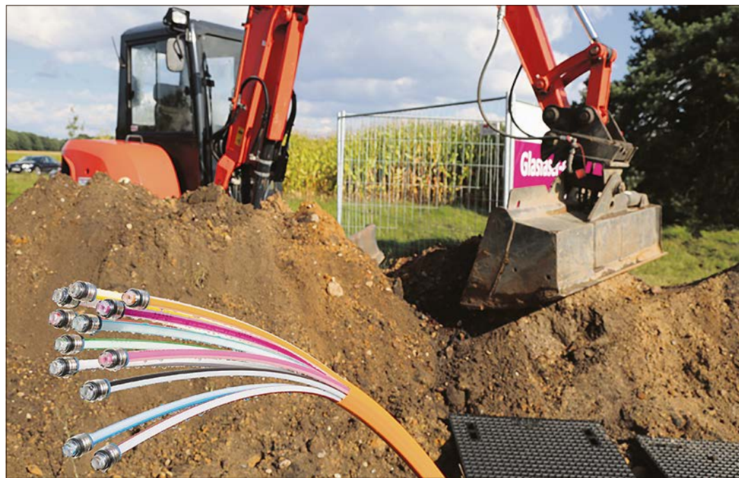
Auch in Schneverdingen wird der Glasfaserausbau vorangetrieben.

Weiter heißt es in der Mitteilung: „Schnelles Internet ist für Unternehmen jeglicher Größenordnung und Branche ein Wettbewerbsfaktor geworden. Die Heidjers Stadtwerke tragen als kommunales Energieversorgungs- und Dienstleistungsunternehmen gezielt zur Attraktivität des Standorts für Gewerbetreibende bei und damit auch zur Stärkung der Wirtschaftskraft in der Region. In diesem Jahr haben die Stadtwerke die Kooperative Gesamtschule Schneverdingen und das Landhotel Schnuck auf deren Eigeninitiative an das Glasfaserinternet angeschlossen und damit zukunftsfähig gemacht.“