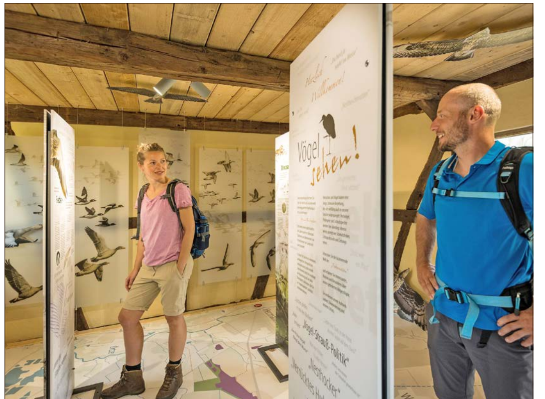
Im historischen Treppenspeicher Lutterloh ist die multimediale Ausstellung „Federwesen - Vogelwelt in der Südheide“ zu finden, zudem gibt es Infos zum Naturpark Südheide.

Auch das Umfeld der Wietzendorfer Kirche wird sich verändern: Mitten im Ort werden Pilger und Pilgerinnen dort in diesem Jahr einen neu gestalteten offenen Kirchhof finden, der barrierefrei ist und mit neu