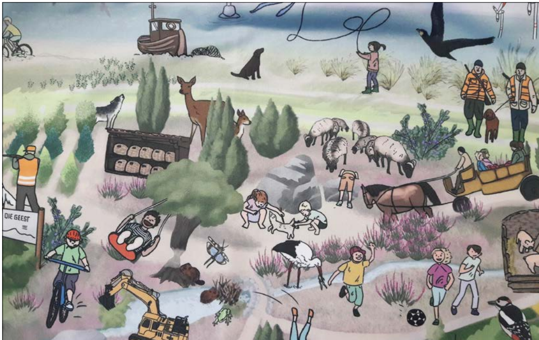
Im Rahmen des Projekts „ErlebnisNATUR – Ist doch Ehrensache!“ werden auch verschiedene Bildungsmaterialien angeboten.

Das Projekt „ErlebnisNATUR – Ist doch Ehrensache“ ist eine Qualifizierungsoffensive der Landesjägerschaft Niedersachsen, des Anglerverbandes Niedersachsen und des Sportfischerverbandes im Landesfischereiverband Weser-Ems in Kooperation mit dem Umweltbildungszentrum Lüneburg. Es wird gefördert durch die Niedersächsische BINGO-Umweltstiftung.