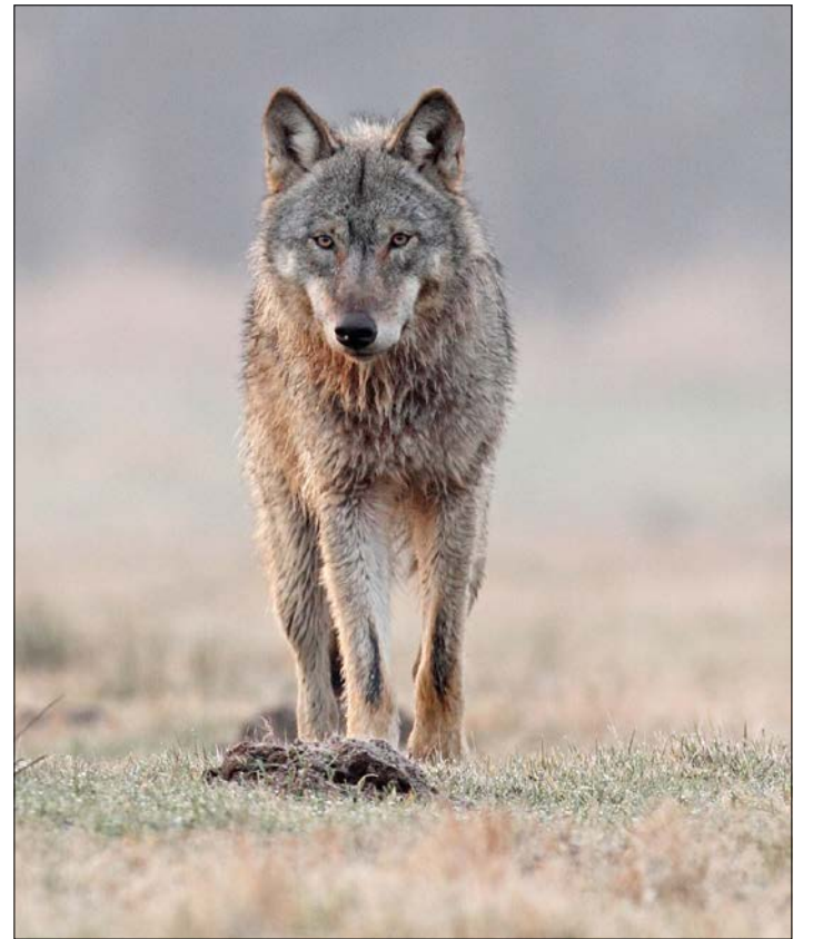
Eine Jungwölfin, fotografiert von Michael Hamann vom Naturschutzbund NABU.

„Wenn politische Entscheidungsträger wie Bundeslandwirtschaftsministerin Julia Klöckner oder Niedersachsens Umweltminister Olaf Lies für eine vorsorgliche Bejagung im Rahmen eines Bestandsmanagements plädieren und ungeachtet der europarechtlichen Vorgaben alles daransetzen, den hohen Schutzstatus des Wolfes aufzuweichen und die Anforderungen an den Herdenschutz zu senken, darf man sich nicht wundern, wenn die Hemmschwelle sinkt