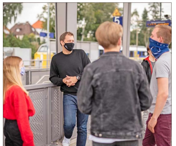
Der Bundestagsabgeordnete Lars Klingbeil im Gespräch mit Jugendlichen und jungen Erwachsenen aus seiner Heimatregion. Das Bild ist vor dem aktuellen Shutdown entstanden.