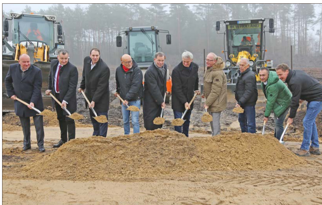
Vertreter von Stadt und Projektpartnern griffen gemeinsam symbolisch zum Spaten.