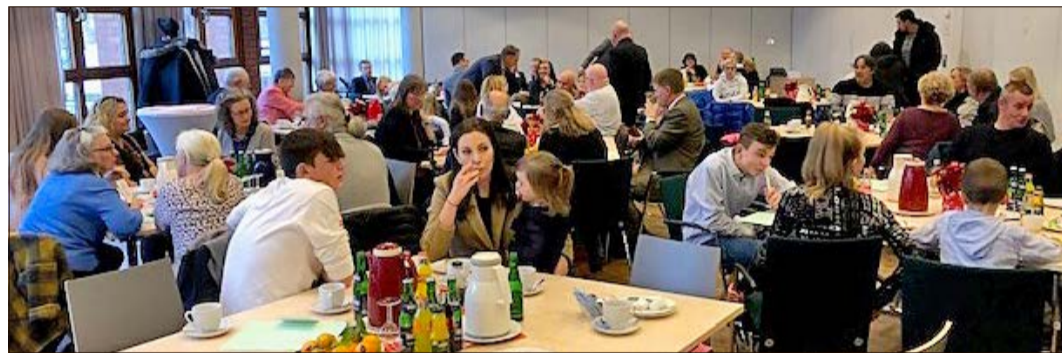
Nach dem offiziellen Teil mit Übergabe der Einbürgerungsurkunden gab es noch ein gemütliches Beisammensein im Kreishaus in Bad Fallingbostal.

Mitglieder beider Familien ein. Auch Pfefferspray wurde bei der Auseinandersetzung benutzt. Bei Eintreffen der Polizei waren die Streitigkeiten bereits beendet und nicht mehr alle Beteiligten vor Ort. Die Verursacherinnen wurden mit leichten Verletzungen in Krankenhäuser gebracht. Die Polizei leitete Ermittlungsverfahren ein.