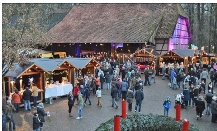
Ein Publikumsmagnet ist der traditionelle Weihnachtsmarkt bei der „Flora Farm“ in Bockhorn.

Im ganzjährig geöffneten „Flora Farm“-Shop gibt es alle Ginsengprodukte zum Sonderpreis. Der Eintritt zum Bockhorner Weihnachtsmarkt ist frei.