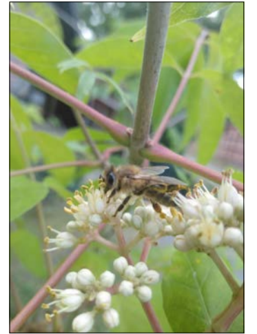
Eine „Einführung in die Imkerei“ bieten die Imkerverein Soltau und Ahlden an.

Der neue Kurs startet mit einer theoretischen Einführung in die Bienenhaltung und Lebensweise eines Bienenvolkes. Der erste Theorietag ist für den Januar vorgesehen und wird etwa acht Stunden dauern. Insgesamt wird sich der Kurs über zwei Theorietage und vier Praxistage bis in den Juni erstrecken. Hierbei soll den Teilnehmern die Imkerei als solches und ihre Bedeutung für die Allgemeinheit näher gebracht werden. Sowohl in den theoretischen als auch in den praktischen Teilen wird die Bienenhaltung und Honiggewinnung