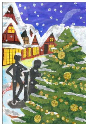
Wieder wird ein Türchen des großen Adventskalenders von Kita-Kindern geöffnet.

Der kleine Tannenbaum ist sehr traurig, da alle seine Brüder zum Weihnachtsfest in die Stadt abgeholt worden sind. Nur er ist übriggeblieben, weil er zu klein ist. Ein Vogel, der auf dem Weg in die Stadt ist, entdeckt durch Zufall den kleinen traurigen Tannenbaum. Der Vogel be-