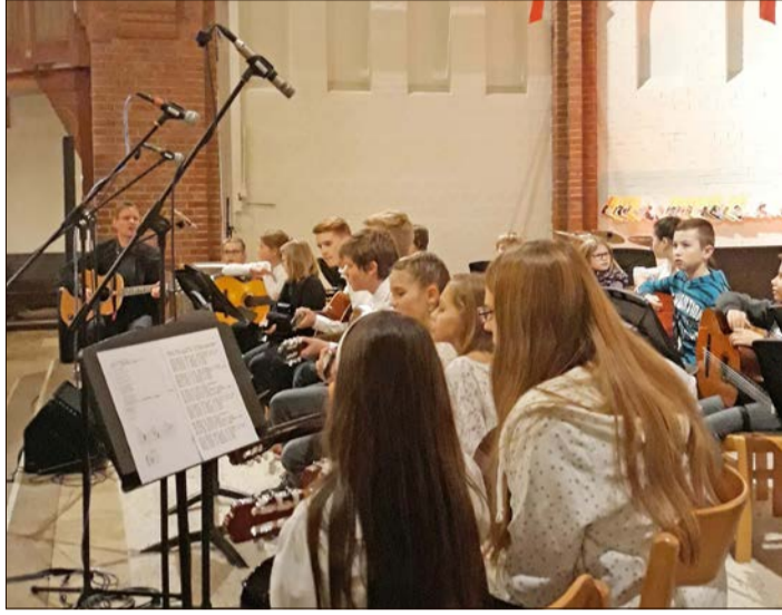
Am Montag, dem 16. Dezember, steht in der Soltauer Lutherkirche das traditionelle Weihnachtskonzert des Soltauer Gymnasiums auf dem Programm.

Gymnasium Soltau lädt in Lutherkirche ein