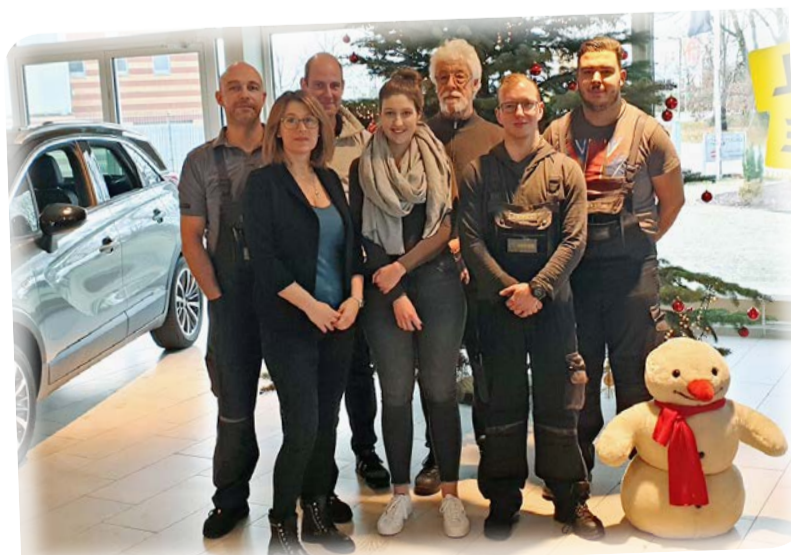
Das Team von Auto-Höhns wünscht allen Kunden ein frohes Weihnachtsfest und einen guten Rutsch ins neue Jahr 2020.