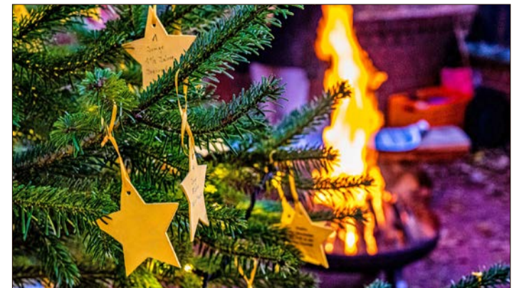
Kinderaugen zum Strahlen zu bringen ist Ziel der Soltauer Wunschbaum-Aktion.