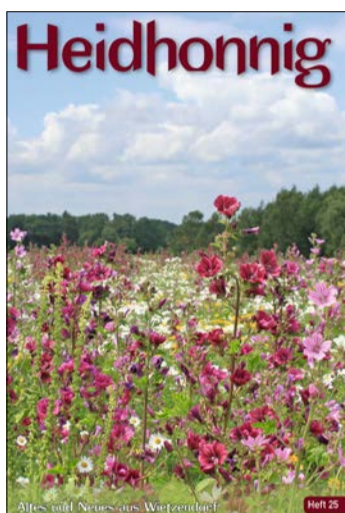
Der neue „Heidhonnig“ ist da.