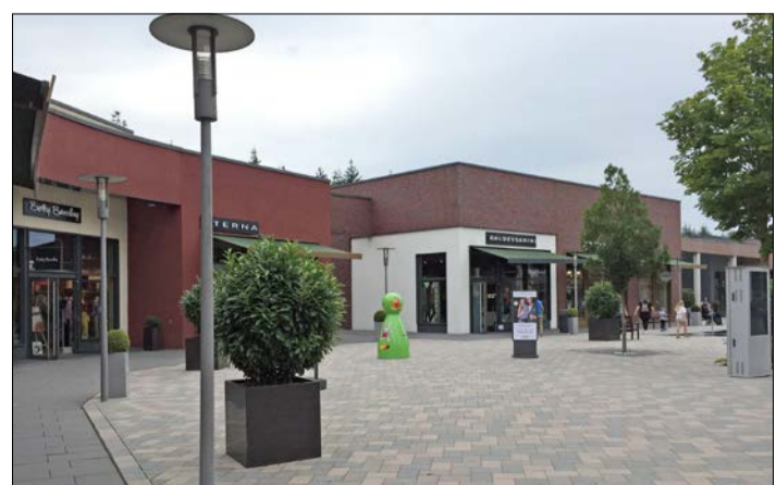
Dies Stadt möchte das DOS erweitern. Dazu wird es zunächst ein Raumordnungsverfahren geben.

Die abschließende Entscheidung über die raumordnerische Zulässigkeit der Erweiterung wird im Rahmen des Zielabweichungsverfahrens getroffen, dessen Abschluss durch das ML derzeit für Januar 2022 vorgesehen ist.