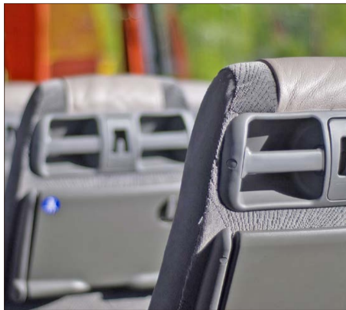
Die Verkehrsgemeinschaft Heidekreis setzt zusätzliche Busse ein.

Ebenso könne es sein, dass die Fahrten wieder eingestellt würden, wenn durch Schulen im Wechselmodell (Szenario B) die Nachfrage wieder erheblich zurückgehe.