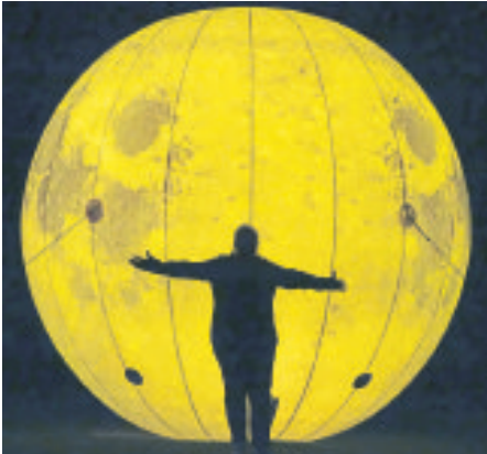
Zum Kugeln: Im Böhmepark hatte es eine „Mondlandung“ gegeben.

SOLTAU (mk). In verschiedenen Farben leuchtende Pilze, mystische Kristalle, bunte Kegel, funkelnde Stangen, illuminierte Märchenfiguren und vieles mehr gab es am vergangenen Samstagabend im Soltauer Böhmepark zu bestaunen. Aber nicht nur in der grünen Oase im Herzen der Stadt hieß es „Licht an!“, denn auch an anderen Orten in der Böhme Stadt ging den Besucherinnen und Besuchern mehr als ein Licht auf.