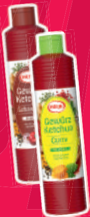
Hela Gewürz-Ketchup verschiedene Sorten 800-ml-Flasche je (1 Liter = 1,81 €)