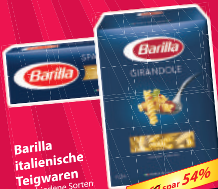
Barilla italienische Teigwaren verschiedene Sorten 500-g-Packung je (1 kg = 1,54 €) oder Barilla Pastasauce 400-g-Glas je 1,79 € (1 kg = 4,48 €)