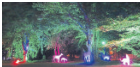
Tierisch gute „Lightshow“ in der Nähe der Bibliothek Waldmühle.

to „Lichtkunst trifft Dichtkunst“ verzauberten faszinierende Lichtspiele und traditionelle und moderne Gedichtkunst jung und alt. So war zum Beispiel beim freundlich dreinschauenden „Leuchtfisch“ die Geschichte „Vom Fischer und seiner Frau“ zu hören. Weil es bei dieser kostenlos zu genießenden Veranstaltung keine Ein- und Ausgänge gab, blieb das große Gedränge aus, die Besucher hatten in Corona-Zeiten ausreichend Möglichkeiten, sich aus dem Weg zu gehen. Von vielen Nachtschwärmern war Lob zu hören. Es kam gut an, dass die Stadt Soltau mit dieser Veranstaltung in schwierigen Zeiten für Lichtblicke gesorgt hatte.