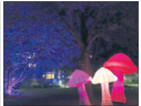
Blauer Baum mit Pilzbefall: Ein weiterer Augenschmaus bei der „Licht an!“-Veranstaltung.