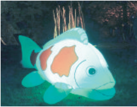
Selten an Land? Dieser Fisch bewies das Gegenteil.

„Licht an!“ in Soltau: Besucher erfreuen sich an Lichtinstallationen