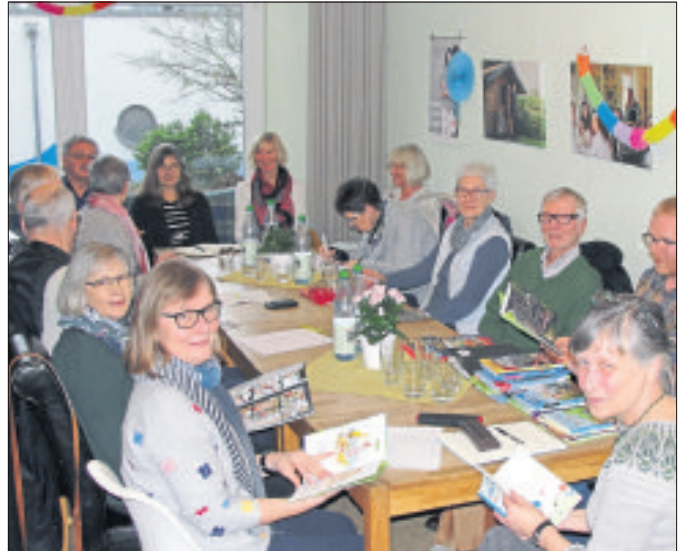
Die Lesementoren des Mehrgenerationenhauses Schneverdingen, auf dem Bild ist eine Zusammenkunft während eines Stammtisch-Treffens vor der Corona-Pandemie zu sehen, suchen zum Schulstart wieder neue interessierte Helfer.

Für neue Interessierte findet eine Einführungsveranstaltung am Donnerstag, 9. September, um 16 Uhr im Mehrgenerationenhaus, Osterwaldweg 9, statt. Um Anmeldung wird gebeten. Weitere Informationen sind erhältlich im Mehrgenerationenhaus unter der Telefonnummer (05193) 9769889 oder bei der MENTOR-Koordinatorin Angelika Schönberg unter der Telefonnummer (05193) 52552. Weiterhin besteht die Möglichkeit, sich im Internet unter www.mentor-schneverdingen.de zu informieren.