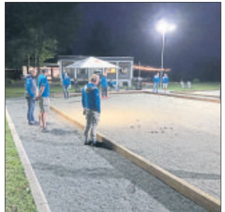
In einem herrlichen Ambiente stehen sich die beiden Vertretungen des FV Dittmern unter Flutlicht gegenüber.