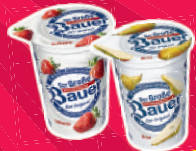
Bauer Frucht-Joghurt verschiedene Sorten 250-g-Becher je (100 g = 0,18 €)