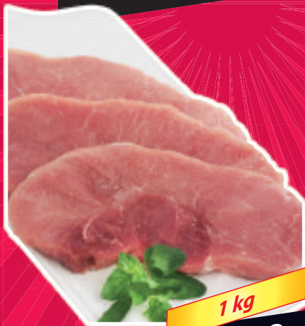
Schweine-Schnitzel vom Schinken, in Scheiben