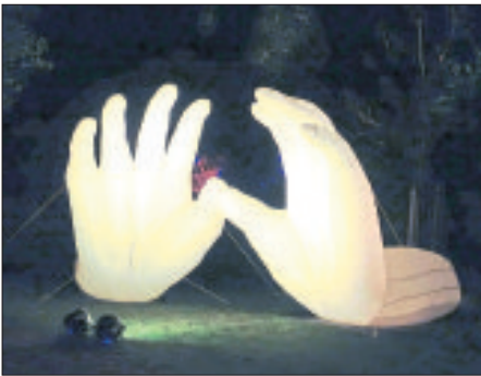
Hoch die Hände, Wochenende. Dass diese Lichtinstallation gut ankam, kann sich eigentlich jeder an den fünf Fingern abzählen.