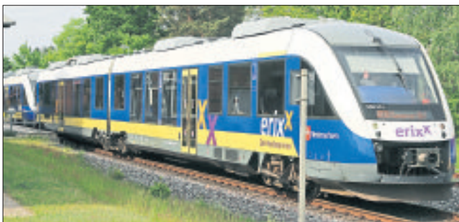
Winke aus dem Führerstand: Der „Erixx“ verabschiedet sich in rund drei Monaten, und ab dem 12. Dezember übernimmt dann „Start Niedersachsen Mitte“ die Bahnstrecke durch die Heide.