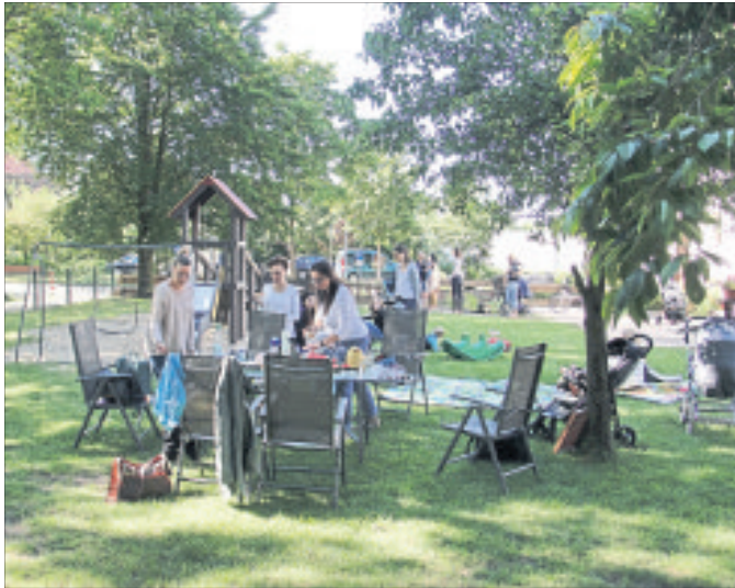
Viel familiengerechten Platz für Kindern mit ihren Eltern bietet das Mehrgenerationenhaus mit seinem Außengelände und seinem Haus am Osterwaldweg 9.

Neustart für Krabbelgruppe im Mehrgenerationenhaus