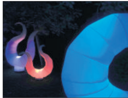
Auch dieser Hingucker sorgte im Böhmepark für leuchtende Augen und war ein beliebtes Fotomotiv.