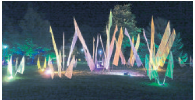
Ein Blickfang im Böhmepark: Hier konnten die Besucher auf Tuchfühlung gehen.

Die Filzwelt Felto wurde mit Strahlern in Szene gesetzt, an Krauls Eck gab es für die „Heide-Ecke“ eine stimmungsvolle Beleuchtung und auch in der Marktstraße und am Georges-LeMoine-Platz sorgten eigens installierte Lichtquellen für besondere Akzente. Die Kirchen, ohnehin Hingucker, wurden ebenfalls farbenfroh in Szene gesetzt. Die vielen Besucher, die die einzelnen Stationen wie die Motten das Licht umschwirren und den optischen Zauber mit ihren Handykameras und Fotoapparaten im Bild festhielten, zeigten sich begeistert. Weil das traditionelle Lichterfest, das stets am ersten Samstag im September auf dem Programm steht, pandemiebedingt hatte abgesagt werden müssen, gab es, sozusagen als Trostpflaster, auch in diesem Jahr die „Licht an!“-Veranstaltung, zu der die Stadt Soltau zum zweiten Mal eingeladen hatte. Und auch diesmal lohnte sich der Spaziergang. Besucherinnen und Besucher aller Altersklassen machten sich zu später Stunde auf den Weg in die Stadt. Davon profitierten auch die Gastronomobetriebe, Tische im Frei-