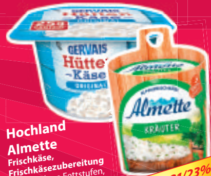
Hochland Almette Frischkäse, Frischkäsezubereitung, verschiedene Fettstufen, Sorten, 150/125 g

oder Gervais Hütten-Käse 3,9 % Fett, 200 g Becher je (100 g = 0,50–0,79 €)