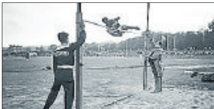
Ehe Dick Fosbury den nach ihm benannten Flop erfand, überquerten die Springer die Latte im Straddle oder Schwersprung.

Die Teilnehmerinnen und Teilnehmer erhalten eine Urkunde mit Namen und übersprungener Höhe. Der Hochsprungtag am Freitag, 10. September, beginnt für Schülerinnen und Schüler (10 bis 13 Jahre) um 16.30 Uhr, für Jugendliche um 17 Uhr und für Erwachsene um 17.45 Uhr, es findet auch eine Sportabzeichen-Ab-