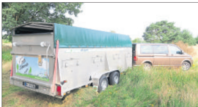
Zugleich Transportmittel und Unterkunft, wenn die Heidschnucken auf ihren „Ausflügen“ auswärts nächtigen. Der Schnucken-Shuttle ist aber nicht nur „Wohnwagen“, sondern ebenso „Mobile Office“-Basis: Denn dort, wo der Anhänger steht, sollen die Tiere auch „arbeiten“, also die Heideflächen pflegen.