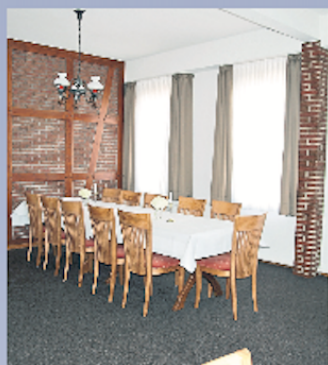
Das hell und modern gestaltete Esszimmer bietet sich für kleinere Familienfeiern oder als kleiner Tagungsraum an.

DORFMARK. Das Gasthaus Meding in Dorfmark ist ein Schmuckstück für den Ort, setzt mit der cremeweißen Holzfassade und den dunklen Holzbalken optische Akzente. Jetzt haben Carsten und Kathrin Meding aufwendige Umbau- und Sanierungsarbeiten an dem Traditionshaus abgeschlossen. Im Juni waren die Bauarbeiten gestartet. Das knapp 120 Jahre alte Haus war undicht geworden und wurde komplett neu gedeckt, die Fassade hat einen neuen Erhaltungsanstrich erhalten. Zentrales Element der Bauarbeiten war aber die Erneuerung der An- und Abluftanlage in der Küche – diese sichert zusammen mit ebenfalls neuen Raumlufreinigern sowohl für die Mitarbeiter als auch für die Gäste optimal gereinigte und ausgetauschte Raumluft in allen Bereichen.