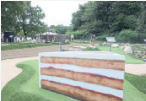
Auch ein Symbol der Heideregion: die Buchweizenorte – hier in Übergröße dargestellt.

Im Eingangsbereich der Anlage befindet sich ein Kiosk, bei dem nicht nur der Eintritt zu entrichten ist, sondern auch kleine Erfrischungen wie Eis, Süßes oder auch ein Kaffee erworben werden können. Wer vor oder nach einem Match noch ein bisschen verweilen möchte, nimmt auf der zum Kiosk angrenzenden Kaffeeterrasse Platz – hier wartet der Bauherr aller-