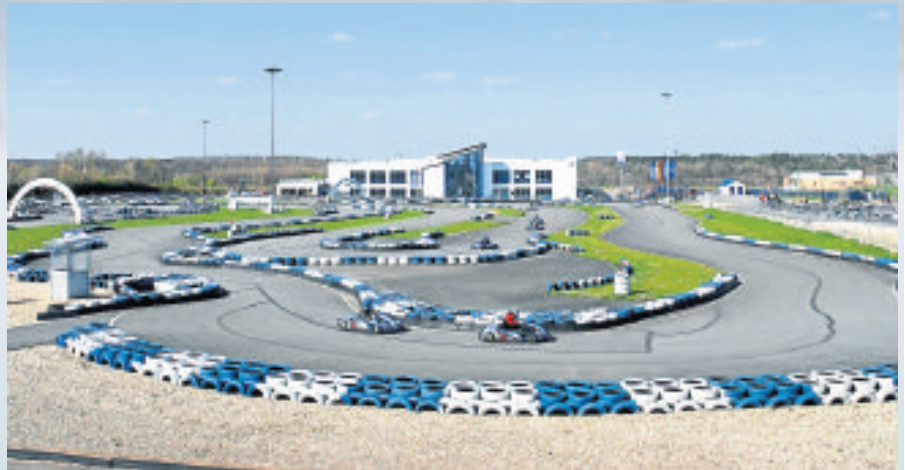
Auf der 1000 Meter langen Außenstrecke wechseln sich lange Geraden und schnelle Kurven ab, außerdem bietet sich die breite Streckenführung für Überholmanöver an. Ebenso wie im Innenbereich gewährleistet maximaler Grip auch bei Top-Speed eine sehr gute Bodenhaftung der Karts.