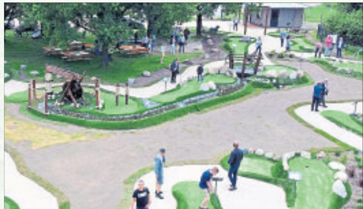
Die Schnuckengolf-Anlage ist eröffnet. Im Hintergrund ist der Eingangsbereich mit dem Kiosk zu sehen, dahinter wird mit dem Turm des Abenteuerspielplatzes die unmittelbare Anbindung erkennbar.

Wesselohrer Ehepaar Tödter setzt seine Idee in die Tat um