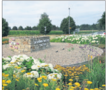
Dem Kreisverkehr beim Designer Outlet Center blüht was: Am morgigen Montag beginnen dort Sanierungsmaßnahmen.

Die Umleitung für den überörtlichen Verkehr der Kreisstraße 10 sowie die Zufahrt zum Designer Outlet Center Soltau verläuft laut Kreisverwaltung über die B 71 bis Hermansbeck und von dort über Suroide bis