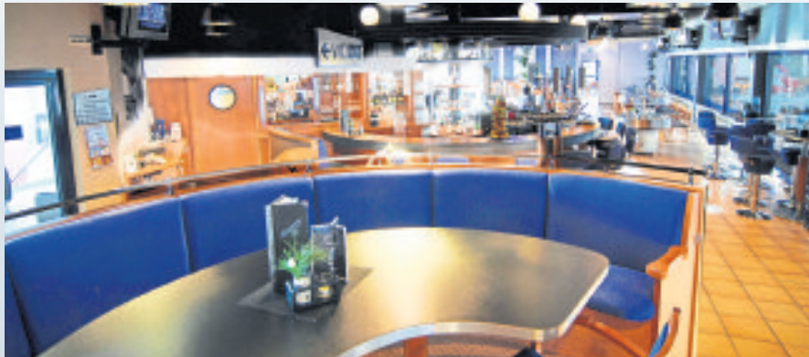
Schon lange kein Geheimtipp mehr: die Gastronomie im Ralf-Schumacher-Kartcenter. Von den Plätzen rechts am Fenster haben die Gäste einen tollen Blick auf das Rennschöne eine Etage tiefer.