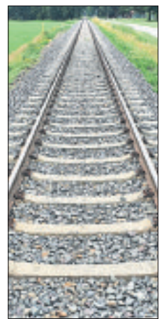
Die Grünen möchten hiesige Bahnstrecken reaktivieren.