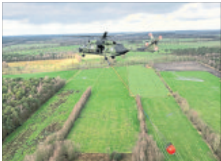
Das Löschverfahren aus der Luft übt das Transporthubschrauberregiment 10 „Lüneburger Heide“ vom 9. bis 13. August.

Munster, Bergen und Faßberg den gezielten Wasserabwurf zur Brandbekämpfung - und zwar im Bereich westlich von Munster. „Damit soll die Fähigkeit zur koordinierten und effizienten Brandbekämpfung geübt werden“, betont die zuständige Projektkoordinatorin. Das Transporthubschrauberregiment 10 weist darauf hin, dass es wegen der Übung vom 10. bis 12. August zwischen 13 und 15 Uhr vermehrt Flugbetrieb im Raum der offiziellen Wassereinsatzstellen Hollmoorteech und Reininger Mühlenteich geben wird.