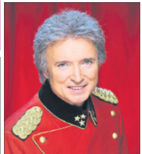
„Das Wolgalied - Total emotional“ lautet der Titel des Konzertes, das Peter Orloff und der Schwarzmeer-Kosaken-Chor am 17. August in der Eine-Welt-Kirche in Schneverdingen geben.

Peter Orloff und die Schwarzmeer-Kosaken