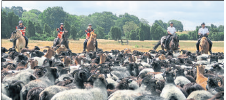
In diesen Tagen sind sie im Naturschutzgebiet Lüneburger Heide wieder im Einsatz und sorgen für mehr Sicherheit: Beamte von der Polizei-Reiterstaffel Hannover sowie Kräfte der Sanitätsreiter der Johanniter-Unfall-Hilfe.

Polizei- und Sanitätsreiter zusammen mit Naturwacht wieder im Einsatz