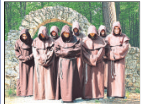
„The Gregorian Voices“ geben am 15. August im Rahmen ihrer Tournee ein Konzert in der St. Urbanikirche Munster.

„The Gregorian Voices“ zu Gast in Munster