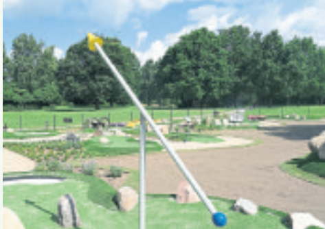
Die Sonnenuhr in der Nähe des Schneverdingen Heidegartens ist eines der Motive der 18-Loch-Minigolfanlage.

Die 18-Loch-Minigolfanlage widmet sich dem Thema Lüneburger Heide – dies ist an allen Spielstationen ganz deutlich zu sehen. Jedes der Löcher hat ein besonderes Motiv, das einen Bezug zur Region herstellt. So gibt es gleich zu Beginn die Lüneburger Salzsau zu sehen, Loch zwei zeigt den Wilseder Berg in Miniformat. Weitere Löcher haben Motive wie etwa die Schneverdingen Sonnenuhr, eine Kreuzotter, Heide-Kutschen, eine Buchweizenorte in Übergröße, die Heidekartoffeln, das Schneverdingen Pleitzmoor mit seinen blauen Fröschen oder die Wassermühlen der Region. Abgeschlossen wird der Kurs auf Loch 18 mit dem Symboltier der Region, der Heidschnucke. Alle Bahnen sind mit Hinweisschildern versehen, die die einzelnen Motive und ihre Verbindung zur Region beschreiben.