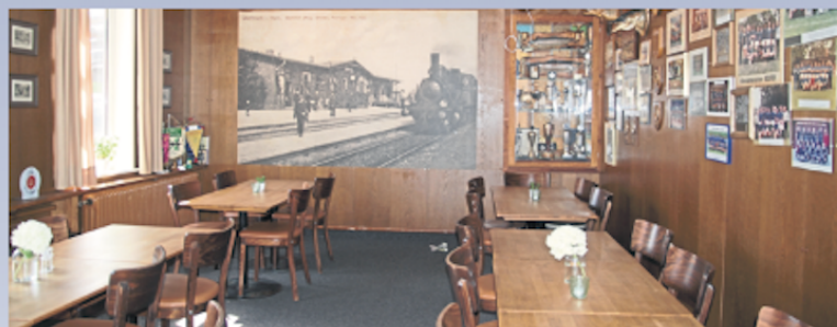
Eine Hommage an vergangene Zeiten, als das Vereinsleben wesentlich das Gasthaus prägte: das Clubzimmer.